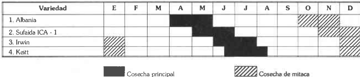
FIGURA 1. Extensión de la cosecha de mango en la zona plana del Tolima con cuatro variedades de maduración diferente.

El mango es otra especie en la cual existen variedades con época diferente de cosecha. Para ilustrar lo que sucede con la cosecha de mango en la zona plana del Tolima, cuando se siembran sólo cuatro variedades injertadas sobre el mismo patrón, se puede analizar la Figura 1.