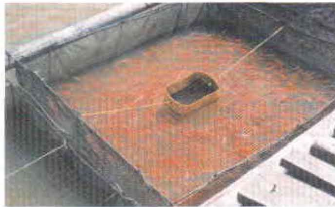
FIGURA 3. Alimentador elaborado con caneca plástica. Jaula cubierta con malla antipájaro. Embalse de Betania (Huila). Diseño integral de la infraestructura