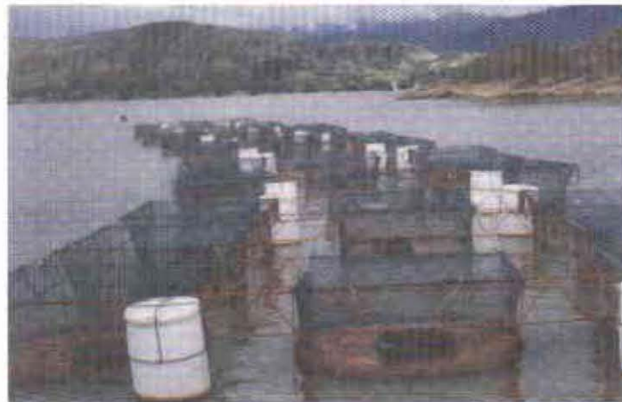
FIGURA 4 . Modelo integrador de Jaulas de Bajo Volumen Alta Densidad, adicionalmente se observa el uso de canecas plásticas como sistema de flotación y alimentador de sección de caneca y estructura de soporte de malla en varillas de hierro. Embalse de Betania (Huila)