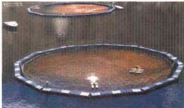
FIGURA 5. Jaulón de estructura modular, con 12 estructuras metálicas soportadas en bloques de icopor y con sistema de aireación. Embalse de Betania (Huila)