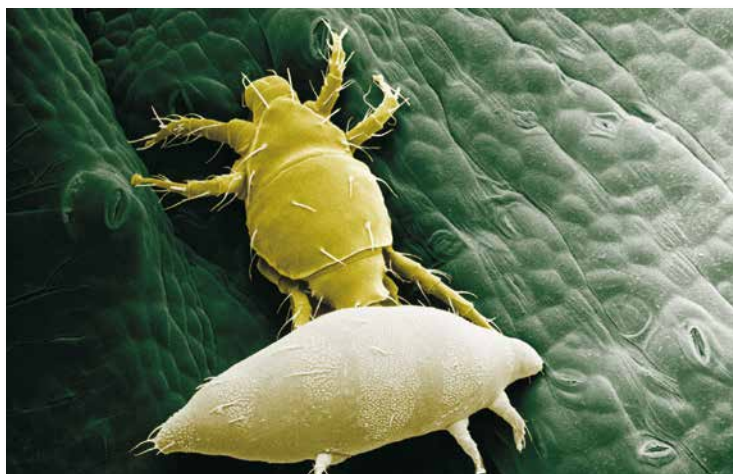
Figura 2. El ácaro blanco tropical, Polyphagotarsonemus latus (Banks). Macho (arriba) transportando una larva (hembra) (abajo).

La especie de mayor importancia es el ácaro blanco tropical Polyphagotarsonemus latus (Figura 2), conocido por su amplia distribución geográfica y la gran diversidad de hospederos que tiene en Colombia. Esta especie tiene una amplia gama de hospederos y tiene una distribución cosmopolita y es conocida por un diverso número de nombres comunes. Se encuentra en Australia, Asia, África, Europa, América del Norte, América del Sur y las Islas del Pacífico. En India y Sri Lanka se le denomina el “ácaro amarillo del té”, mientras que en Bangladesh lo llaman el “ácaro de yute de color amarillo”. En algunas partes de América del Sur se le llama el “ácaro blanco tropical” (Peña, 2003).