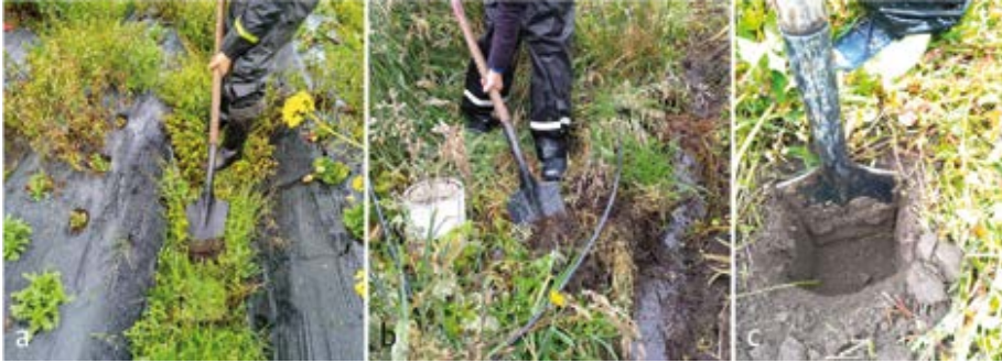
Figura 6 Imágenes que muestran el proceso de toma de muestras de suelo para análisis fisicoquímico: a) Retiro de capa superficial. b) Apertura de cajuela. c) Recolección de muestra de suelo (1 kg por cada muestra y punto de muestreo).