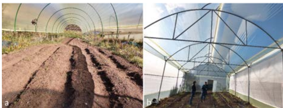
Figura 4 Tipos de invernaderos que se pueden emplear para el desarrollo del cultivo de espárrago en climas fríos: a) Invernadero tipo tubular. b) Invernadero tipo capilla.

Cuando la altitud del terreno sea superior a los 2200 m s. n. m. se recomienda la construcción de invernaderos para el establecimiento del cultivo, con el fin de mantener la temperatura entre los 18 y 24 °C, rango que garantiza su adecuado desarrollo. Para la regulación de las condiciones climáticas bajo el invernadero es importante que este cuente con cortinas que puedan abrirse y cerrarse con facilidad, sin importar si el invernadero es de tipo tubular o en capilla (Figura 4).