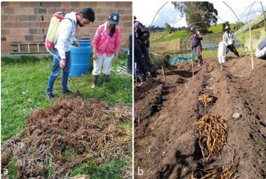
Figura 5 Siembra de garras de espárrago, que son sometidas a un proceso de desinfección antes de su disposición sobre los surcos de siembra. a) Desinfección de garras. b) Disposición en surcos.

Fuente: Equipo CTA-2, Subproyecto Semillas (2019).