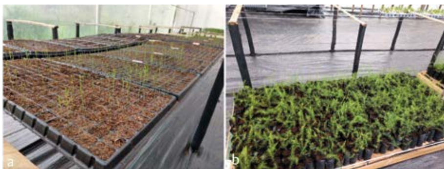
Figura 3 Plántulas de espárrago en bandeja de germinación (a) y en bolsa (b).