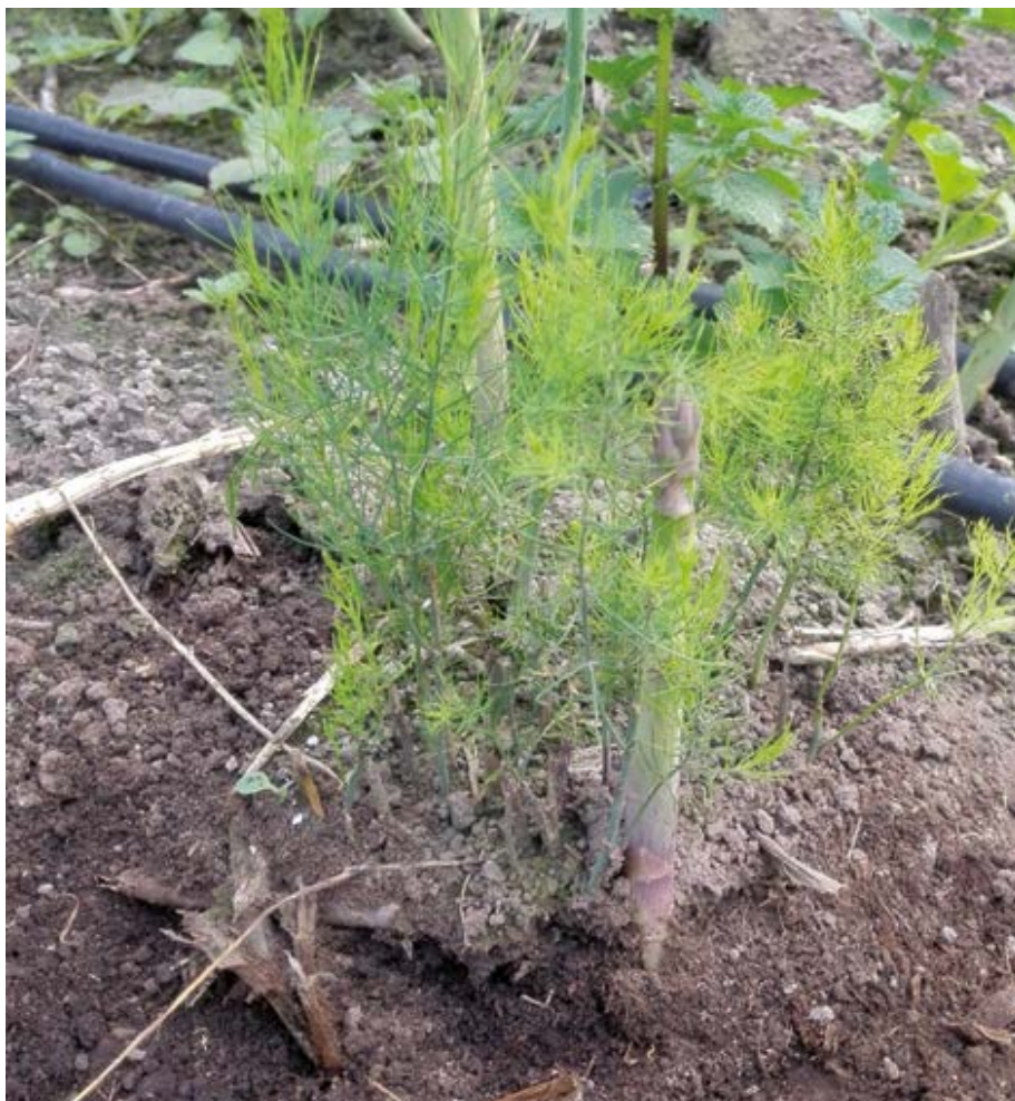
Figura 1 Planta de espárrago en la que se observan ramas y un turión.