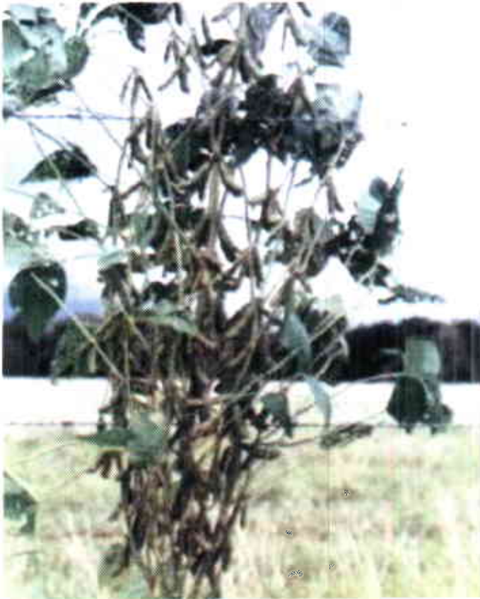
Variedad de soya . Corpoica Taluma 5.