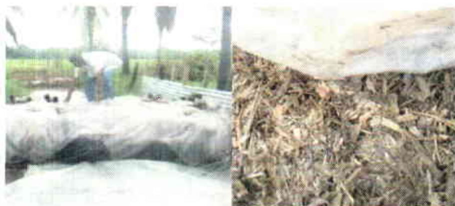
Ensilaje de cultivos forrajeros