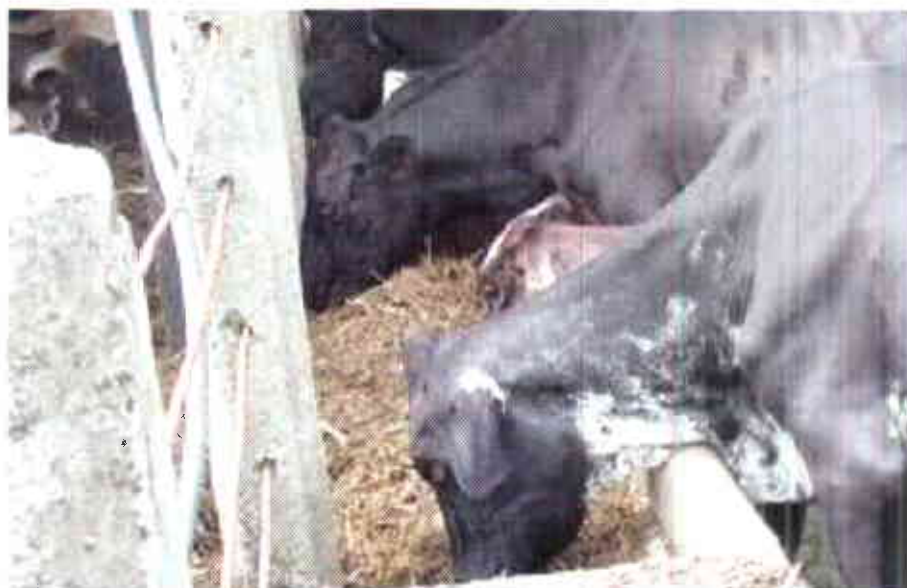
Alimentación bovina con ensilaje.

Bueno G. y otros (2003) reportan incrementos en la producción de leche en vacas del sistema de producción doble propósito. De la suplementación con 30 kg/animal/día de ensilaje de maíz-soya (65-35%) durante la época de verano (121 días) se obtuvo una producción promedio de 6.4 l/vaca/día; y en la época de invierno (107 días), con un consumo cercano a los 15 kg/animal/día, la producción diaria de leche fue de 5.0 l/vaca/día. En ambos casos estas producciones fueron superiores a las reportadas por Parra y otros (2000), que en su estudio estimaron la producción promedio de la región en 4.1 l/vaca/día en pastoreo B. decumbens . Los incrementos de leche obtenidos con respecto al testigo regional fueron del orden del 53.6% en la época de verano y un 26.8% en la época de invierno. Tabla 7.