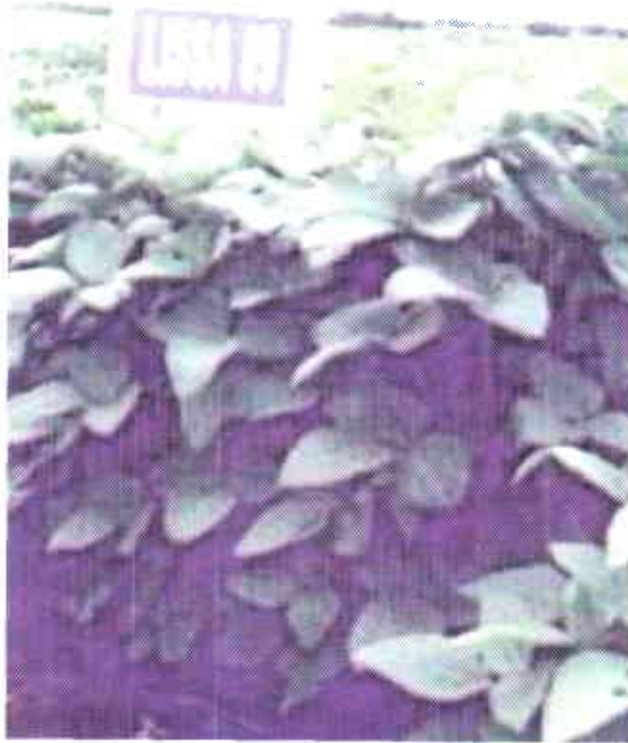
Variedad de soya . Corpoica Taluma 5.

La soya es un cultivo anual, se adapta a climas cálidos y altitudes entre los 360 y 1.200 msnm, se comporta bien en suelos de vega (clase I), suelos de la altillanura y terrazas altas (clase IV), con saturaciones de aluminio inferiores a 60%.