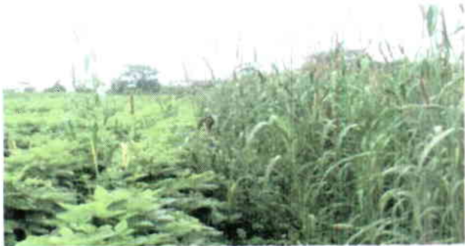
Soya y millo sembrados en parcelas separadas, en fincas de productores del Piedemonte Llanero.