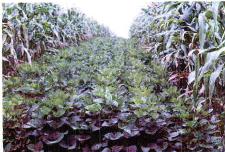
Cultivo de soya intercalada con maíz.

El objetivo de la utilización del forraje de soya es involucrarlo como componente proteico en la asociación de gramínea-leguminosa para mejorar el valor nutritivo de los productos en los diferentes sistemas de conservación de alimentos para bovinos, los cuales se utilizarían principalmente en la época crítica de escasez de forrajes.