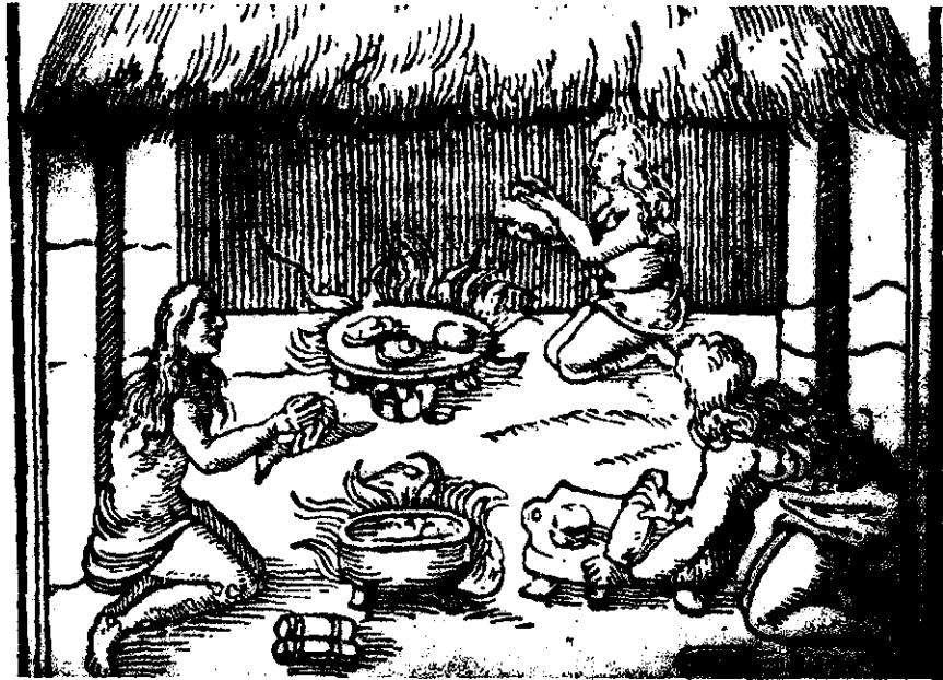
FIGURA 2. Indios tostando y moliendo el cacao para la preparación del chocolate. Ilustración del libro de C. Bensoni: "La historia del Nuevo Mundo, Edición holandesa, 1565 .

En la Figura 2 se muestra la forma como los indios preparaban el chocolate, según una ilustración tomada del libro "La Historia del Nuevo Mundo" que publicó el italiano Girolamo Benzoni en 1565, después de viajar durante 14 años por el Nuevo Mundo, libro en el cual hace una descripción muy minuciosa del cultivo del cacao y sus usos por los indios americanos.