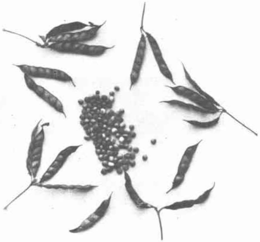
FIGURA 3. Frutos y semillas de Guandul.