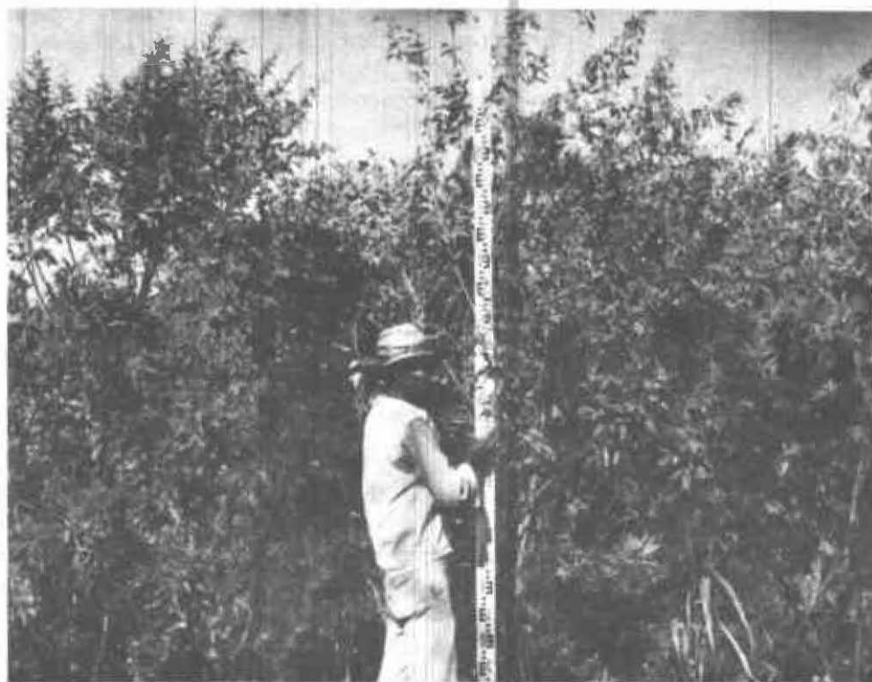
FIGURA 2. Las plantas de Guandul, según la variedad, pueden alcanzar más de tres metros de altura.

La capacidad de rendimiento del guandul puede estar relacionada con su adaptación al clima y la clase de suelos, su resistencia a las plagas y a enfermedades. Es factible incrementar el rendimiento promedio anual, por lo menos que se triplique, mediante el cultivo de variedades adaptables y el empleo de prácticas de cultivo adecuadas.