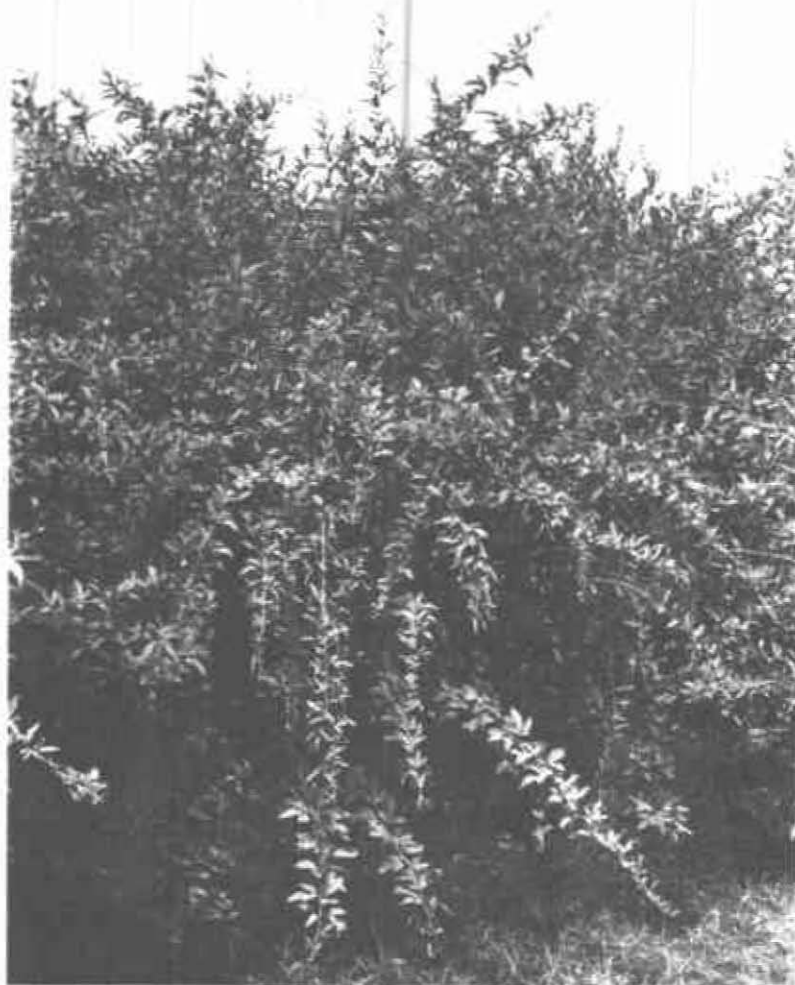
FIGURA 1. Cultivo de Guandul.