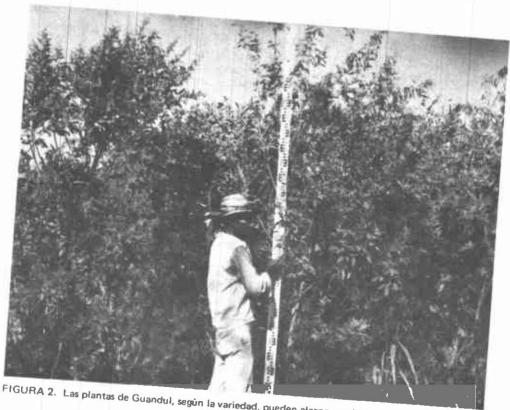
FIGURA 2. Las plantas de Guandul, según la variedad, pueden alcanzar más de tres metros de altura.

La capacidad de rendimiento del guandul puede estar relacionada con su adaptación al clima y la clase de suelos, su resistencia a las plagas y a enfermedades. Es factible incrementar el rendimiento promedio anual, por lo menos que se triplique, mediante el cultivo de variedades adaptables y el empleo de prácticas de cultivo adecuadas.