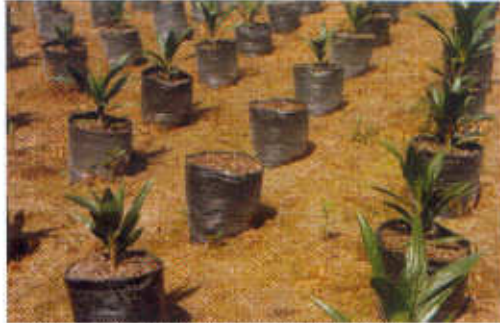
Foto 14. Espacios perdidos por fallas en la germinación.

En los viveros de una fase, es recomendable acondicionar una sección en la que se siembre hasta un 5% del pedido total de semillas en bolsas pequeñas, con el propósito de reemplazar las que no se desarrollan normalmente o las descartadas por ser anormales.