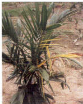
Foto 67. Plántula quimera.

3.7.5. Cuarta ronda de selección. La última selección en vivero se realiza al momento del despacho de las plántulas al campo. Tiene como objetivo eliminar aquellas que por diversas causas han pasado inadvertidas en rondas previas de selección.