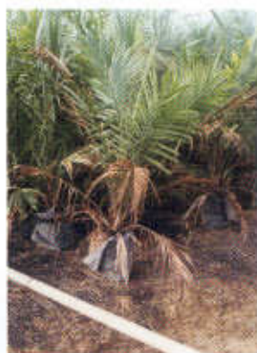
Foto 68. Palma quemada por aplicación de herbicida.

Las plántulas enviadas al campo no deben presentar ninguna de las características que aparecen en las ilustraciones anteriores. Sin embargo, también es normal encontrar plántulas enfermas y afectadas por otro tipo de daños causados mecánicamente o por efecto de aplicaciones de herbicidas (Fotos 68 y 69).