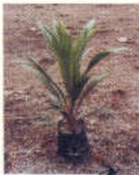
Foto 64. Plántula juvenil.