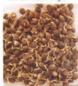
Foto 11. Semillas secas.