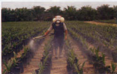
Foto 74. Aplicación preventiva para control de enfermedades y plagas.

Las medidas de control preventivo de enfermedades comienzan cuando las plántulas tienen cuatro hojas completamente abiertas o cuando se observan los primeros síntomas de una enfermedad o la presencia de una plaga. Normalmente en los viveros se hacen aspersiones preventivas de insecticidas y fungicidas cada semana, hasta cuando se ha ganado suficiente experiencia para usar un programa de manejo integrado de plagas y enfermedades, fundamentado en la detección oportuna de las mismas. (Foto 74).