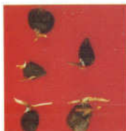
Foto 9. Semillas con hongos.