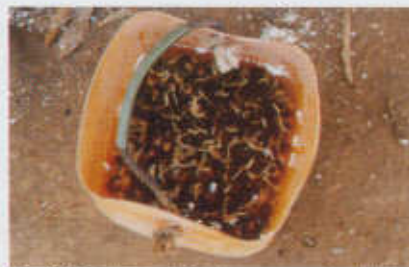
Foto 31. Semillas en recipientes con agua antes de la siembra.

- Llevar las semillas germinadas al vivero en recipientes con agua para evitar la resequeidad y daños. (Foto 31).