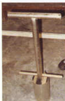
Foto 33. Ahoyador manual para ahoyar en bolsas grandes.

- Hacer el ahoyado en las bolsas grandes con la ayuda de un ahoyador manual; el hueco puede tener unos 15 centímetros de diámetro y 25 cm. de profundidad. (Fotos 33, 34 y 35)