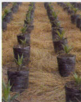
Foto 81. Control entre bolsas con químico y en la bolsa con cuezco.

Para controlar las malezas que crecen en las bolsas, es preferible su eliminación manual; sin embargo, resulta de gran utilidad la aplicación de una capa de cascarilla de palma o arroz, con dos a cuatro centímetros de espesor. La cascarilla hace que el suelo de la bolsa no se compacte, así se facilita la extracción manual de las malezas, sin causar daño a las plántulas. Entre las bolsas grandes, crecen las malezas, favorecidas por el cuidado que se presta al vivero. Para su control, se emplean herbicidas. (Foto 81).