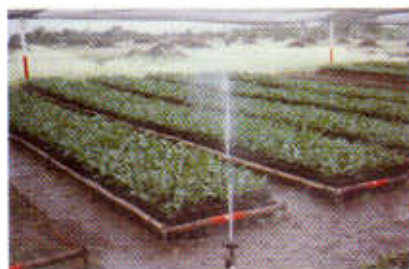
Foto 46. Riego por aspersión en previvero.

Es necesario que el viverista se asesore de un técnico especializado en el montaje de sistemas de riego, pues de otra manera se incurre en costos innecesarios o se falla en las especificaciones técnicas del diseño, con sus obvias implicaciones.