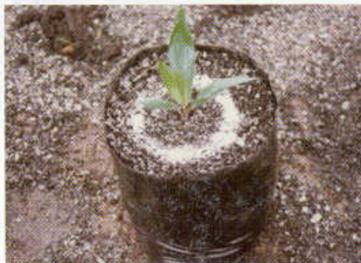
Foto 51. Aplicación de fertilizante en círculo.