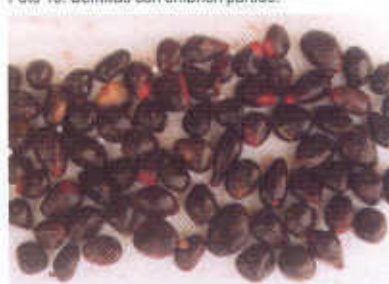
Foto 12. Semillas sin germinar.

1.2.5. ¿Cuándo y cuánta semilla de palma de aceite ordenar? Normalmente un pedido se ordena con un año de anticipación a la fecha prevista para comenzar el establecimiento del vivero. Se presenta un ejemplo de cómo calcular la cantidad de semilla y el área requerida para un vivero en el anexo 2.