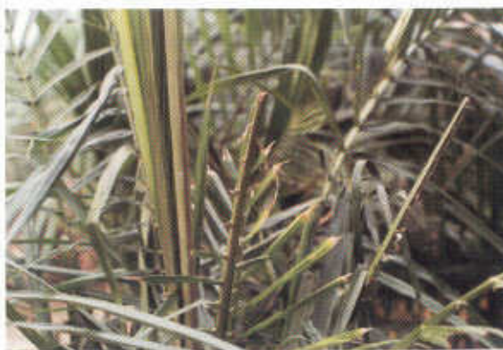
Foto 69. Palma afectada por daños mecánicos.