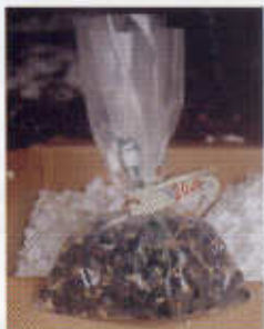
Foto 7. Bolsa con semillas germinadas.

La semilla germinada al momento de ser despachada desde los sitios de origen, se introduce en grupos de 200 a 250 por bolsa; ésta es plástica, transparente, de 26 x 35 centímetros y 5 micras de espesor. En una caja se acomodan 10 a 12 bolsas con un total de 2.000 a 2.400 semillas acompañadas de una tarjeta con la siguiente información: número de cruzamiento, fecha de iniciación de la germinación, tratamiento químico recibido y fecha en que salió del germinador. Esta información es la garantía para el manejo de la semilla. (Fotos 7 y 8).