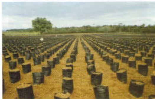
Foto 25. Bolsas grandes ya distanciadas listas para siembra de semilla.

En viveros del sudeste asiático, era común hacer hileras de dos y algunas veces de cuatro palmas y después separarlas con el espaciado deseado; esta práctica resultaba costosa por involucrar mayor cantidad de mano de obra. Es por esta razón que se adoptó la práctica de colocar las bolsas en el sitio que ocuparán hasta el final del vivero para evitar movimientos posteriores, allí permanecen hasta cuando van al campo. En viveros de San Carlos de Guaroa, en la Zona Oriental de Colombia 8 , se acostumbra hacer este tipo de viveros con bolsas grandes ya distanciadas en las cuales se hace la siembra de las semillas germinadas en forma directa. (Foto 25).