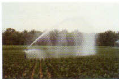
Foto 47. Riego por aspersión en vivero.

3.5.3. Sistema de riego por cinta perforada. Este sistema es una modalidad de riego por aspersión y consiste en un tubo a manera de cinta postrada, la cual se ha perforado por medio del láser para formar dos líneas de orificios separados por 15 centímetros a lo largo de su extensión total; estos tubos vienen en rollos de 100 metros y pesan aproximadamente 2.5 kilogramos cada uno, su vida útil es de cinco años.