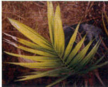
Foto 50. Decoloración anaranjada producida por deficiencia de magnesio.

Descripción de la deficiencia: se caracteriza por una decoloración anaranjada brillante de las hojas más viejas. Las hojas que reciben sombra no muestran síntomas. (Foto 50).