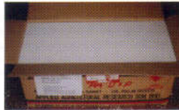
Foto 6. Interior de la caja de cartón protegida con icopor.

Cuando se adquiere semilla precalentada, se debe proceder de la siguiente manera: