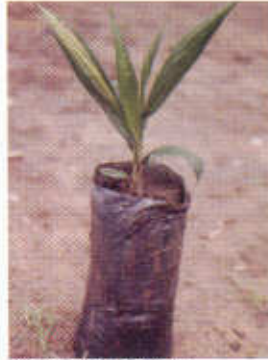
Foto 60. Plántula quimera.

3.7.3. Segunda ronda de selección. La segunda ronda de selección se hace tres meses después de la primera. Sirve para detectar las plántulas anormales que pudieran haber pasado inadvertidas durante la primera ronda o aquellas que manifiestan alguna anomalía a esa edad.