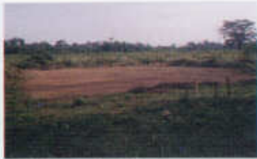
Foto 20. Terreno despejado para un vivero pequeño.