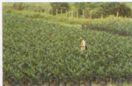
Foto 73. Revisión para detectar problemas sanitarios.

3.8. Control sanitario. El control sanitario se hace para prevenir los daños causados por plagas y enfermedades en el vivero, que pueden ocasionar pérdidas importantes de plántulas, si no se toman las medidas correctivas en el momento oportuno. Para tomar decisiones preventivas es necesario disponer de un operario lo suficientemente entrenado en detectar los brotes iniciales de insectos o enfermedades en el vivero. (Foto 73).