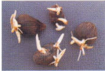
Foto 3. Semillas germinadas con tres embriones.