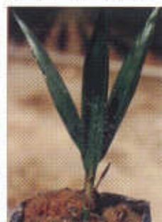
Foto 57. Plántula enrollada.