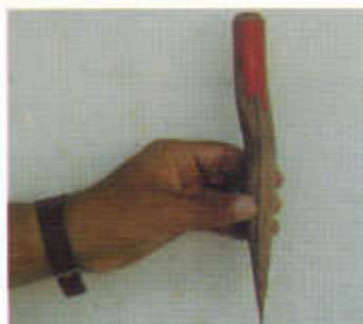
Foto 30. Trozo de madera utilizado para ahoyar en bolsa pequeña.

- Colocar la semilla en el hoyo, dejando la plúmula hacia arriba y la radícula hacia abajo. La radícula se identifica fácilmente, porque tiene una forma de gorra. (Fig 2)