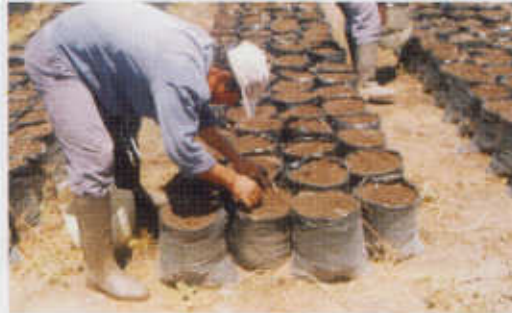
Foto 13. Siembra de semillas en viveros de una fase.