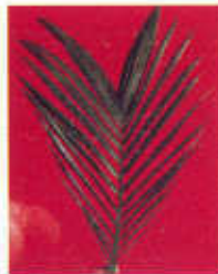
Foto 65. Plántula entrenudos cortos.