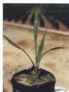
Foto 55. Plántula tipo pasto.