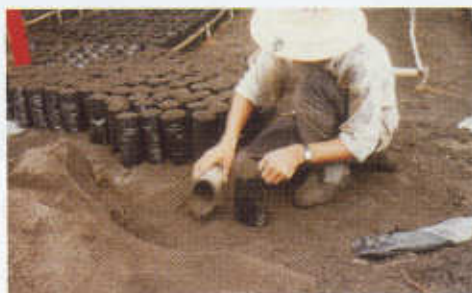
Foto 27. Llenado de bolsas con sección de tubo PVC.

- Para el llenado de bolsas grandes, introducir una sección cilíndrica de las mismas dimensiones de la bolsa para mantenerlas en posición vertical, luego introducir el suelo con una pala y retirar la sección cilíndrica y completar el llenado con el suelo faltante.