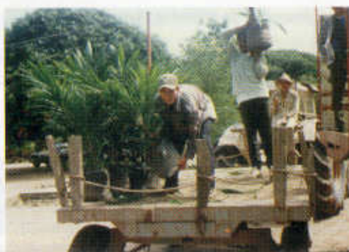
Foto 83. Correcto manejo de plántulas durante el transporte.