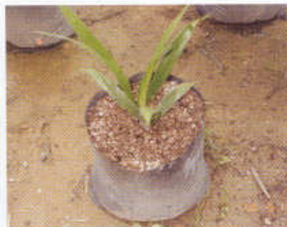
Foto 40. Capa de cuesco aplicada después de la siembra.