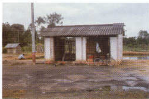
Foto 26. Caseta para guardar y controlar insumos y equipos.

2.4.4. Caseta para insumos y materiales. Es importante construir una edificación con excelente ventilación en el área del vivero, siempre y cuando el tamaño y la frecuencia de los viveros lo justifiquen. En dicha edificación se almacenan en forma separada y suficientemente identificados los equipos empleados para la aplicación de agroquímicos. (Foto 26).