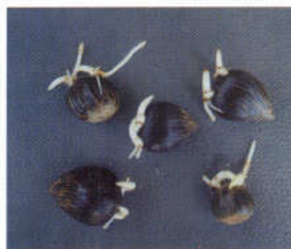
Foto 2. Semillas germinadas con dos embriones.