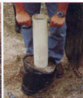
Foto 35. Ahoyador en tubo de PVC.

- Rasgar manualmente la bolsa pequeña hasta dejar el bloque húmedo formado por el suelo y las raíces de la plántula e introducirlo en el hueco hecho con el ahoyador. (Fotos 36, 37, 38 y 39).