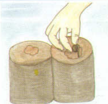
Fig. 2 Posición de la semilla durante la siembra.

- Colocar la semilla en el hoyo, dejando la plúmula hacia arriba y la radícula hacia abajo. La radícula se identifica fácilmente, porque tiene una forma de gorra. (Fig 2)