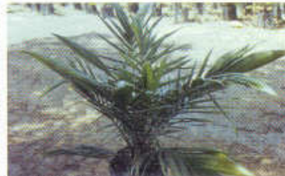
Foto 63. Plántula plana.