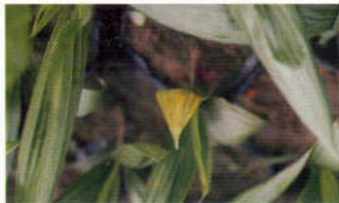
Foto 75. Planta atacada por ácaros.

Ácaros o arañas rojas: el daño de estos arácnidos consiste en succionar los líquidos del tejido foliar hasta inducir un amarillamiento de las hojas. Su presencia se confirma con la aparición de una telaraña fina y sedosa en el envés de la hoja. Grandes infestaciones producirán síntomas similares a la deficiencia de magnesio. Para su control es necesario utilizar un acaricida y no un insecticida. Las aplicaciones se dirigen a la cara inferior de las hojas que es donde se encuentran. (Foto 75).