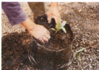
Fotos 41, 42, 43 y 44. Separación y transplante de mellizas.

- Colocarlas en una sección separada en donde recibirán una mayor observación y aplicación de riego cada día. Dos semanas después, pueden recibir el tratamiento que se da a las demás.