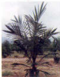
Foto 61. Plántula normal.

Como guía de trabajo se ilustran las plántulas normales y las anomalías típicas de las plántulas entre los siete y ocho meses de edad. (Fotos 61, 62, 63, 65, 66 y 67).