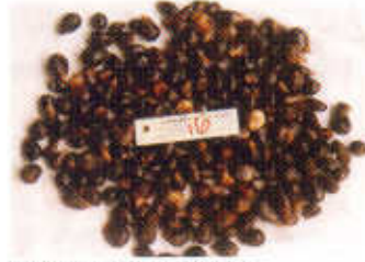
Foto 4. Semillas precalentadas.

1.2.1. Semilla precalentada. Esta semilla se recibe empacada en doble bolsa para evitar la pérdida de humedad. Se entrega embalada en cajas de madera o cartón parafinado, forrada en su interior con láminas de icopor (Fotos 5 y 6). Cada caja puede contener de siete a ocho bolsas de plástico y cada bolsa unas 700 semillas.