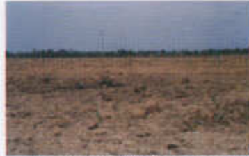
Foto 21. Terreno despejado para un vivero grande.

Cuando el vivero se hace sobre la fuente de suelo y se tiene planeado el riego por gravedad, se diseñan las melgas a partir de las curvas de nivel del terreno. El tamaño y forma de las melgas está relacionada con el grado de la pendiente del terreno.