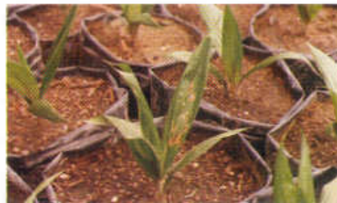
Foto 76. Raspaduras de defoliadores.

Defoliadores: eventualmente aparecen larvas comedoras de follaje. Lo más normal, es realizar una rutina periódica de aplicación de insecticidas cada semana hasta cuando la presencia de la plaga no sea evidente. (Foto 76).