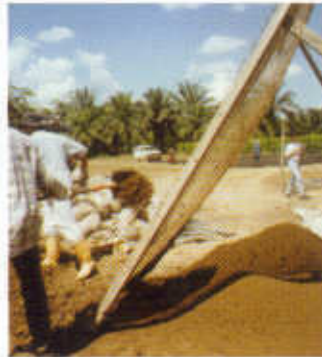
Foto 17. Cernido del suelo para eliminar piedras y raíces.

2.3.6. Las bolsas para las plántulas. Tanto las bolsas grandes como las pequeñas deben tener la costura en la base; esto evita rupturas laterales que afectan el desarrollo de las plántulas y dificultan su manipulación en el vivero. Las características del polietileno para las bolsas son: color negro, calibre 500 (5 micras) y tratado con Dinuvin 622 , sustancia que protege la bolsa del deterioro inducido por la radiación directa del sol y la lluvia.