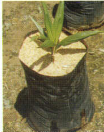
Foto 80. Bolsa con buen drenaje y capa de cascanilla de arroz.