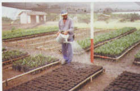
Foto 28. Riego para consolidación del sustrato antes de la siembra.

- Colocar las bolsas llenas en el sitio del vivero, regarlas diariamente hasta la siembra de las semillas o el trasplante de las plántulas y adicionar suelo si es necesario, hasta dejar sólo dos centímetros entre la superficie del suelo y el borde superior de las bolsas. (Foto 28)