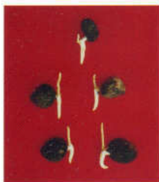
Foto 1. Semillas germinadas con un solo embrión.

La semilla de la palma de aceite tiene aproximadamente dos centímetros de largo con un peso promedio de dos gramos. Está compuesta por un cuesco o endocarpio y una almendra, aunque en algunos casos tiene dos o tres, razón por la cual resultan plántulas mellizas o trillizas. La semilla que compra el productor puede ser precalentada o germinada. (Foto 1, 2, 3 y 4)