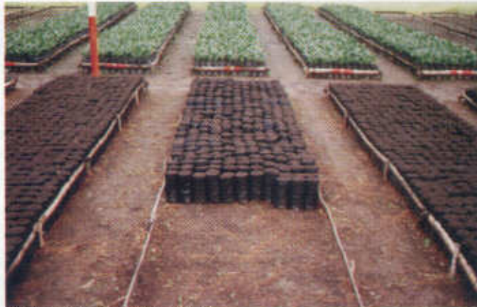
Foto 22. Trazado de camas para previvero.

Vivero de dos fases. Durante los primeros dos a tres meses de edad se utilizan bolsas pequeñas donde se desarrollan las semillas. Antes de acomodarlas, se trazan eras o camas de acuerdo con las dimensiones previstas en el diseño del vivero. Las dimensiones más funcionales son de 1.2 metros de ancho y 10 metros de largo; de esta manera se pueden acomodar aproximadamente 100 bolsas por metro de longitud de la cama, lo que equivale a unas 84 bolsas por metro cuadrado. Para facilitar el tránsito de los obreros y la ejecución cómoda de las labores agronómicas se deja un espacio de 60 a 75 centímetros de ancho entre las camas. (Foto 22)