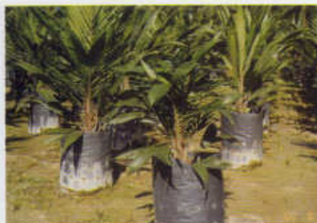
Foto 18. Bolsas grandes con orificios de drenaje funcionales.