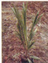
Foto 62. Plántula erecta.