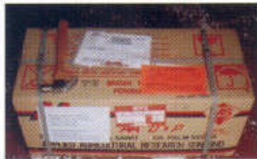
Foto 5. Aspecto exterior de la caja de cartón para transporte de semillas.

1.2.2. ¿Cómo manejar la semilla precalentada?