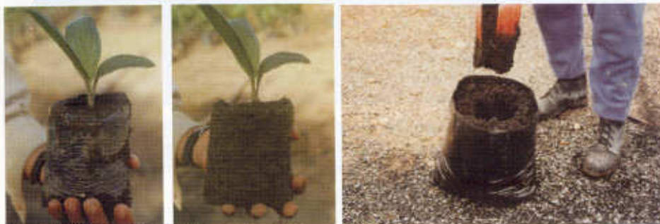
Foto 36, 37 y 38. Transplante de plántulas en bolsas grandes.

- Aplicar un riego abundante inmediatamente después de la siembra.