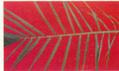
Foto 66. Plántula entrenudos amplios.