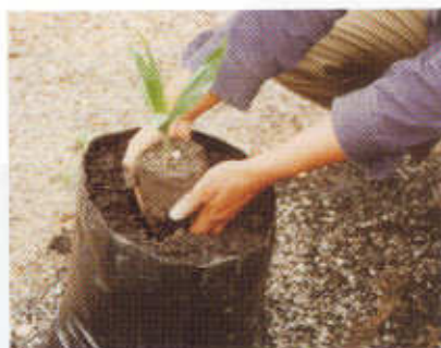
Foto 39. Transplante de plántulas en bolsas grandes.

El ahoyador es una herramienta manual que se compone de un cilindro con el diámetro equivalente al de una bolsa de previvero; tiene una extensión o mango hueco y una platina la cual se desplaza libremente dentro del cilindro al hacer un hueco, cuya utilidad es extraer el suelo que queda dentro del cilindro.