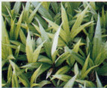
Foto 49. Amarillamiento causado por deficiencia de nitrógeno.

Descripción de la deficiencia: amarillamiento uniforme de toda el área foliar de la planta. (Foto 49).