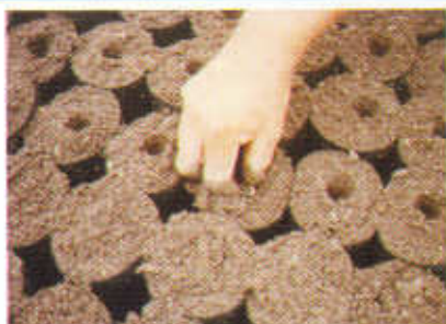
Foto 29. Ahoyado con el dedo para siembra de semillas.

- Abrir los hoyos en el suelo de las bolsas pequeñas con el dedo o con la ayuda de un trozo de madera. El hoyo puede tener de cuatro a cinco centímetros de profundidad y dos a tres centímetros de diámetro. (Fotos 29 y 30)