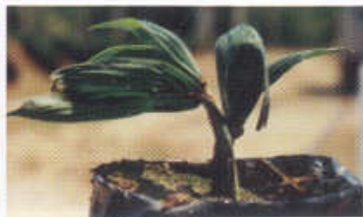
Foto 59. Plántula retorcida.