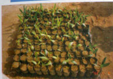
Foto 71. Sección de recuperación en previvero.

- No utilizar secciones de recuperación de plántulas; cuando son anormales lo son para siempre. (Fotos 71 y 72).