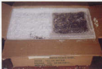
Foto 8. Caja con bolsas de semillas germinadas.

Dentro de la demanda de semilla el comprador debe vigilar que el vendedor de semilla le entregue un 5% adicional a la semilla solicitada, en calidad de reposición por posibles fallas o pérdidas durante el manejo de la semilla.