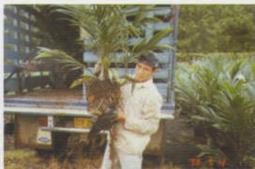
Foto 19. Bolsas de mala calidad.

Revisar la calidad de las bolsas ya que deben permanecer por 10 o más meses en el vivero; (el costo de reemplazar las bolsas dañadas es superior al costo adicional para adquirir las de mejor calidad.) Foto 19