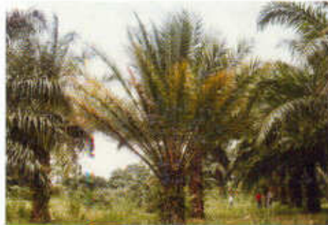
Foto 52. Palma anormal que no fue descartada oportunamente en el vivero.

Bajo condiciones muy especiales y con cultivadores experimentados es normal un descarte del 40% y más, con el propósito de llevar al campo el material de la más alta calidad. El costo adicional de la práctica, se recupera con la productividad y uniformidad del cultivo. (Foto 52).