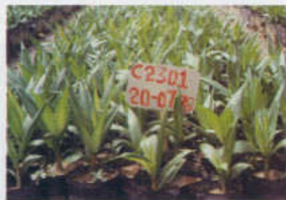
Foto 32. Cama de plántulas debidamente identificada.

- Registrar las pérdidas por descarte para hacer los respectivos pedidos por reposición. Identificar las camas o eras especificando claramente la progenie y fecha de siembra correspondiente. (Foto 32)