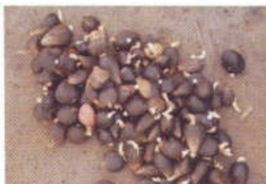
Foto 10. Semillas con embrión partido.