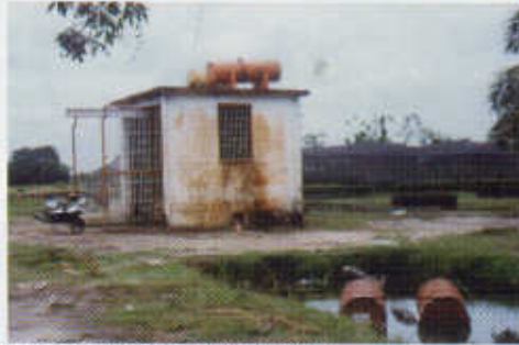
Foto 16. Fuente de agua próxima al vivero.