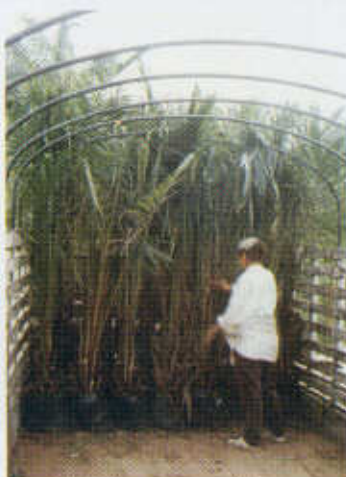
Foto 84. Plántulas mayores de 12 meses y su dificultad en el transporte.