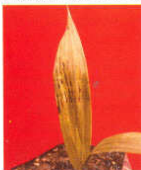
Foto 77. Plántula con Antracnosis.

causa puede ser un riego exagerado, encharcamiento de las camas o la utilización de hojas de palma como sombrero. Como medida de control, se hacen aplicaciones rutinarias de fungicidas a base de Thiabendazol y además se eliminan las hojas o tejido enfermo mediante corte con tijeras. (Foto 77).