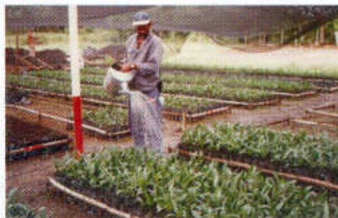
Foto 45. Riego manual con regadera.

3.5.1 Sistema de riego manual. El riego manual es aplicable en viveros pequeños y el sistema más sencillo consiste en un recipiente al que se le acondiciona una sección perforada, con el cual se aplica manualmente el agua a las plantulas. (Foto 45).