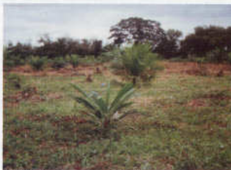
Foto 70. Palma anormal en sitio definitivo.

- Realizar censos palma a palma, cada seis meses hasta cuando el cultivo cumpla dos años de edad esto con el fin de detectar cualquier anomalía o palmas muertas por cualquier causa. (Foto 70).