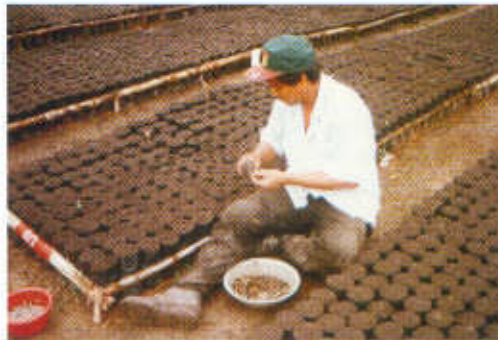
Foto 15. Siembra de semillas en viveros de dos fases.

Este tipo de vivero involucra dos etapas diferentes. La primera consiste en la siembra de semillas germinadas y diferenciadas en bolsas pequeñas, en donde se desarrollan las plántulas hasta cumplir dos a tres meses de edad. La segunda consiste en transplantar las plántulas de esta edad a bolsas grandes, en donde se mantienen hasta justo antes de llevarlas al campo, es decir entre siete y ocho meses más tarde. (Foto 15)