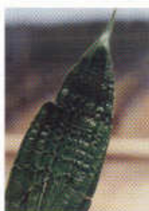
Foto 54. Plántula rizada.