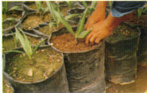
Foto 79. Presencia de algas en la superficie de las bolsas.

Algas: en ocasiones se observa una capa delgada de color verdoso en la superficie del suelo de las bolsas, lo cual es característico de cierto tipo de algas. Esta situación está asociada con la presencia de una capa superficial del suelo endurecida, que limita la infiltración del agua, ocasionada normalmente por lluvias frecuentes o como efecto del riego por aspersión con tamaño de gota muy grande. Este problema se evita utilizando el mulch o el riego con gota fina. Cuando el número de bolsas con este problema es alto, se hace necesario remover manualmente la capa endurecida para permitir la infiltración del agua en el suelo de la bolsa. (Foto 79).