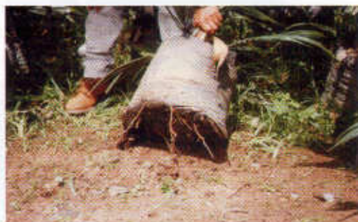
Foto 82. Corte de raíces que traspasan la bolsa.

- Tres o cuatro semanas antes de la siembra, girar las bolsas sobre su mismo eje unos 180° para separar todas las raíces que hayan pasado de la bolsa al subsuelo del vivero; si es necesario se recomienda usar un machete o cuchillo para cortar dichas raíces. (Foto 82).