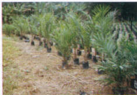
Foto 72. Sección de recuperación en vivero principal.

- El mejor consejo que puede darse a un viverista cuando ejecuta la selección es: "si duda, elimínala".