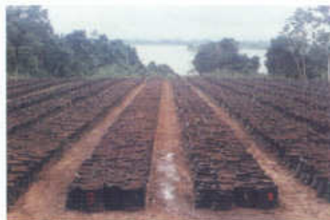
Foto 24. Bolsas grandes en viveros de una fase.

Vivero de una fase. Las semillas se desarrollan durante los primeros tres meses en bolsas grandes y también se acomodan en camas o eras cuyas dimensiones y espacio de separación son similares a las usadas con bolsas pequeñas; sin embargo, en cada cama se colocan hileras de cuatro bolsas para un número aproximado de 16 bolsas por metro cuadrado. (Foto 24).