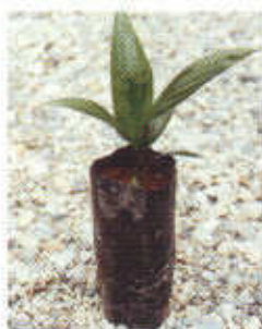
Foto 53. Plántula normal.

En el transplante se siembran solamente las plántulas normales, mientras que las anormales, se descartan y se eliminan definitivamente del vivero. (Fotos 53, 54, 55, 56, 57, 58, 59 y 60).