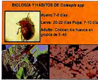
Figura 9. Ciclo de vida de la morrocoyita.

Es considerada la principal plaga de los frutos de plátano, en zonas dedicadas a la exportación o a mercados especializados.