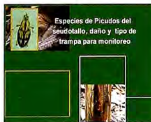
Figura 4. Trampas para control y monitoreo de picudos

Una vez extraída la semilla tipo tradicional, elimine todas las raíces y la tierra adherida, procurando no dañar las yemas, corte elseudotallo diez centímetros por encima del cuello del cormo. Retire la semilla del sitio de extracción el mismo día de su cosecha y en lo posible siémbrela ese día. Luego de cosechada compruebe su sanidad y trátela con una solución de Creolina a la dosis 5 cc/ litro de agua cada 24 horas.