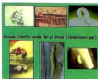
Figura 7. Ciclo de vida del gusano cabrito.

La pupa es café claro, con dos puntos dorados en cada lado y se encuentra suspendida en el envés de las hojas y en el seudotallo, durante 12 a 15 días.