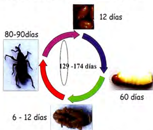
Figura 1. Ciclo biológico del picudo negro

Biología y Hábitos. Los adultos, son cucarrones que miden entre 1.5 y 2.0 cm de longitud. La cabeza presenta un pico largo y curvo con dos antenas. La coloración varía de rojizo en sus primeras etapas, a negro cuando ya está desarrollado. La población del insecto está relacionada con varios factores, entre los que se destaca el sistema de producción, el grado de tecnología, la ubicación de las fincas y las cultivariedades en los diferentes pisos térmicos, la presencia de controladores biológicos como insectos depredadores, parásitos y entomopatógenos que estarían regulando dicha población.