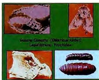
Figura 8. Gusano canasta.

Esta plaga así como otros insectos comedores de hojas, como el Gusano Monturita ( Sibine sp.), el Gusano Peludo ( Antichloris sp.) y el Gusano Araña ( Phobetrion sp.), se presentan ocasionalmente en bajas poblaciones y preferiblemente más en plátano que en banano. Todas estas plagas poseen un buen control biológico. Su manejo se fundamenta en mantener la frecuencia de los deshojes.