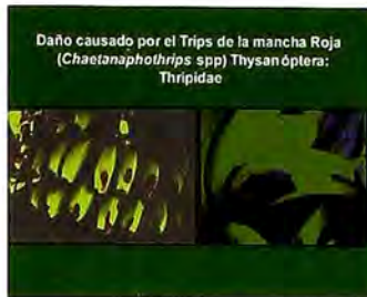
Figura 11. Daño ocasionado por trips.

El daño del insecto se presenta en frutos jóvenes (dos semanas), cuando sale la inflorescencia y antes del embolso del racimo. Forman pequeñas protuberancias circulares en cualquier parte del fruto afectando sustancialmente la calidad para mercados especializados y puede ser un agente indirecto del amarilleamiento prematuro del fruto.