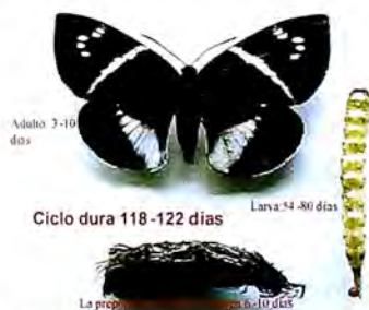
Figura 6. Ciclo de vida del gusano tornillo.

Biología y Hábitos. Esta plaga es bastante limitante en zonas cálidas y húmedas generalmente hasta los 1.000 m.s.n.m. Los adultos son mariposas diurnas, que vuelan en las mañanas en grupos pequeños a una altura de un metro sobre el suelo. Sus alas anteriores son de color café oscuro con una banda blanca que las atraviesa diagonalmente y cinco manchas pequeñas en un solo grupo, hacia el extremo del ala. Las alas posteriores son de color café con un triángulo blanco en la parte posterior: