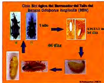
Figura 5. Ciclo de vida del barrenador del banano.

El periodo de preoviposición es de 15-30 días y los barrenadores adultos se aparean tanto de día como de noche. Una hembra pone un promedio de nueve huevos (Un huevo por día), coloca los huevos insertando el ovipositor a través de heridas hechas con el rostro en la epidermis de las vainas exteriores de las hojas hacia las cámaras aeríferas. La cantidad de huevos se reduce considerablemente al aumentar el número de barrenadores, lo que indica la existencia de una feromona espaciadora, compuesto que actúa como un impedimento para las hembras de la misma especie. (Ranjith y Lalitha 2001).