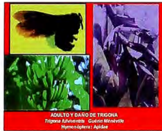
Figura 10. Daño en fruto de la Trigona sp.

Biología y Hábitos. El adulto es una pequeña abeja negra, de alas café oscuro y cuerpo densamente cubierto de vellos cortos y finos. Tiene hábitos gregarios y se presenta en focos con mayor frecuencia en plantaciones establecidas cerca a zonas boscosas. El daño lo hace el adulto al realizar roeduras circulares en las aristas de los dedos jóvenes; el látex que brota de la herida mancha la fruta al secarse, demeritando su calidad (FOTO).