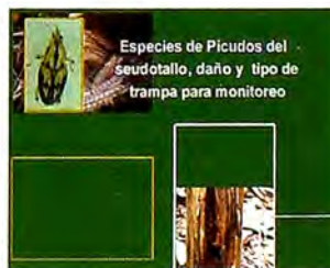
Figura 3. Picudo amarillo.

Existen dos especies de Picudo Amarillo que son el Metamasius hemipterus conocido como el Picudo Rayado de la caña de azúcar y el Picudo Amarillo Metamasius hebetatus . Por lo general, estas plagas son secundarias, cuya presencia en el cultivo de plátano está relacionada con plantaciones en mal estado, con desbalances o deficiencias nutricionales, especialmente de Potasio y Boro. También, en plantaciones donde no se realiza el destronque inmediato y no se pican los residuos al momento de la cosecha. El M. hemipterus se encuentra distribuido en todas las zonas productoras de plátano del país y en algunas áreas es de mayor importancia económica, porque ayuda a diseminar la Bacteriosis causada por Erwinia chrysantemi p.v. paradisíaca . El M. hebetatus se reportó inicialmente en el departamento de Nariño y ya se encuentra en la Zona Cafetera. En ambas especies, el daño es causado principalmente por las larvas que consumen el seudotallo, lo debilitan y ocasionan el doblamiento de las plantas al momento de llenado del racimo. Ambos atacan el seudotallo, el Picudo Amarillo desde la base hasta el tercio superior y el rayado por encima de un metro de altura. El daño se inicia en las calcetas externas hacia adentro, haciendo que las hojas más externas de la planta se vuelvan amarillas y mueran.