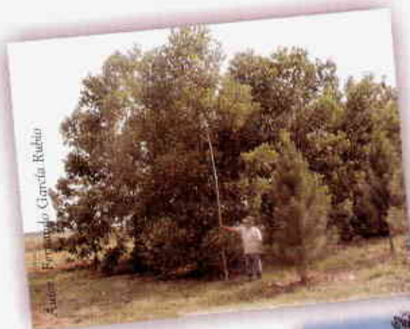
Acacia (Acacia mangium)