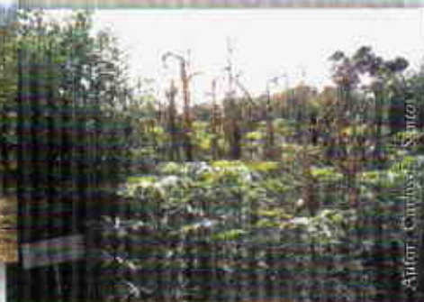
Cultivo en callejones guandul-yuca-maíz