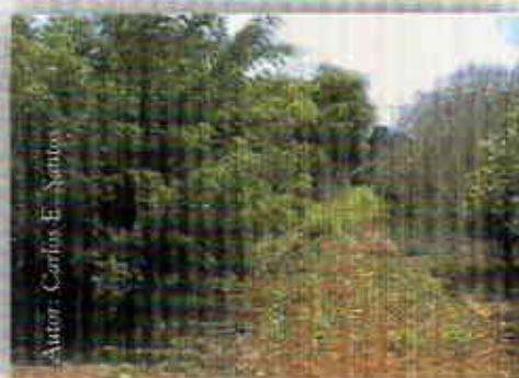
Cultivo en callejones matarratón-soya