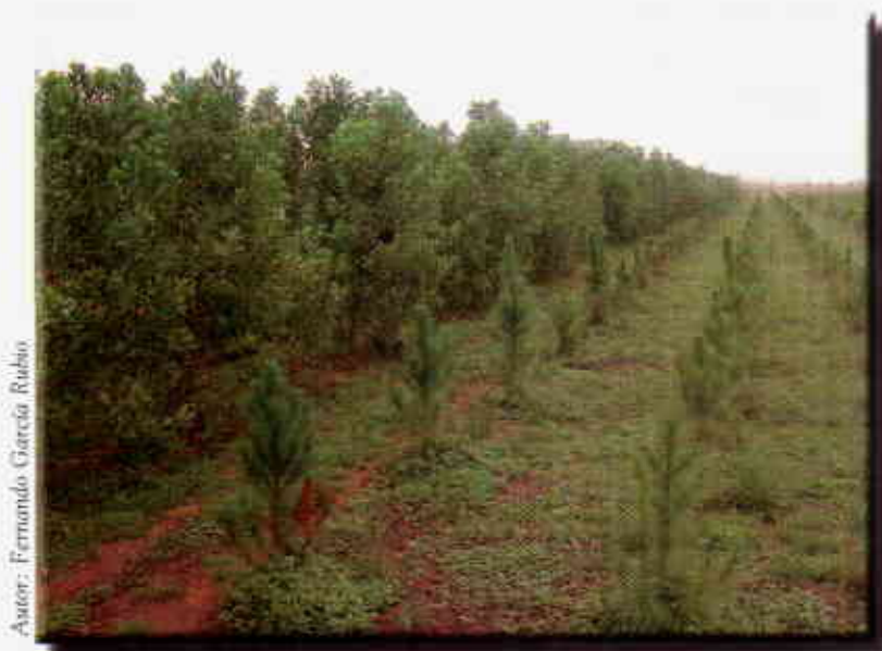
Autor: Fernando García Rubio

Árboles como cerca viva o barreras rompe vientos.