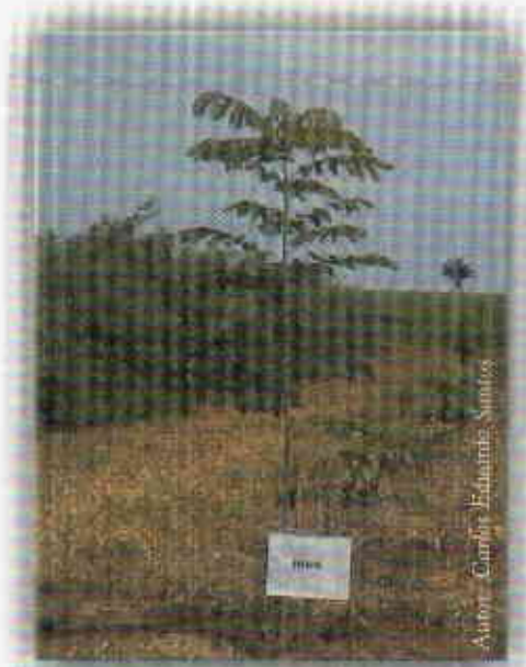
Igua ( Pseudosamanea guachapete )