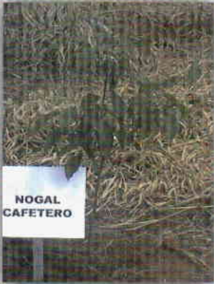
Nogal ( Cordia alliodora )