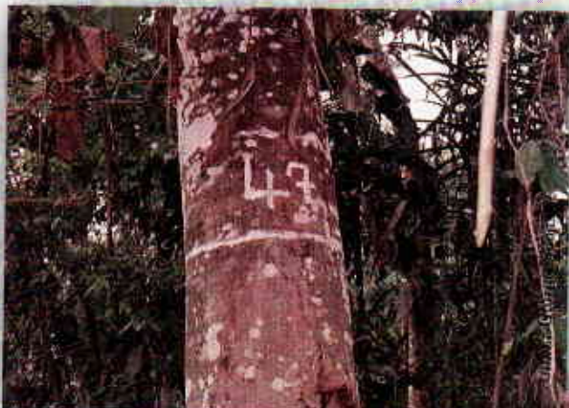
Fustales: árboles con más de 10 cm de diámetro a la altura del pecho DAP