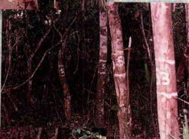
Latizales: vegetación con más de 30 cm de altura y un DAP menor de 10 cm