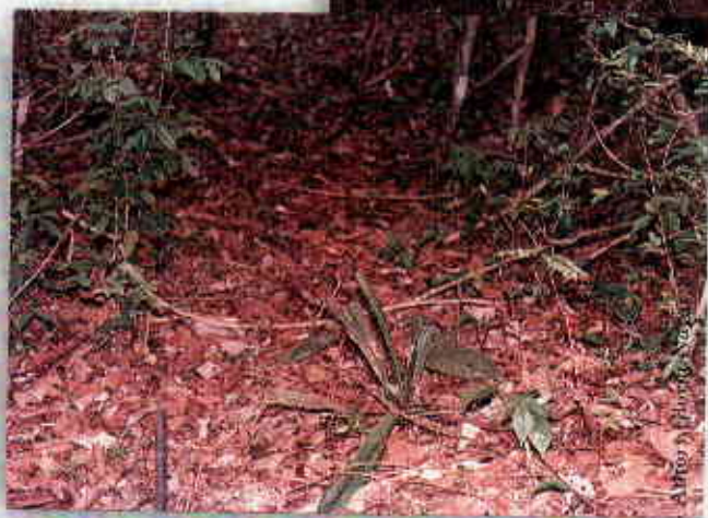
Brinzales: vegetación con una altura hasta 20 cm