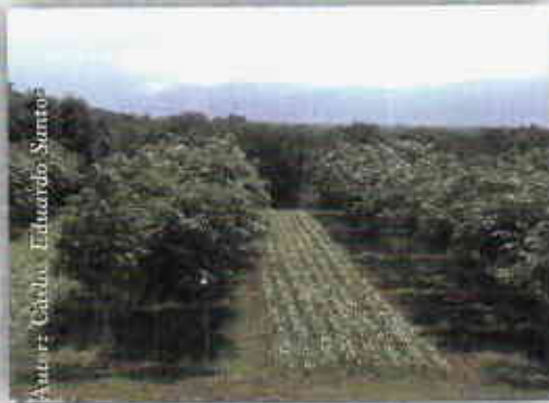
Sistema silvoagrícola plátano con Eucalipto pellita