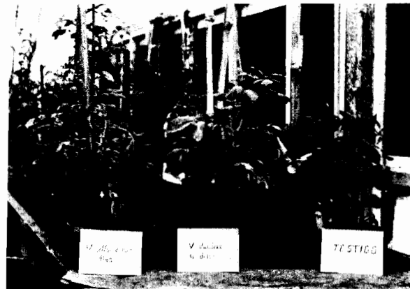
FIGURA 6. Intensidad de daño en papa producido por V. albo-atrum y V. dahliae , con relación a una planta no inoculada (testigo).