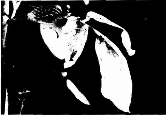
FIGURA 3. Hoja de papa con síntoma de amarillamiento y flaccidez de folíolos producidos por el hongo Verticillium sp.

Bajo condiciones frías y húmedas no hay signos de marchitez, sólo se presenta un amarillamiento progresivo de las hojas de abajo hacia arriba. En caso de usar semilla infectada, las plantas a menudo permanecen enanas con la mayor parte de las hojas enrolladas hacia arriba hasta que todo el follaje se seca, síntomas que en el campo se pueden confundir con los producidos por Fusarium , Rhizoctonia , Erwinia o daño mecánico.