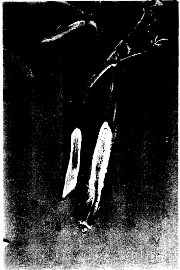
FIGURA 4. Tallos de papa que muestran tejido vascular (xilema) afectado como producto de infección con Verticillium sp.

Si la planta sobrevive hasta la floración, el hongo pasa al estolón y de éste a los tubérculos en formación; al cosecharlos, muestran varios grados de decoloración en el anillo vascular especialmente en el sitio de unión del estolón al tubérculo, pero esta decoloración no necesariamente es causada por Verticillium porque varios patógenos, entre ellos Fusarium spp. , pueden producir los mismos síntomas. Por el contrario, la ausencia de decoloración no garantiza que esté libre de Verticillium . Varios intentos por cuantificar porcentajes de contaminación de la semilla mediante aislamiento del anillo vascular afectado, prueban que no es posible determinar la presencia de Verticillium en tubérculos por el color y grado de infección vascular. El número de tubérculos de las variedades de papa comerciales en el país del cual se ha aislado Fusarium spp. es superior al 50% y las especies de este hongo ya sean saprofitas o patógenas que son de desarrollo rápido,