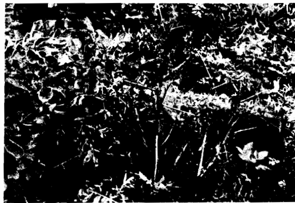
FIGURA 2. Planta de papa que maduró prematuramente a causa de Verticillium sp.

En condiciones de Cundinamarca y durante períodos normales de siembra (Febrero-Marzo), los primeros síntomas se presentan después de la floración y durante los días más calientes de Junio. En algunos semestres, los síntomas comienzan por una ligera flaccidez o caída de las puntas de los folíolos de las hojas bajas. A medida que avanza la enfermedad, la marchitez se hace más pronunciada, aparecen partes de los folíolos amarillos en forma irregular; más tarde se secan y mueren o cubren toda la hoja y asciende hasta la parte superior de la planta. Eventualmente, la enfermedad se pronuncia más en un lado de la hoja que en el opuesto o más en un lado del folíolo que en el otro (Figura 3). Las hojas mueren de la base hacia arriba, se secan y se arrugan contra el tallo. Un racimo de hojas puede sobrevivir en la punta de los tallos pero algunas veces la planta se marchita y muere prematuramente.