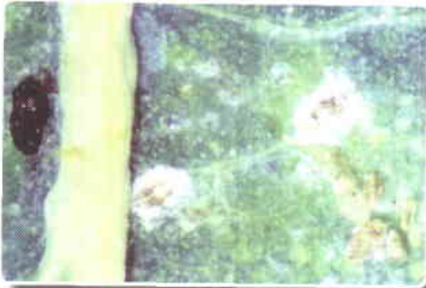
Figura 2. Pupas de A. socialis .