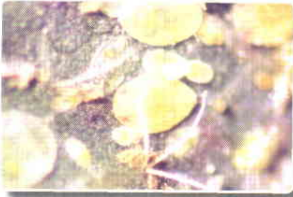
Figura 3. Ninfas y pupas de B. tabaci .

de ninfa sin volverse a desplazar. Los diferentes instares se diferencian principalmente por cambios en el tamaño y la acumulación de sustancias cerosas sobre su cuerpo. Una vez terminado el estado de ninfa, que bajo las condiciones mencionadas, dura de 15 a 17 días, emerge el adulto por una abertura dorsal en forma de "T" invertida.