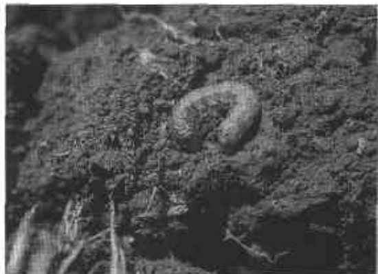
FIGURA 3. Larvas de trozador Agrotis ipsilon .