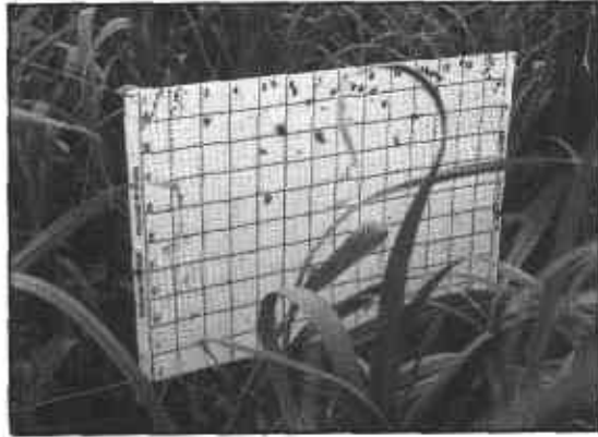
FIGURA 13. Trampas para la captura y monitoreo de poblaciones de trips en ajo.

— Adulto: (Figura 14). Son mosquitos pequeños de color gris oscuro con manchas amarillas en la cabeza y el tórax, viven aproximadamente un mes y ponen cientos de huevos durante ese tiempo. La hembra produce pinchaduras en las hojas para alimentarse y para ovipositar. Generalmente prefieren para alimentarse, plantas diferentes a la cebolla como leguminosas, sojanaceas o malezas de