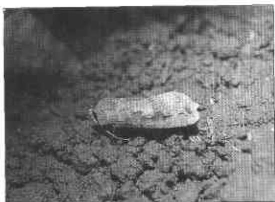
FIGURA 5. Adulto de trozador Agrotis ipsilon .