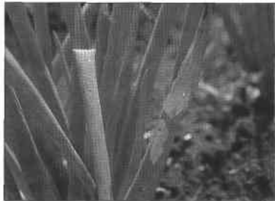
FIGURA 2. Daño de trozador en cebolla.

A los trozadores también se les conoce como rosquillas por su hábito de enroscarse cuando son perturbados; viven en el suelo a profundidades de 1 a 2 cm bajo los terrones y salen a alimentarse causando daño, durante la noche; generalmente atacan en focos o parches y se presentan en poblaciones abundantes durante períodos secos. La larva