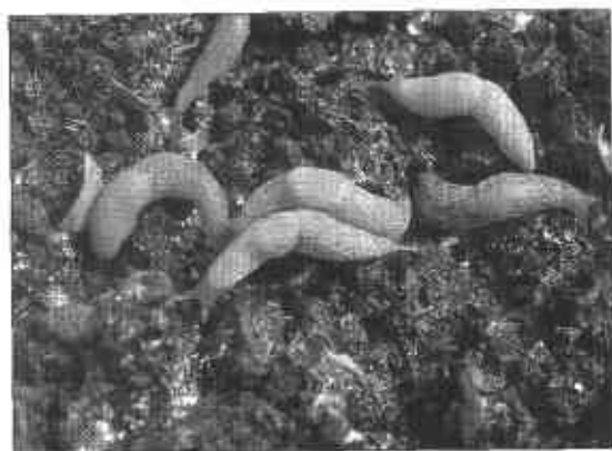
FIGURA 6. Babosas Limax spp causan daño en hojas y bulbos de la cebolla.