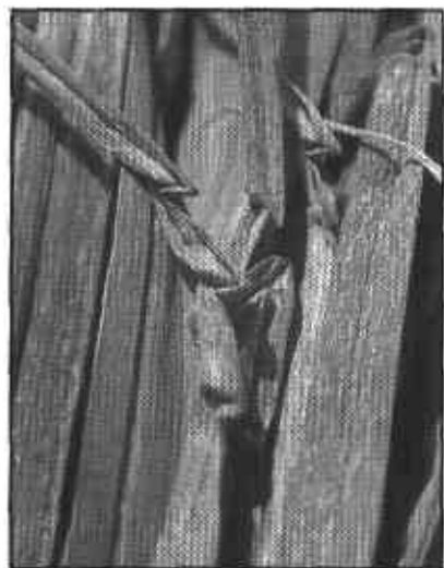
FIGURA 12. Daño de trips en ajo. Manchas cloróticas y deformación de hojas.

— Huevos: Los huevos de esta especie son muy pequeños, blancos y alargados. Son introducidos con el ovipositor individualmente bajo la epidermis de las hojas; el período de incubación tiene una duración de dos a cuatro días después de los cuales emerge una larva diminuta que empieza a construir una mina muy delgada.