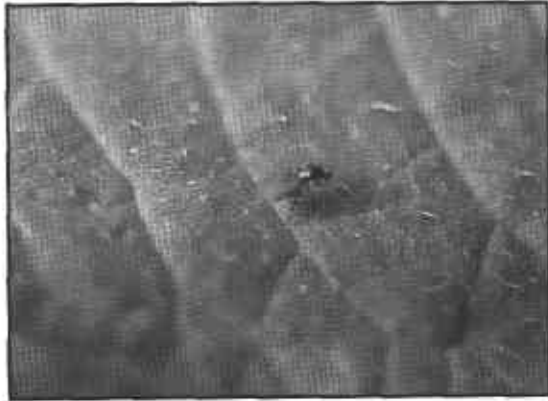
FIGURA 14. Adulto del minador de la cebolla Liriomyza huidrobrensis .

hoja ancha que se encuentren en los alrededores del cultivo.