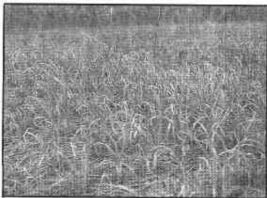
FIGURA 15. Daño de minador de la cebolla Liriomyza huidrobrensis .

entre las hortalizas: remolacha, apio, habichuela, frijoles, acelga, papa, uchuva y ornamentales como pompón, margaritas y gypsophila (Sanabria, 1994).