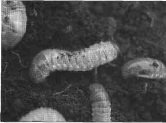
FIGURA 1. Larvas de chisa.

completamente desarrollada puede alcanzar longitudes superiores a 45 mm (Figura 3); empupan en cámaras elaboradas en el suelo a profundidades de 20 o más mm (Figura 4). Los adultos son "polillas" de colores gris o marrón oscuro con una envergadura de 45 a 50 mm, hábitos nocturnos; durante el día se refugian en el suelo donde se mimetizan gracias al color de sus alas anteriores (Figura 5).