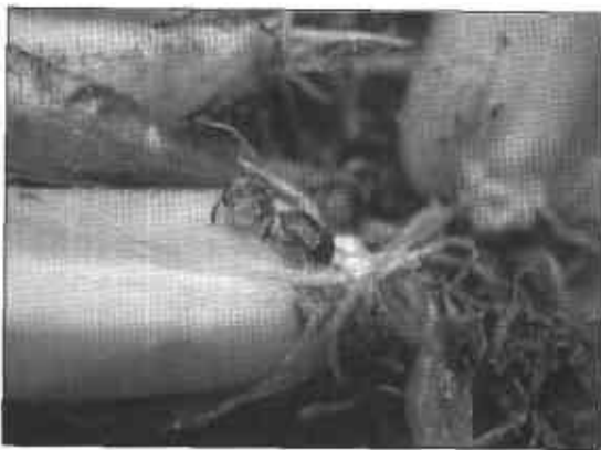
FIGURA 9. Adultos de la chinche subterránea Cyrtomenus bergi .

las zonas productoras del país, tanto en cebolla de bulbo como de rama.