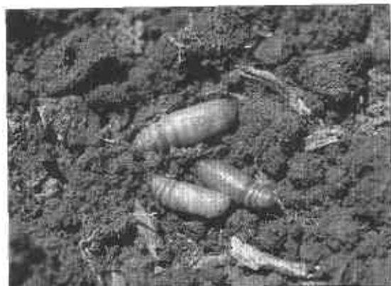
FIGURA 4. Pupas de trozador.