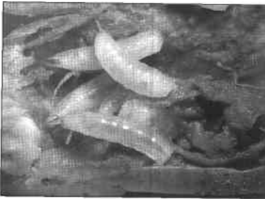
FIGURA 8. Larvas de la mosca de la raíz Delia antiqua