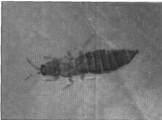
FIGURA 11. Adultos de trips Frankliniella occidentalis .

— Adulto: (Figura 11). Miden cerca de un milímetro de largo, su color es café a gris amarillento, las