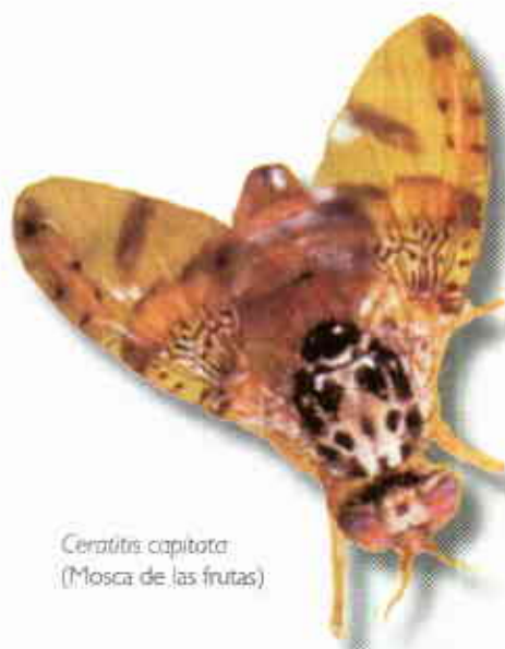
Ceratitis capitata (Mosca de las frutas)

A pesar del alto potencial que la papaya tiene para ser explotada en Colombia, su producción y comercialización se ve limitada por la presencia de diferentes problemas fitosanitarios. Las moscas de las frutas y en especial Toxotrypana curvicauda , conocida como la mosca de la papaya es considerada como la de mayor importancia económica por los daños que ocasiona desde la fecundación hasta la maduración de los frutos. Las pérdidas pueden alcanzar hasta el 100 % y están representadas por el daño directo de las larvas, las cuales se alimentan de las semillas y ocasionan la caída y maduración prematura de los frutos. Como apoyo a los programas de manejo integrado de plagas, el presente trabajo tuvo como objetivo evaluar atrayentes y trampas efectivos, económicos y de fácil consecución para detectar y monitorear las especies de moscas de las frutas presentes en cultivos de papaya y otros frutales.