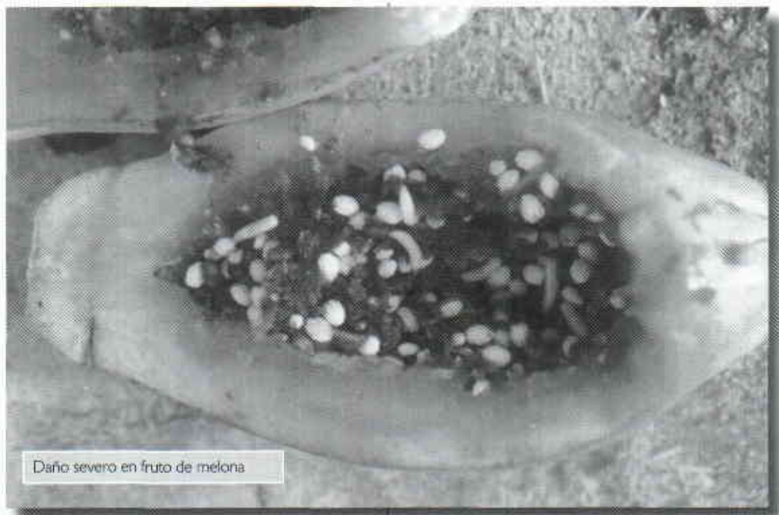
Daño severo en fruto de melón

proteína hidrolizada, mientras que para la detección de Ceratitis y Bactrocera se utilizan trampas de cartón tipo Jackson, cebadas respectivamente con las paraferomonas trimedlure y metil eugenol (Gómez et al 1996). T. curvicauda prefiere los azúcares y no es atraída por proteínas ni otros estimulantes empleados para los otros Tephritidae (Sharp & Landolt 1984). En Venezuela las mayores capturas se obtuvieron con jugos de caña de azúcar y de piña en diferentes concentraciones (Boscán & Godoy 1998) y en Panamá con raspadura de panela del 2.5 al 10 % (Campo et al 2002). El jugo de piña es considerado, además, como el mejor atrayente (E. Molina 2001, comunicación personal) para moscas del género Dasiops (familia, Lonchaeidae).