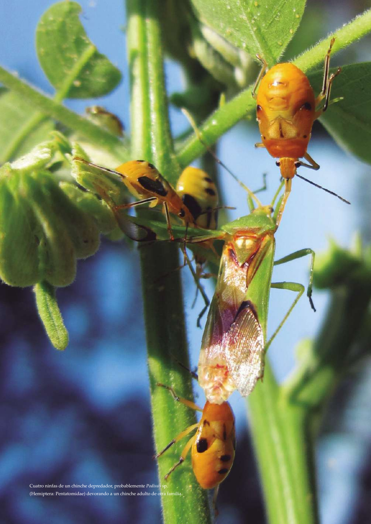
Cuatro ninfas de un chinche depredador, probablemente Podisus sp. (Hemiptera: Pentatomidae) devorando a un chinche adulto de otra familia.