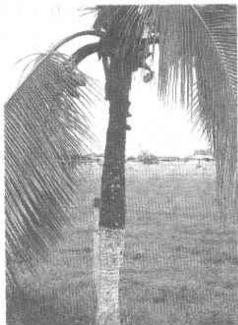
FOTO 7. Como consecuencia de la “porroca u hoja pequeña”, el tronco reduce su diámetro y luego más arriba recobra su tamaño normal.