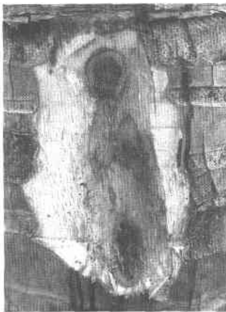
FOTO 5. Como su nombre lo indica, la “gomosis” se caracteriza por producir goma en las heridas del tronco.

de agua se agrega, previa mezcla: 2.5 gramos de benomyl, 2.5 cc. de aceite vegetal y 5 cc de oxamil aplicados a la corona, especialmente a las inflorescencias y bases de ésta.