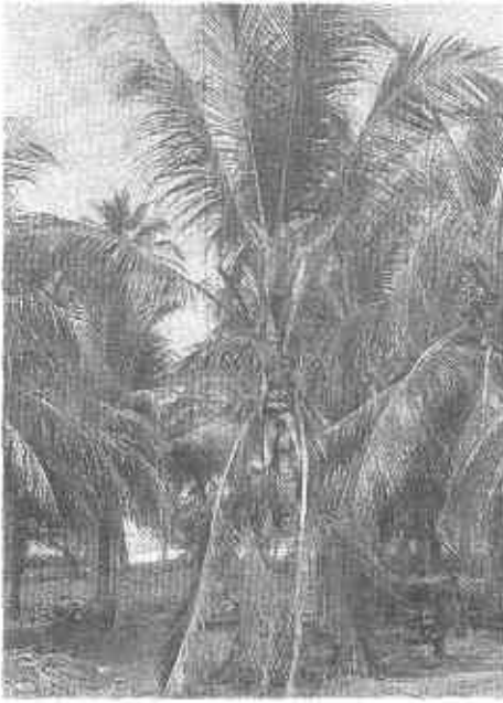
FOTO 6. Un síntoma externo del anillo rojo es lo que se denomina "ruana", que son las hojas superiores dobladas y colgando sin desprenderse del tallo.

cilindro hueco, cerrado en la base y abierto en la parte superior; el tejido coloreado se extiende en los pecíolos de la hoja hasta una distancia de 75 cm.