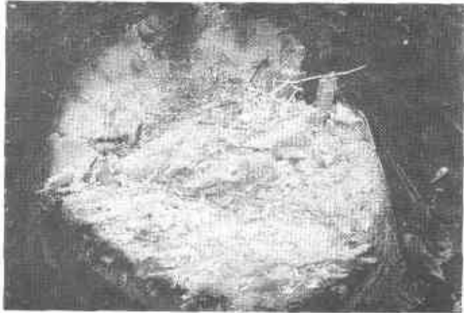
FOTO 12. Estados iniciales de necrosamiento de haces vasculares, ocasionado por el hongo Ceratocystis sp., en palma de cera.