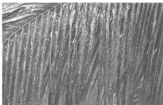
FOTO 9. Añublo o quemazón de las hojas.