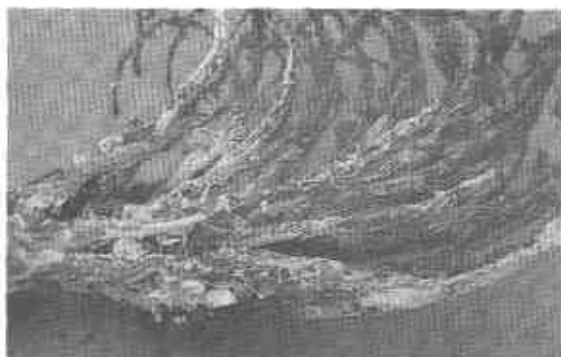
FOTO 10. Pudrición de las inflorescencias.

El control consiste en la poda, retiro o eliminación de todas las estructuras afectadas y aplicación a la corona de productos al igual que para el Ceratocystis sp.