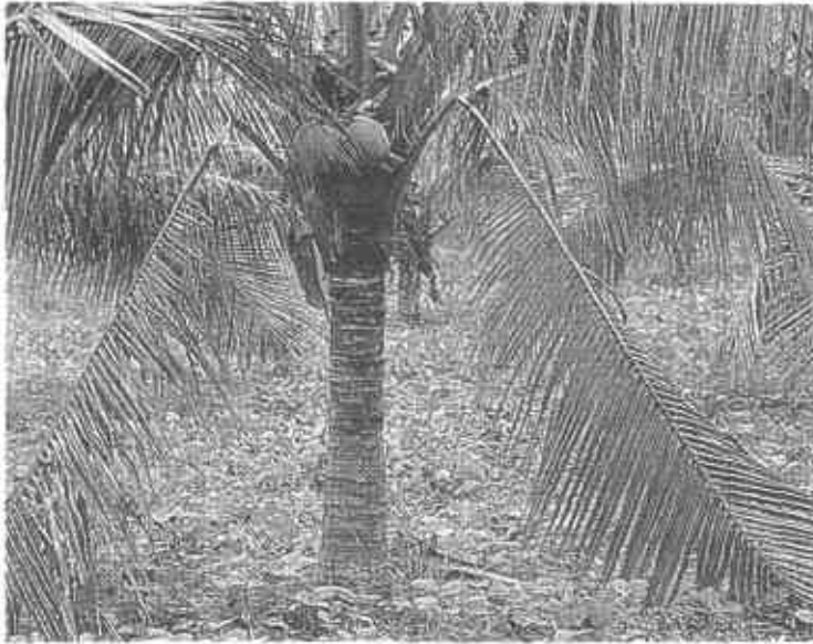
FOTO 8. Hoja quebrada. Esta enfermedad se caracteriza por atacar los peciolo y la nervadura central de las hojas, apareciendo manchas alargadas de color café rojizo y doblamiento de las mismas.

todo este material inerte, incluyendo hojas secas caídas o pendientes de la palma, frutos caídos o residuos de éstos y quemarlos.