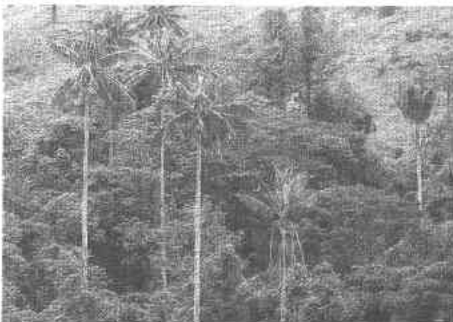
FOTO 13. Síntomas secundarios del ataque del complejo insecto-hongo en palma de cera del Quindío.