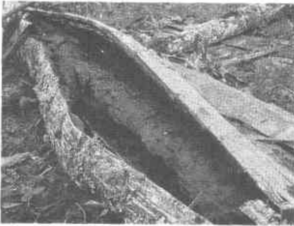
FOTO 11. Estado final del ataque del asocio hongo curculionidae en el corazón de la palma de cera.