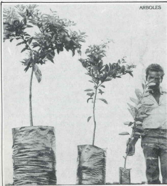
6-AGRICULTURA DE LAS AMERICAS

Como se ha demostrado en este Seminario, hay avances muy importantes en los distintos países de Latinoamérica y el Caribe en materia de políticas, de tecnología y de de-