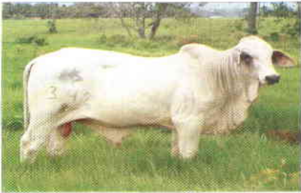
Figura 3. La identificación de los animales es el primer paso para establecer los registros técnicos y económicos.

En el sistema de información la herramienta fundamental son los registros, en cuyos formatos se consignan las características y los acontecimientos de la empresa; la estructura básica de los registros involucra fechas, pesos y precios, y se asocian con la descripción detallada de la actividad. Esta información proporciona un completo conocimiento del material con el cual se está trabajando. La obtención de esta información debe ser sistemática, metódica y sobretodo constante, para obtener de ella un correcto análisis.