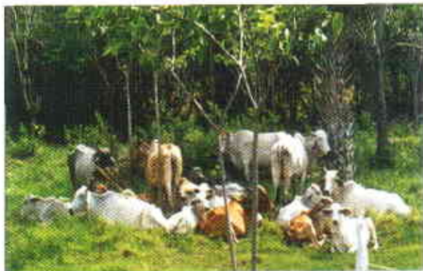
Figura 1. La gestión ambiental pretende el uso racional de los recursos naturales en el trópico

En los sistemas de producción orientados por la calidad de los procesos, la gestión ambiental es un aspecto de mucha relevancia ya que su consideración estratégica conduce al posicionamiento en mercados especializados.