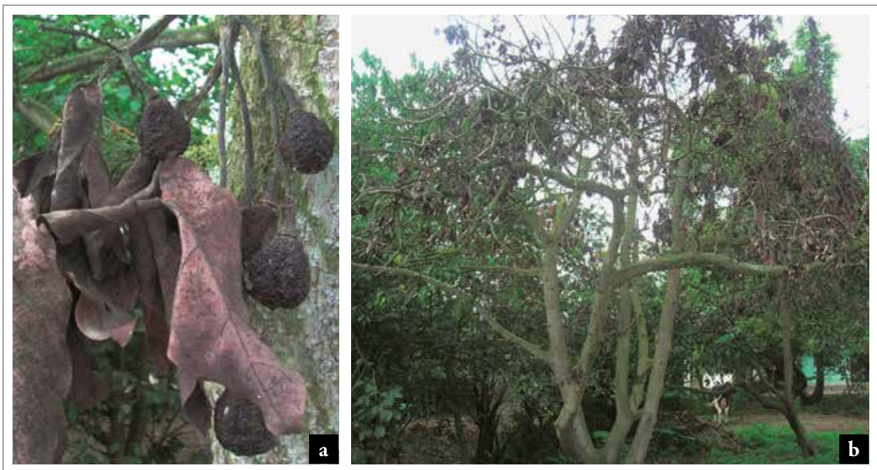
Figura 1. Árboles de aguacate con sintomatología asociada a pudrición radicular (Puéllaro, Pichincha). a. Momificación de frutos y secamiento de hojas; b. Marchitez general del árbol y caída de hojas.

La toma de muestras se realizó en fincas y huertos de pequeños productores en las provincias de Tungurahua y Pichincha, tomando raíces de árboles (a una profundidad de 20 cm) que presentaban la sintomatología asociada a la pudrición radicular: secamiento de ramas y de hojas, momificación de frutos y caída de hojas, tal como se indica en la figura 1.