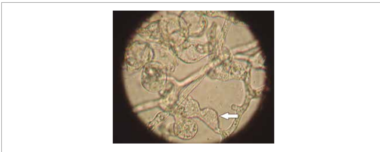
Figura 2. Fotografía del aislamiento PC38. Nótese la presencia de hinchazones hifales (flecha) con formación de clamidosporas características del género Phytophthora sp.

La sintomatología de estos patógenos puede ser similar a la causada por P. cinnamomi , con características de marchitez generalizada, estancamiento en el desarrollo del árbol, pérdida de vigor, color y brillo, y amarillamiento de hojas (Ramírez et al. 2013). Phytophthora sp. está asociado con esta enfermedad, debido a que el patógeno ataca tejido vivo y es un invasor primario, por lo tanto, no invade tejido ya invadido por otros microorganismos (Drenth y Sendall 2001). Sin embargo, no se descarta la posibilidad de que la enfermedad esté relacionada con un complejo de microorganismos que causen la pudrición radicular en aguacate.