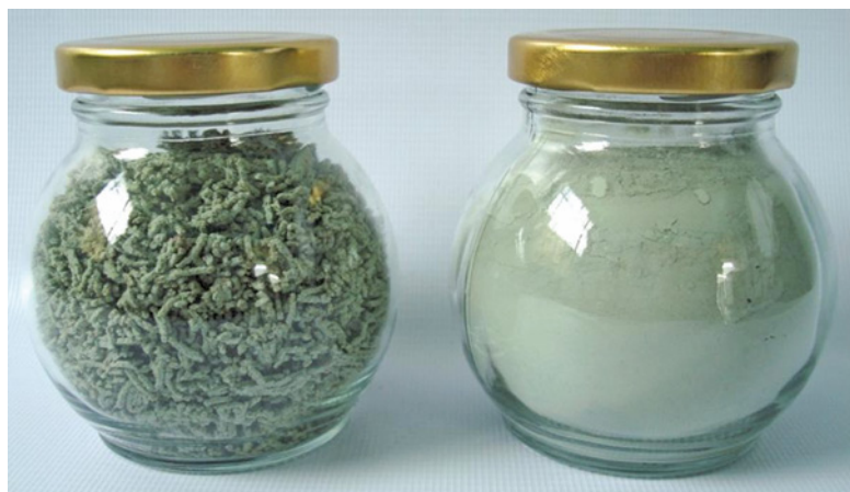
Figura 5. Bioplaguicidas a base de Trichoderma koningiopsis Th003 formulados como granulado dispersable (WG) y polvo mojable (WP).

campo. Esta formulación incorporó varias fuentes nutricionales para favorecer la colonización del suelo por parte de T. koningiopsis y de esta forma darle una ventaja competitiva con respecto a los demás habitantes naturales del suelo. El polvo mojable consistió en una formulación diseñada principalmente para la aplicación foliar, donde la condición más limitante para la eficiencia del agente de biocontrol es el efecto de la radiación ultravioleta del sol; por tal razón, este prototipo incluyó en su composición protectores solares y otros auxiliares de formulación, como protectores de secado, adherentes y diluentes.