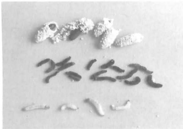
Mosca blanca de los invernaderos infectada con el bioplaguicida a base de Verticillium lecanii

Debido a la magnitud de las pérdidas ocasionadas por las moscas blancas y a la dificultad para controlarlas mediante métodos químicos, ya que además se han vuelto resistentes a muchos de estos compuestos, se han hecho esfuerzos en la búsqueda de alternativas para su manejo. En este sentido, Corpoica desarrolló un bioplaguicida a base del hongo entomopatógeno Verticillium lecanii , en forma de polvo mojable, cuya tecnología de formulación asegura su resistencia a condiciones ambientales adversas y su efectividad controladora demostró ser superior a la del producto comercial existente a base de este mismo hongo. Dicho producto ha sido evaluado en parcelas experimentales en fincas de agricultores con significativos niveles de control de la plaga, alcanzándose niveles de infección del insecto plaga