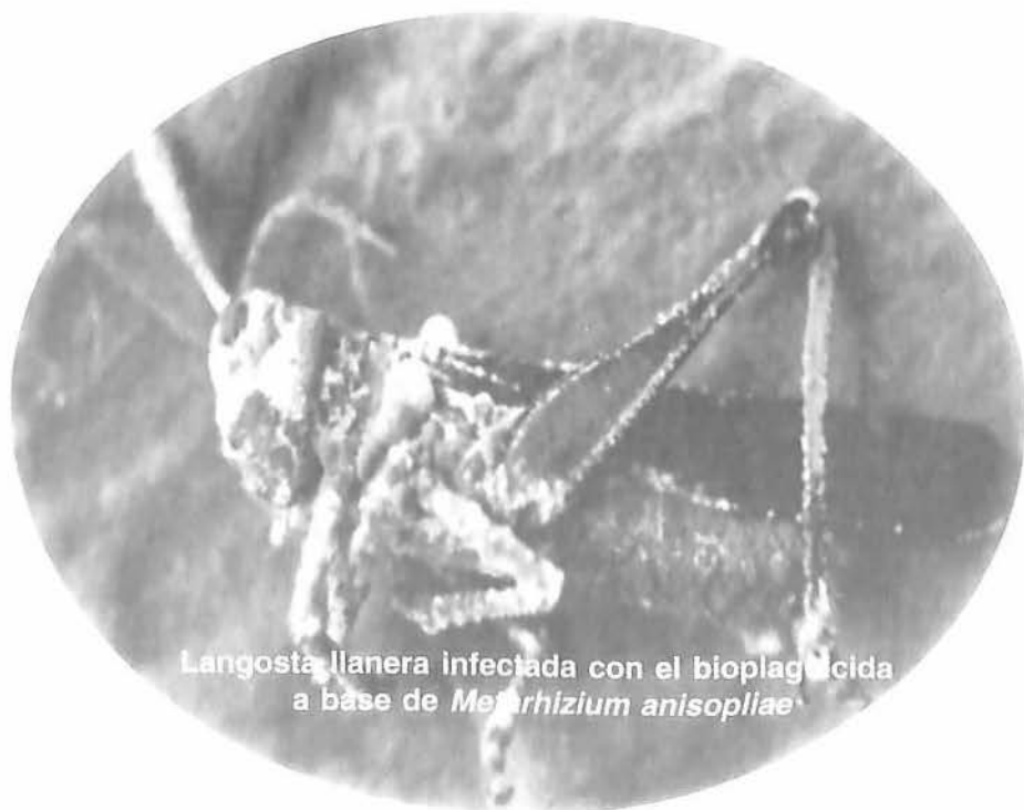
Langosta llanera infectada con el bioplaguicida a base de Metarrhizium anisopliae

1 Laura Villamizar Rivero 2 Carlos Espinel Correa 3 Alba Marina Cotes Prado