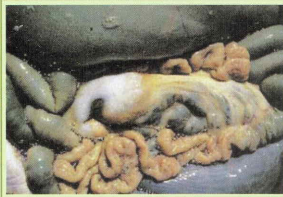
Paratuberculosis serosa intestinal edematosa y ganglios ileocecales tumefactos.

También llamada Enfermedad de Johne. Es producida por la bacteria Mycobacterium avium , subespecie paratuberculosis, y afecta principalmente a bovinos, ovinos y caprinos.