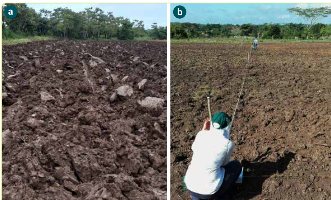
Figura 1. Estado de preparación de suelo. a. Suelo mal preparado, con terrones que obstaculizan la siembra y la brotación adecuada; b. Suelo suelto que garantiza condiciones para un buen prendimiento de la semilla.