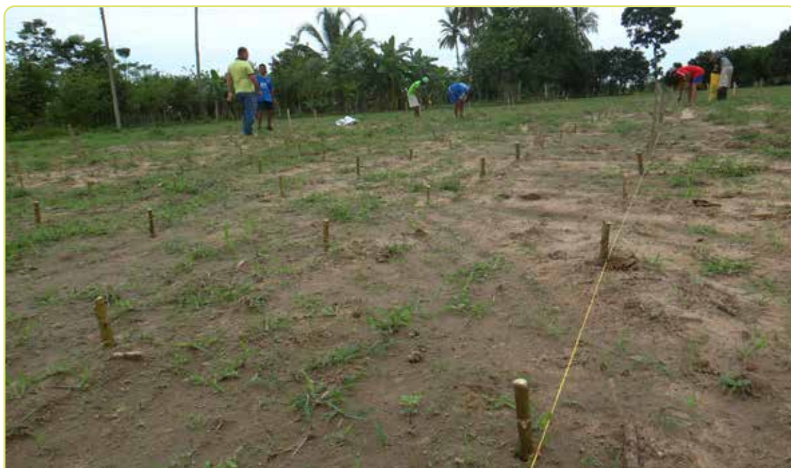
Figura 6. Siembra manual de estacas de yuca en suelo plano.