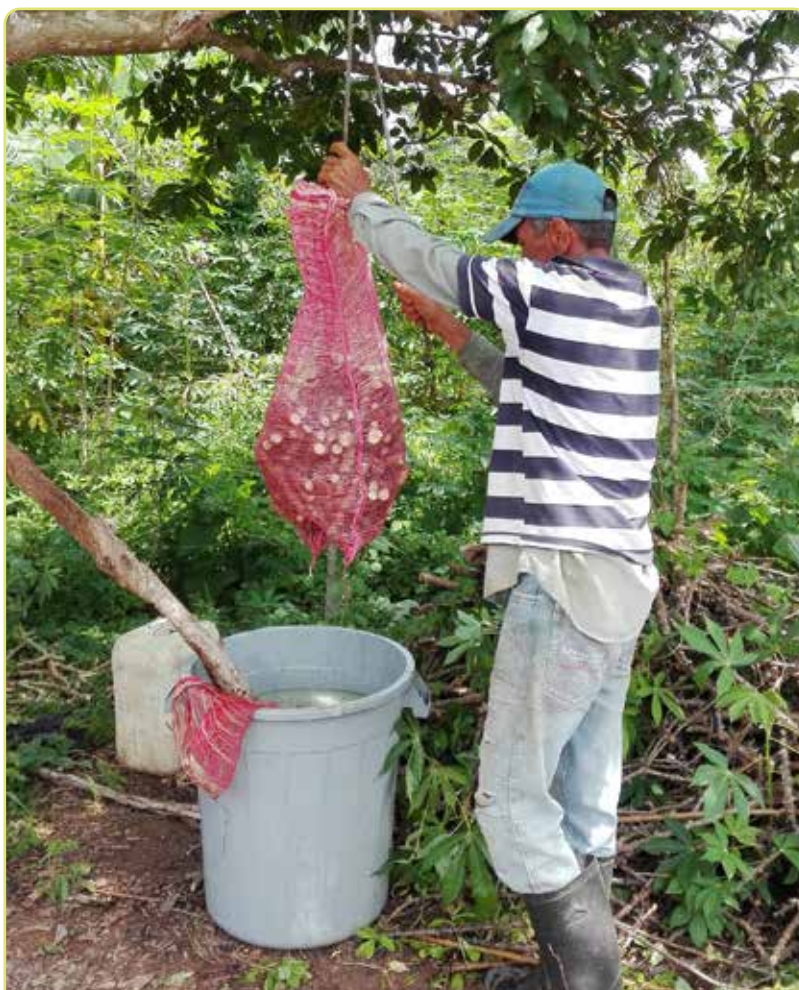
Figura 5. Productor desinfectando estacas de yuca.