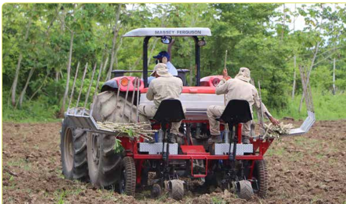
Figura 7. Sembradora semimecanizada de yuca.