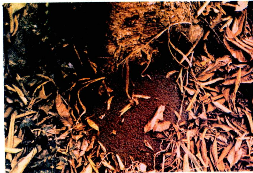
FIGURA 5. Millones de hormigas muertas, después de una aplicación de un insecticida con acción fulminante.

En las parcelas de los tratamientos clorpirifos y bendiocarb se encontraron millones de hormigas muertas, en el sitio de un nido principal (Figura 5).