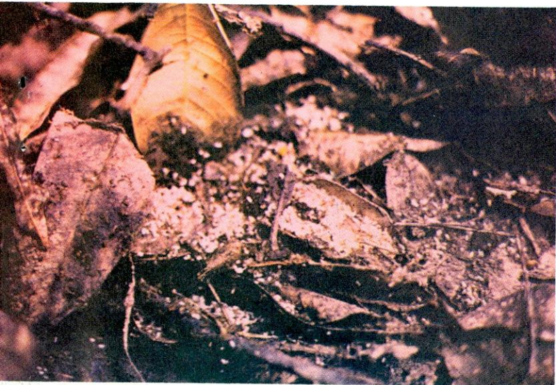
FIGURA 3. La hojarasca es uno de los sitios preferidos por la hormiga para mantener su cría en época de lluvia. Nótese la gran cantidad de inmaduros.

Antes de iniciar el ensayo se revisaron los alrededores de las casas y se encontró que donde terminaba el cemento o el piso de tierra y había sitios apropiados, existían tanto nidos principales como transitorios, debajo de basuras, piedras, troncos y en hojarasca (Figura 3), y que los frutales, cafetos y árboles de sombra mostraron los típicos síntomas de una alta población de N. fulva . Las hormigas entraban a las casas y subían a los muros.