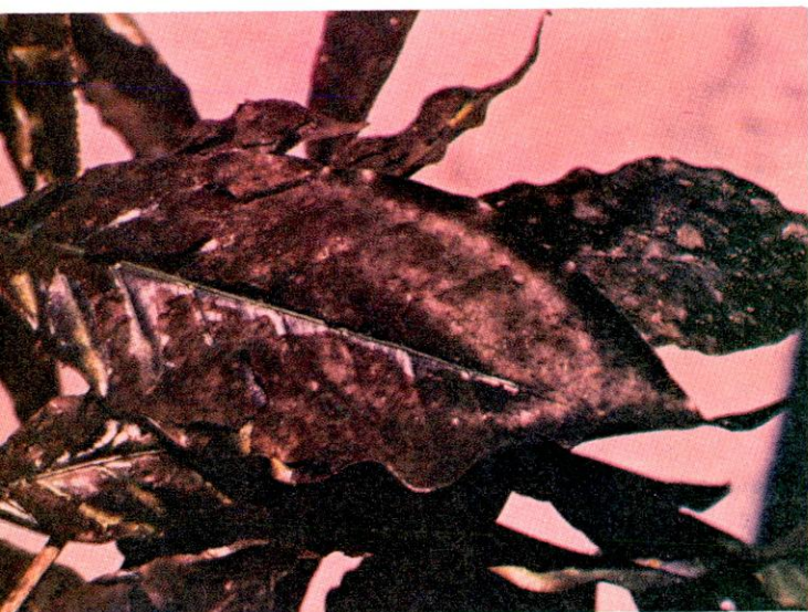
FIGURA 1. Hojas de cafeto cubiertas de fumagina, hongo que crece sobre las secreciones azucaradas de los homópteros. Toda la vegetación de la región afectada por N. fulva presentó este aspecto.

ecológicos en la zona cafetera de la Región del Tequendama (Cund.). Su presencia en frutales, cafetales y potreros impide realizar eficientemente cualquier tipo de labor, al causar molestias considerables al hombre, animales domésticos y silvestres. También es de importancia económica, por estar asociada con diversos insectos chupadores del Orden Homoptera, los cuales con sus secreciones azucaradas fomentan la producción de fumagina (Figura 1) y además atacan todo tipo de vegetación.