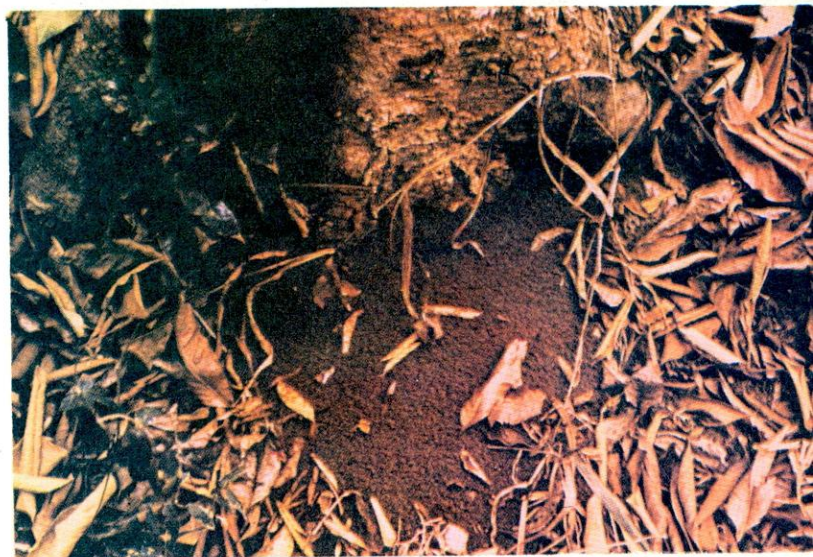
FIGURA 5. Millones de hormigas muertas, después de una aplicación de un insecticida con acción fulminante.

En las parcelas de los tratamientos clorpirifos y bendiocarb se encontraron millones de hormigas muertas, en el sitio de un nido principal (Figura 5).