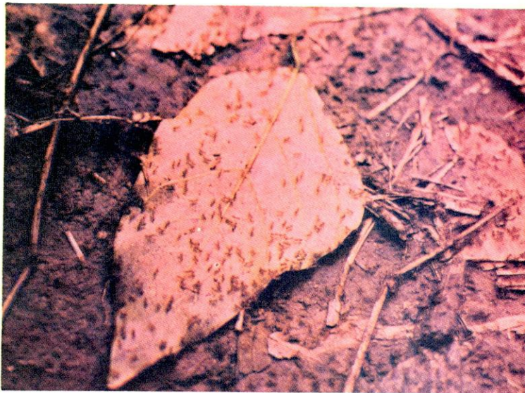
FIGURA 4. Columna de avance de N. fulva apenas formándose.

Además de los conteos se hicieron observaciones y encuestas, y se determinó, que los mejores tratamientos fueron el clorpirifos y el bendiocarb, seguidos por el pirimifosmetil. Ningún producto causó efecto nocivo a animales domésticos como gallinas, piscos y cerdos, los cuales aunque retirados durante la aplicación, estuvieron luego expuestos a los residuos.