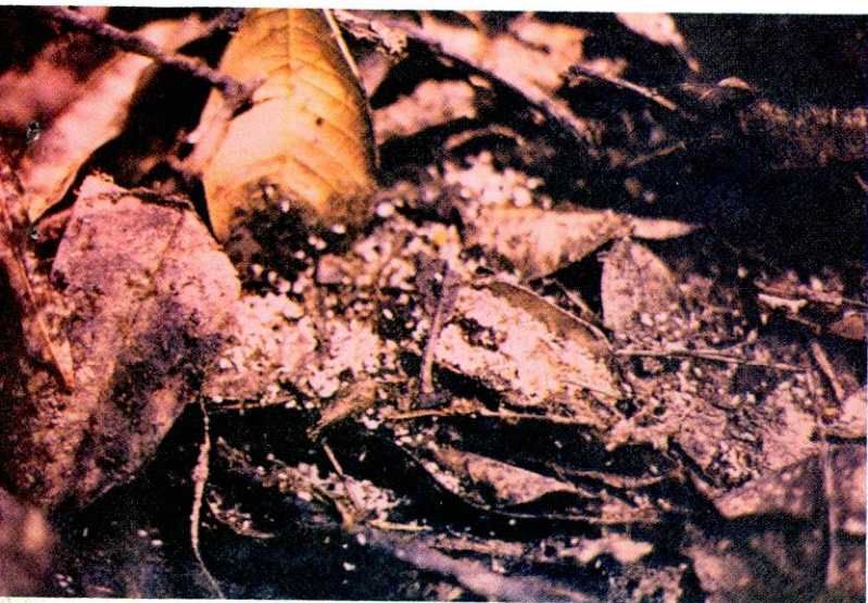
FIGURA 3. La hojarasca es uno de los sitios preferidos por la hormiga para mantener su cría en época de lluvia. Nótese la gran cantidad de inmaduros.

Antes de iniciar el ensayo se revisaron los alrededores de las casas y se encontró que donde terminaba el cemento o el piso de tierra y había sitios apropiados, existían tanto nidos principales como transitorios, debajo de basuras, piedras, troncos y en hojarasca (Figura 3), y que los frutales, cafetos y árboles de sombra mostraron los típicos síntomas de una alta población de N. fulva . Las hormigas entraban a las casas y subían a los muros.