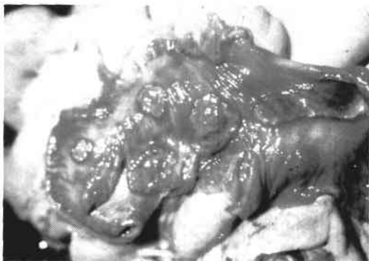
FIGURA 3. Peste Porcina Clásica. Observe la presencia de úlceras botonosas en la mucosa (superficie) del intestino grueso cubiertas con un material amarillo (tejido necrótico).