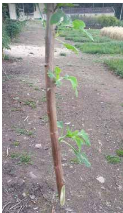
Estaca de T. diversifolia . C. I. Obonuco.