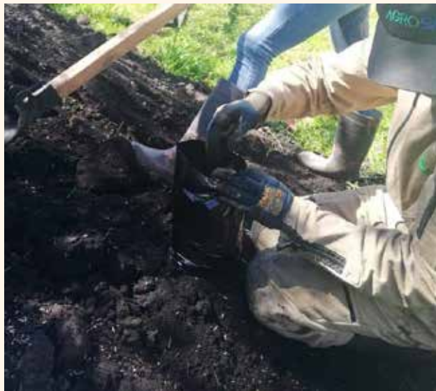
Llenado de bolsas en el C. I Obonuco.