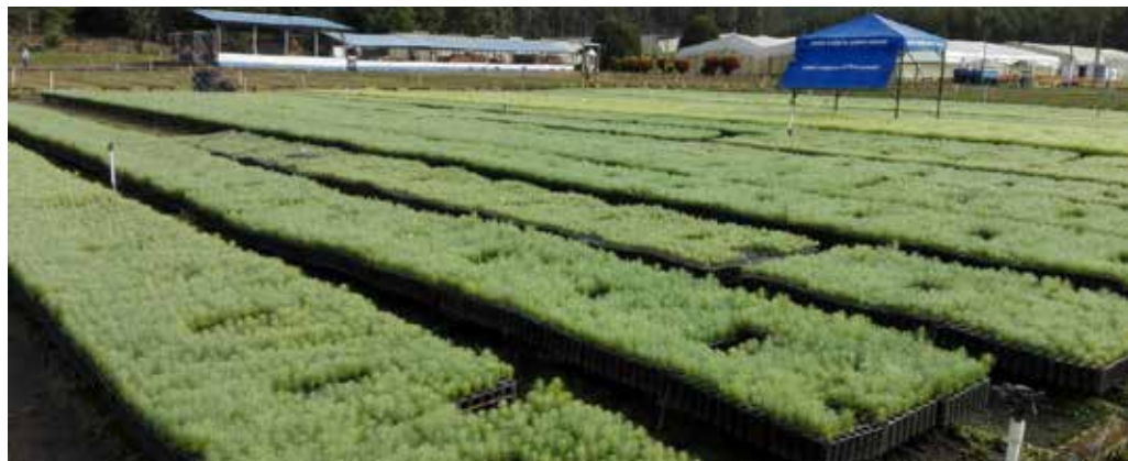
Vivero Forestal Rancho Grande, Valle del Cauca, Colombia.

Se conocen también como viveros fijos . Producen grandes cantidades de plantas todos los años. Requieren infraestructura sólida (almacenes, invernaderos, etc.).