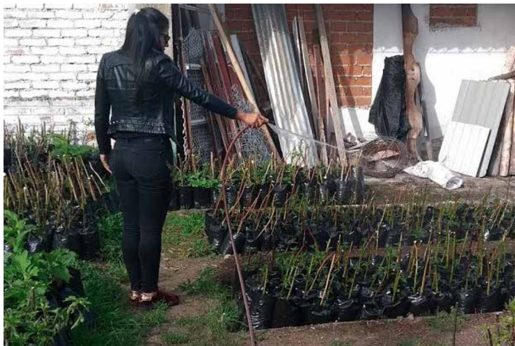
Riego de estacas en el C. I. Obonuco.

El riego no debe aplicarse en las horas de mayor incidencia de calor porque esto aumenta considerablemente la evapotranspiración y provoca lesiones en las plántulas e incluso su muerte.