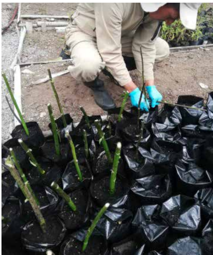
Siembra de las estacas.