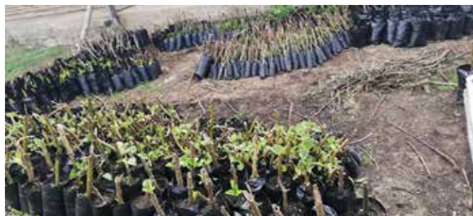
Vivero temporal C. I. Obonuco, Pasto, Nariño.

Son lugares destinados a la producción de plántulas . No requieren mucha infraestructura, ya que son utilizados por un periodo corto. Generalmente, se establecen cerca del lugar donde se realizará la siembra .