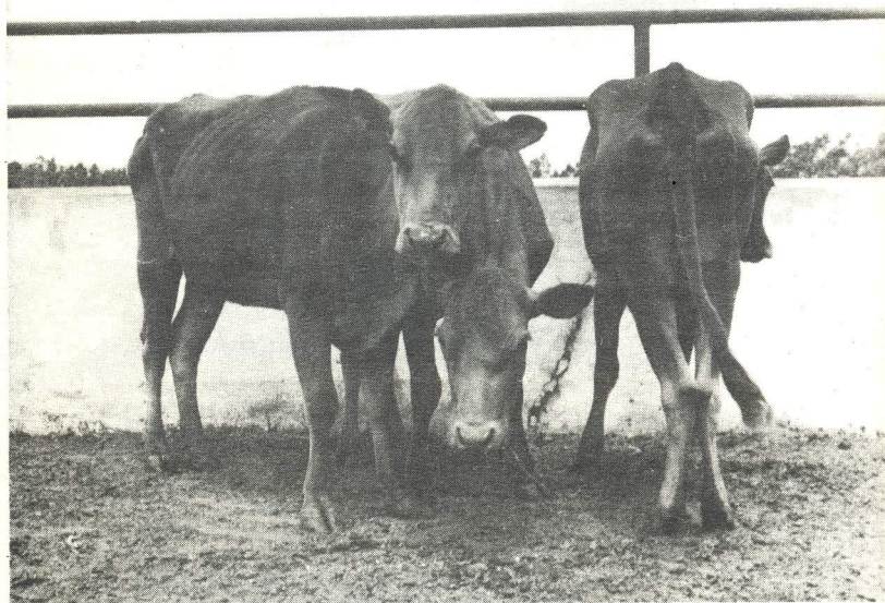
La falta de minerales en la alimentación se refleja en animales de mala apariencia general, de poco crecimiento y huesos deformes.