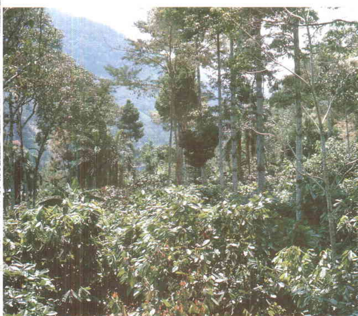
Aplicación de compuestos orgánicos en sistemas agroforestales con cacao.

Teléfono: 097-6345187 Fax: 097-6346717. E-mail: corpoica@cet.col.com