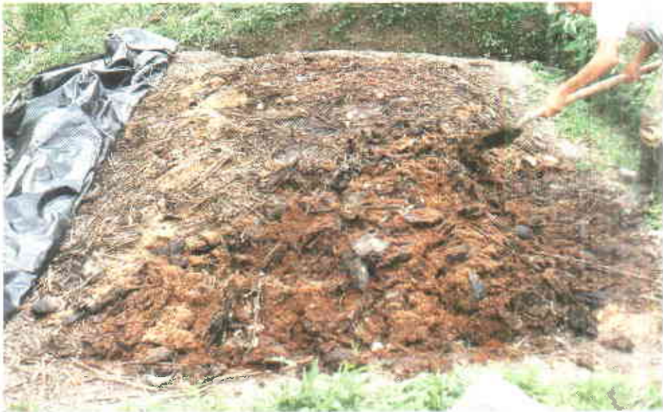
Los materiales utilizados en el Compostaje deben mezclarse cada 15 días.

Una vez realizada esta labor se coloca la primera capa de tierra oscura aproximadamente de 10 centímetros de espesor; se humedece y se coloca encima una capa de residuos vegetales frescos y picados, aproximadamente de 20 centímetros de espesor y luego se humedece. Posteriormente se coloca una capa de bovinaza, también de 20 centímetros de espesor y se espolvorea por encima la cal o la ceniza y se humedece.