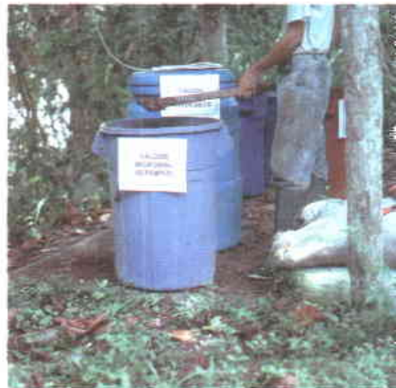
Producción de caldo microbial aeróbico.

Aeróbico: Es obtenido a partir de la fermentación aeróbica (o sea en presencia de oxígeno) de estiércol fresco de equino con agua natural, leche cruda y melaza. Para la preparación se recomienda utili-