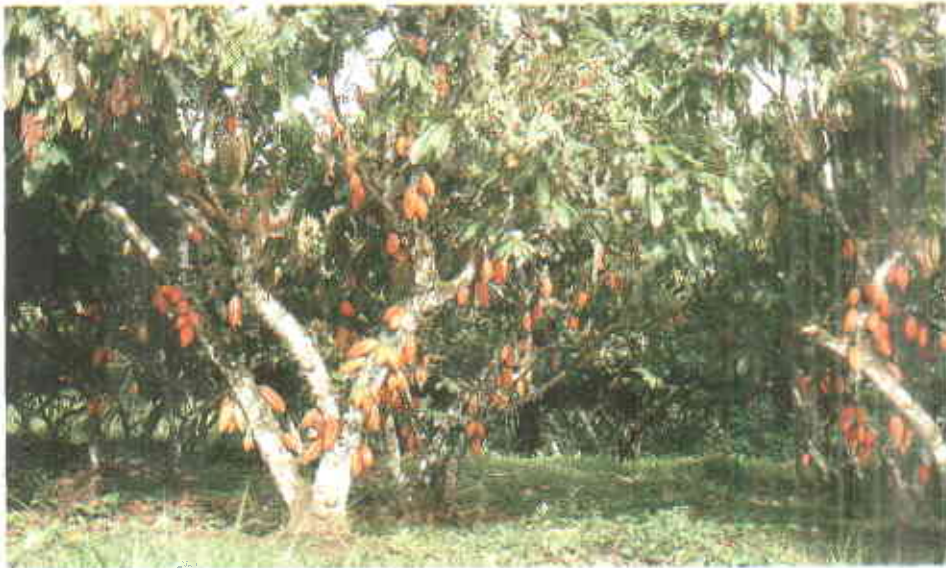
La aplicación continua de materia orgánica en cacao incrementa su producción.

Las prácticas utilizadas actualmente en la agricultura orgánica consisten en nutrir los micro y macroorganismos del suelo para que faciliten en las plantas la asimilación de los elementos esenciales para su desarrollo. El empleo continuo de materia orgánica durante el establecimiento y mantenimiento de las plantaciones de cacao, constituye la forma más eficiente para crear condiciones favorables en el desarrollo y multiplicación de los microorganismos; prácticas que mejoran la fertilidad del suelo y elevan su potencial productivo.