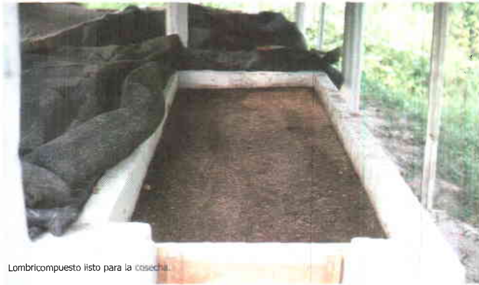
Lombricompuesto listo para la cosecha.

alimentar en los tres primeros días después de ser instaladas; durante estos días hacen sus propias galerías en el sustrato. A partir del tercer día se inicia la alimentación mediante el suministro del sustrato pre-descompuesto y con una humedad del 60%. Cada cuatro días se debe suministrar como alimento cantidades apropiadas de sustrato, dependiendo de la población de lombrices, del tamaño de los gránulos y del grado de descomposición del sustrato, hasta llenar la capacidad del módulo.