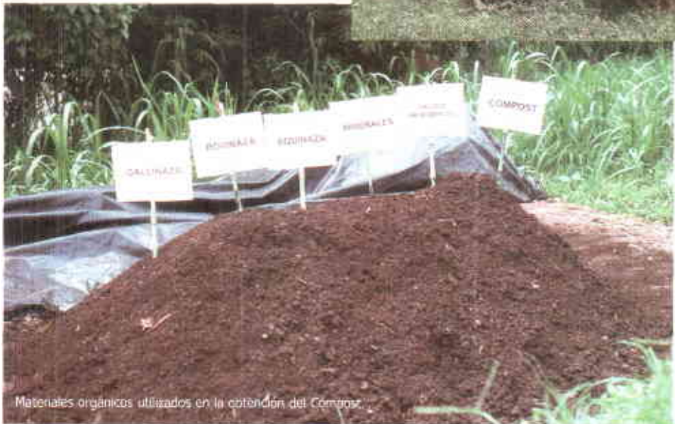
Materiales orgánicos utilizados en la obtención del Compost.