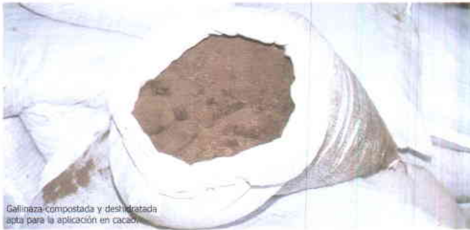
Gallinaza compostada y deshidratada apta para la aplicación en cacao.

Es un material, compuesto por las excretas de las gallinas, residuos de alimentos, plumas, huevos rotos y el material fibroso de la cama con cal; su composición química varía de acuerdo con la cantidad de estos compuestos y el tipo de explotación, dependiendo si es gallinaza de piso o de jaula.