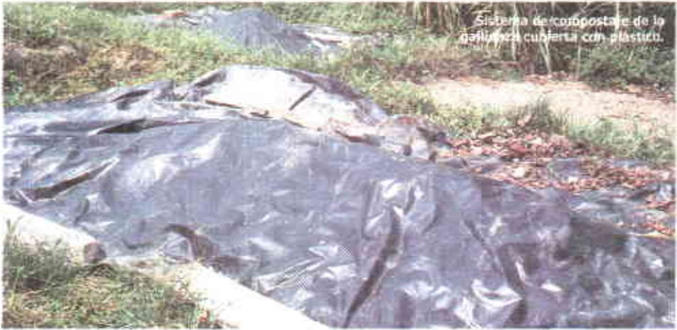
Sistema de compostaje de la gallinaza cubierta con plástico.

los microorganismos descompongan la materia orgánica y ponga a disposición los nutrientes. Así mismo, debe ser sometida a secado para almacenarla sin desencadenar procesos fermentativos, aumentando la concentración de materia orgánica y evitando el desarrollo de organismos perjudiciales para el cultivo de cacao. Después de seca la gallinaza debe ser tamizada y molida para homogenizar el producto, darle un tamaño uniforme a las partículas y aumentar la superficie de contacto con el suelo. El empaque y almacenamiento adecuados garantizan la conservación del producto cumpliendo con las características de calidad.