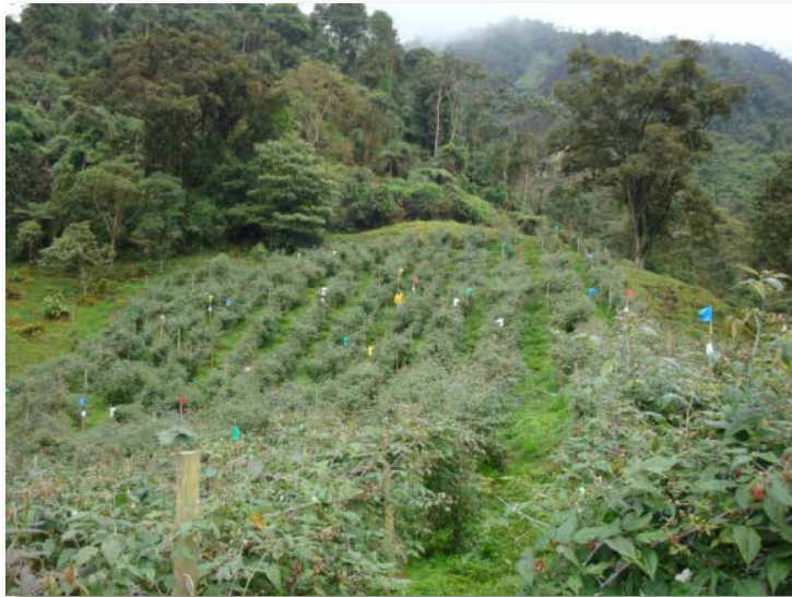
Figura 35. Parcela Agua Bonita. Para facilitar las aplicaciones de los antagonistas, cada tratamiento se marcó con una bandera de color.

El bioensayo se estableció bajo un diseño de bloques completos al azar, con tres repeticiones; la unidad experimental (UE) consistió en dos surcos con cinco plantas cada uno, para un total de 10 plantas por UE, con tres repeticiones, para un total de 30 plantas por tratamiento (Figura 35).