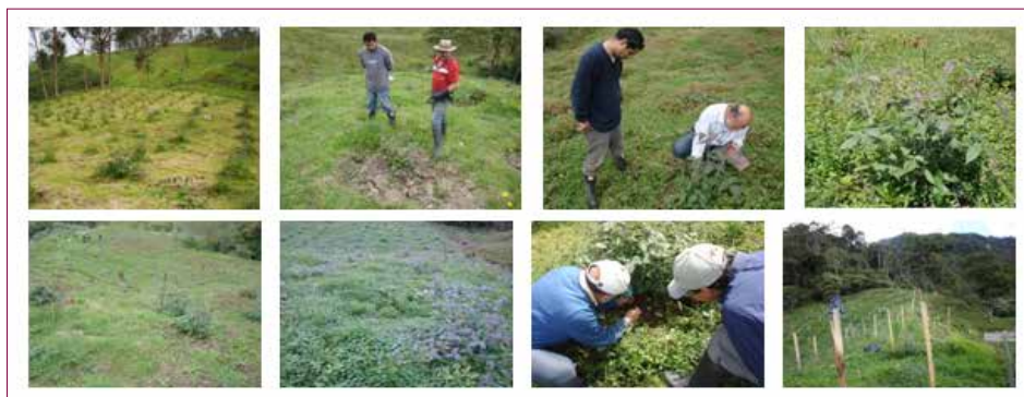
Figura 33. Seguimiento a la parcela experimental en la vereda Agua Bonita.

El esquema de fertilización se estableció de acuerdo con las recomendaciones generadas a partir del análisis químico del suelo de cada parcela y consistió en una fertilización posterior al ploteo, agregando 150 g de cal dolomita; 20 días después se aplicó alrededor de cada planta una mezcla de los siguientes fertilizantes: urea, 30 g; KCl, 40 g, y Agrimins ® , 30 g. La fertilización foliar consistió en la aplicación del fertilizante Tottal ® . Este esquema se repitió cada tres meses.