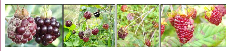
Figura 36. Característica de los frutos cuantificados para determinar la incidencia de moho gris.

Los resultados obtenidos se estudiaron mediante un análisis de varianza y comparación de medias, usando el test Tukey con \alpha : 0,05.