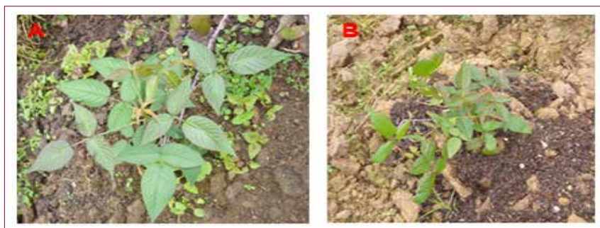
Figura 32. Plantas de mora después de un mes de su siembra en las parcelas experimentales A. Agua Bonita. B. Monterrico.

Después del seguimiento de las parcelas durante dos meses, no murieron las plantas, sino que se adaptaron a las condiciones y desarrollaron rebrotes (Figura 32).