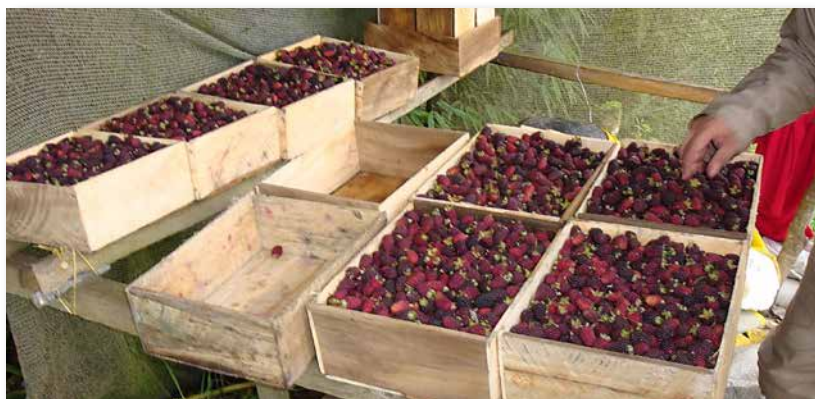
Figura 39. Cosecha de fruta.

El uso de los antagonistas y los fungicidas redujo la incidencia del moho gris; en la parcela Agua Bonita se observó una mayor producción de fruta en estos tratamientos; sin embargo, es necesario desarrollar un esquema