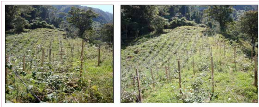
Figura 34. Tutorado de la parcela experimental de la vereda Agua Bonita, del municipio de Silvania (Cundinamarca).

Una vez las plantas entraron en periodo de fructificación (entre 10 a 12 meses) se estableció su tutorado, el cual consistió en un sistema de doble poste a cada lado del surco de siembra, a una distancia de 75 cm de la base de la planta, repitiéndose cada cuatro m y cada poste con una longitud de 1,60 m desde la base del suelo. Para colgar las plantas se extendió desde los primeros postes, de uno de los extremos del surco al otro extremo, una guaya de acero a la cual se le colgaron con cuerda las plantas; antes de colgarlas se les realizó una poda, dejando de 6 a 8 ramas desde la corona radical, quitándoles, además, las hojas bajas. Este sistema permite abrir la planta, facilitando las labores de poda sanitaria y de formación, así como la recolección de frutos y la reducción de la humedad en la filósfera (Figura 34).