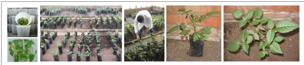
Figura 30. Endurecimiento en invernadero de vitroplantas de mora ecotipo Monterrico, utilizadas en el establecimiento de las parcelas experimentales en el municipio de Sylvania (Cundinamarca).

El endurecimiento de las vitroplantas se realizó en bolsas plásticas de 1 kg con sustrato suelo y cascarilla en proporción 3:1, el cual previamente fue inoculado con el bioplaguicida a base del hongo, mediante la aspersión de una suspensión de 1 \times 10^6 conidios.mL -1 (Beltrán y Cotes, 2009). Cada quince días y durante tres meses se realizaron refuerzos del bioplaguicida a una concentración de 1 \times 10^6 conidios.mL -1 y aplicaciones de un fertilizante foliar Tottal® (solución de microelementos). Una vez las plantas presentaron un tamaño de entre 15 cm y 25 cm, aproximadamente, tres meses después de la siembra fueron trasladadas a las parcelas experimentales para ser trasplantadas (Figura 30).