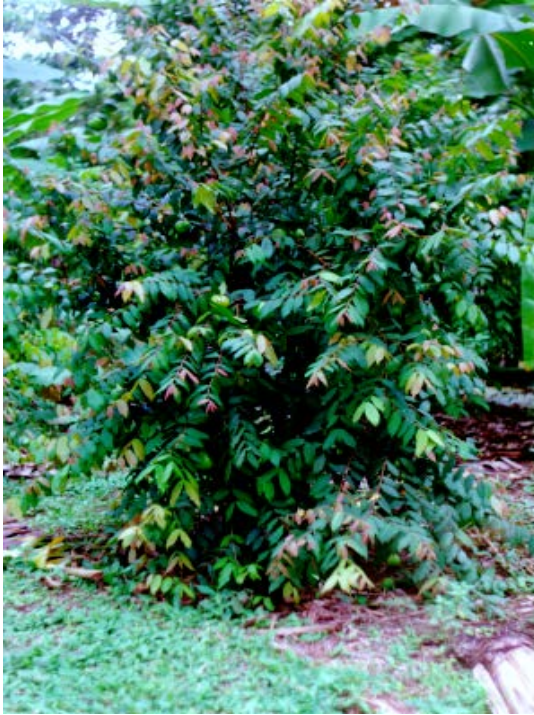
Foto 1. Hábitat del Arazá

El Arazá es una especie de sotobosque, de porte pequeño a mediano, común de la Amazonía, encontrándose principalmente en el Perú, Ecuador y en menor escala en Bolivia, Colombia y occidente Brasileño.