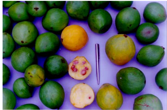
Foto 2. Frutos de arazá