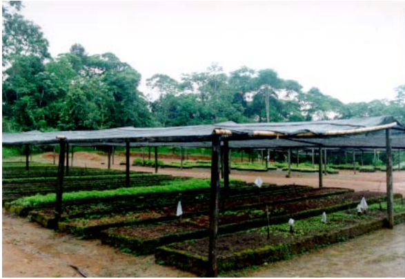
Foto 3. Propagación por semilla sexual de Arazá

La propagación de Arazá se realiza por semilla sexual recolectada de árboles con buenas características de formación y producción, obteniendo tasas de germinación hasta de un 90% cuando la siembra es inmediata debido a que rápidamente pierde viabilidad. Pero cuando el fruto se destina a la propagación, una vez cosechado puede guardarse hasta cinco días al medio ambiente, sin que la semilla pierda su poder germinativo. Las semillas retiradas de los frutos maduros son puestas en agua hasta por 10 días, luego de la cual se lavan y desinfectan, o también al ser extraídas se lavan con agua fría, frotándose a continuación con arena para quitarles la pulpa adherida, se secan a la sombra durante 24 horas y se siembran de inmediato.