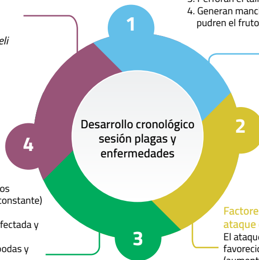
Figura 19. Esquema abordado en la sesión de plagas y enfermedades.

El ataque de plagas y enfermedades se ve favorecido por las condiciones climáticas (aumento de humedad relativa y altas temperaturas), el desequilibrio poblacional (reducción de enemigos naturales por el mal manejo de los cultivos), el establecimiento en zonas no aptas, semilla o material vegetal de baja calidad, malas prácticas que favorecen la dispersión, plantas susceptibles, etc.