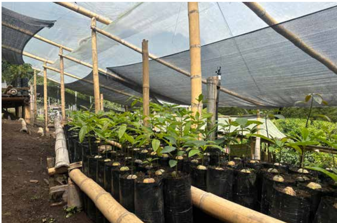
Figura 16. Vivero de aguacate ubicado en el municipio de Herveo, vereda Arenillos.