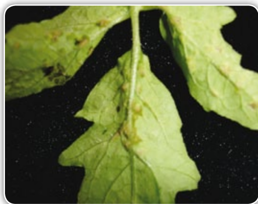
Figura 4.25. Edema por saturación de agua en las hojas

Edema. Se caracteriza por protuberancias verdes como callos en las superficies superiores e inferiores de la hoja (Figura 4.25). Estas protuberancias pueden quebrarse a medida que crecen.