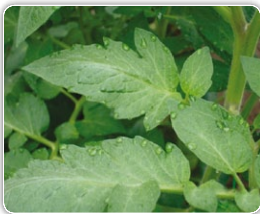
Figura 4.8. Rocío depositado sobre las plantas por alta humedad relativa

suelo); por tanto, se debe evitar al máximo el escape del aire caliente a través del cierre de las cortinas, lo cual debe hacerse en promedio alrededor de las 3 o 4 de la tarde. Generalmente la cubierta es la superficie más fría sobre la que se deposita en su interior la condensación de la humedad del ambiente, y si la cubierta no tiene aditivos (anticondensación) la humedad se sitúa sobre el follaje de las plantas en forma de rocío (Figura 4.8), el cual es uno de los factores de mayor predisposición para el ataque de enfermedades como la gotera ( Phytophthora infestans ) y mancha gris ( Botrytis cinerea ). Otra alternativa es la quema de leña o carbón dentro de recipientes metálicos en el interior del invernadero formando brasa (no llamarada) en las horas de la noche cuando esté más baja la temperatura, colocando los recipientes en sitios estratégicos al interior del invernadero y cuidando de no causar algún tipo de incendio. Dichos recipientes deben ser tapados dejando una pequeña abertura para la entrada de oxígeno a fin de mantener la brasa prendida por un mayor tiempo. Es importante al día siguiente abrir el invernadero para permitir la salida del gas carbónico.