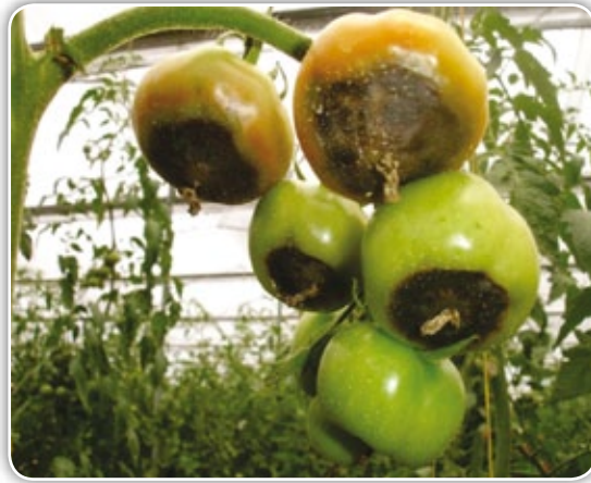
Figura 4.13. Daño típico en fruto por una deficiencia de calcio

dad relativa dentro del cultivo; utilizar variedades tolerantes a poco calcio en el suelo y efectuar aplicaciones foliares con productos a base de calcio como nitrato o cloruro de calcio, realizándolas en el momento de la floración (Zeidan, 2005).