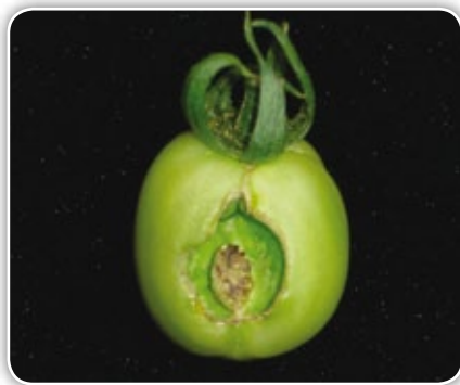
Figura 4.18. Fruto con placenta descubierta

Placenta descubierta. Esta se presenta por cambios bruscos en la humedad y en la temperatura, lo que ocasiona una mala polinización. El síntoma característico se presenta en los frutos, en los cuales se manifiesta una deformación dejando al descubierto la placenta en desarrollo donde se encuentran las semillas (Figura 4.18).