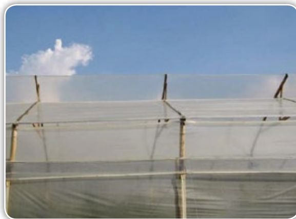
Figura 4.11. Invernadero tradicional con apertura fija en la cumbrera

A medida que la temperatura se incrementa en un invernadero, calienta el aire al interior de él, este aire es atrapado en la parte más alta de la estructura, por lo que debe existir una apertura fija en la cumbrera entre 30 y 40 cm que permita la liberación de calor e igualmente ventanas laterales y ventanas en la fachada frontal y posterior (Figura 4.11).