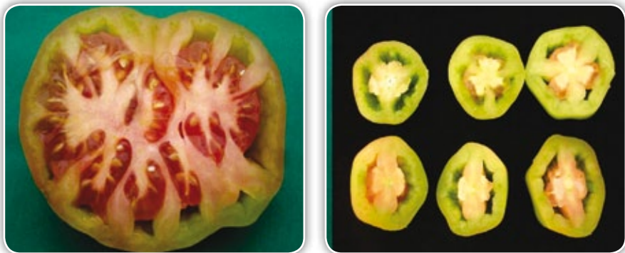
Figura 4.24. Frutos huecos

Frutos huecos. Este desorden en la planta es ocasionado por el excesivo uso de nitrógeno en la aplicación de fertilizantes, abuso de hormonas para el cuajamiento del fruto, baja radiación solar, una mala polinización y el empleo de variedades sensibles a esta anomalía. Por estas mismas condiciones, también pueden formarse frutos triangulares, que no poseen las mismas características de la variedad. Los frutos huecos presentan la formación de una cavidad o hueco