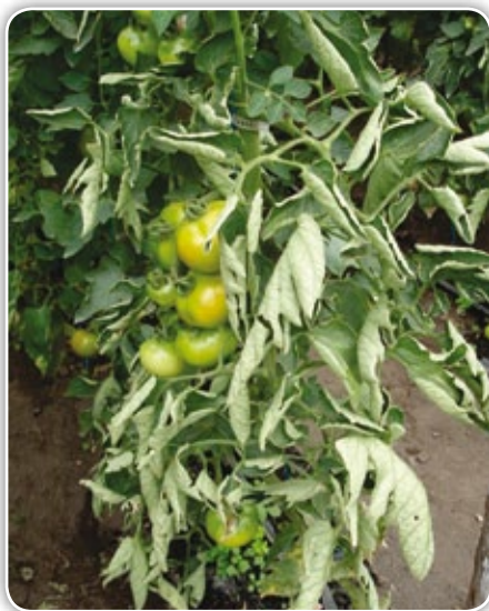
Figura 4.22. Hoja enrollada hacia abajo por alta radiación solar

Pérdida del punto de crecimiento o “planta macho”. Cuando plantas de crecimiento indeterminado paran el punto de crecimiento por razones desconocidas, aparece una inflorescencia o una hoja en la corona similar a lo que sucede al final del punto de crecimiento en variedades determinadas. Es muy común en cam-