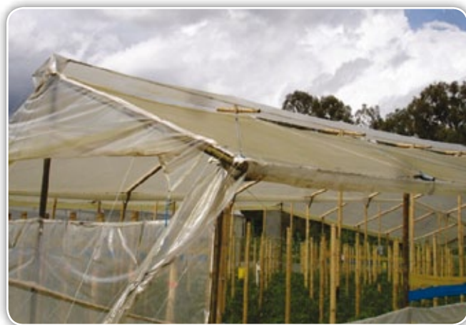
Figura 4.12. Acumulación de polvo sobre el plástico en un invernadero

La producción y su calidad se ven severamente afectadas por el sombreado artificial o por la acumulación de polvo sobre la superficie externa de los plásticos (Figura 4.12), lo cual reduce la cantidad e intensidad de la penetración de la luz dentro del invernadero. La luminosidad también se ve afectada al interior del invernadero cuando se utilizan altas densidades de siembra, ya que las mismas plantas se producen sombreado entre sí, e igualmente al exceso de estructuras al interior del invernadero que reduce la cantidad de luz.