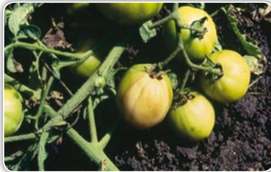
Figura 4.27. Frutos con golpe de sol

Golpe de sol. Se produce por una exposición directa del fruto a los rayos del sol, lo cual genera un área blanca brillante y correosa (Figura 4.27). Se presenta cuando se realizan podas fuertes de hojas dejando el fruto descubierto, lo que aumenta repentinamente la temperatura del fruto ocasionando un daño en el tejido.