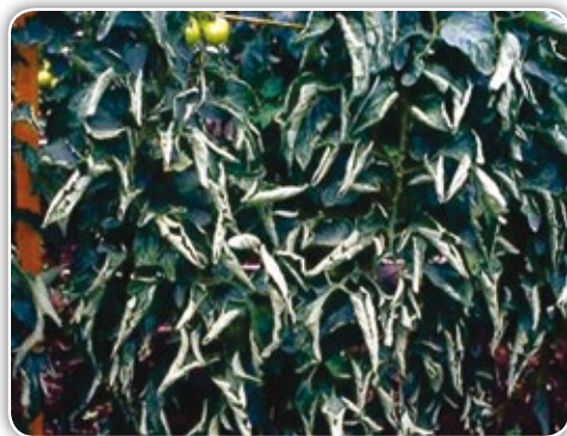
Figura 4.21. Hoja enrollada hacia arriba por condiciones de estrés en la planta

quedan expuestos a condiciones extremas de temperatura, incrementándose la susceptibilidad del fruto al agrietamiento y a diferentes niveles de golpe de sol e incluso puede afectarse su firmeza. En general, las hojas se vuelven quebradizas y frágiles; se mantienen turgentes pero no se marchitan. Aun así, el crecimiento de la planta no se afecta y la formación de frutos es normal (Zeidan, 2005).