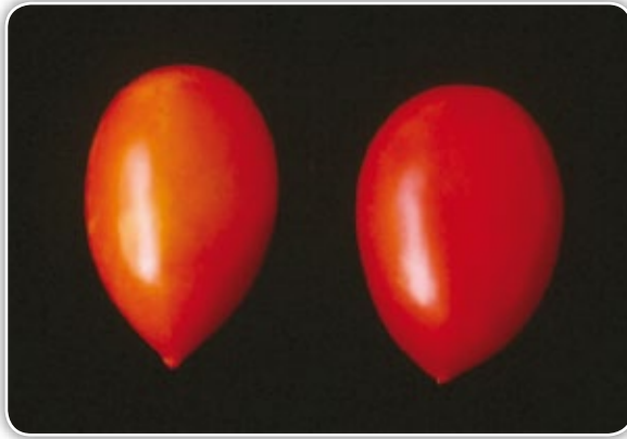
Figura 4.5. Elongación de frutos por bajas temperaturas