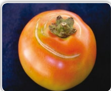
Figura 4.15. Grietas concéntricas