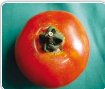
Figura 4.16. Grietas diminutas