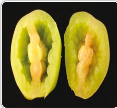
Figura 4.6. Frutos huecos