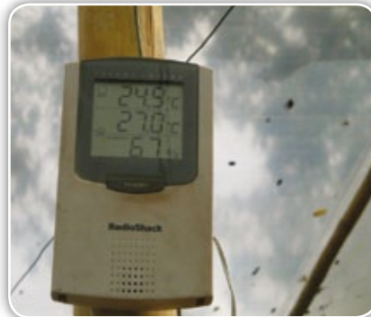
Figura 4.10. Diferentes termómetros y termohigrógrafos para tomar temperaturas y humedades máximas y mínimas al interior del invernadero

Para resolver el incremento de calor y la alta humedad relativa se debe aprovechar al máximo la ventilación natural. Para ello se utiliza la presencia y dirección de los vientos, combinadas con el cierre y apertura de cortinas. Las aperturas laterales y cenitales permiten la circulación del aire al interior del invernadero.