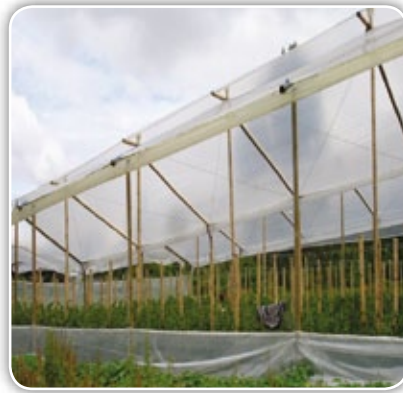
Figura 4.9. Apertura de cortinas del invernadero para ventilación