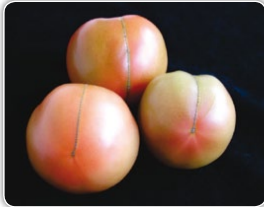
Figura 4.26. Frutos con estrías tipo cremallera

longitudes y es causado por un problema de mala polinización, ya que al momento de formarse el fruto las anteras quedan adheridas en la pared del ovario (Figura 4.26). Aparece cuando hay extremos de temperaturas (altas o bajas) y exceso de humedad en el invernadero. Existen variedades más sensibles que otras.