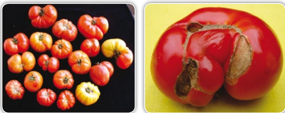
Figura 4.17 Frutos con malformaciones Caregato

Malformaciones (Caregato). Es un desorden común en cultivos bajo invernadero que se presenta por la presencia de alta humedad relativa y bajas temperaturas, lo que conlleva a una disminución de la viabilidad y la cantidad del polen, y una distorsión tanto del ovario como de los estambres, produciendo la deformación del fruto acompañado de un tejido corchoso en las cavidades que se forman; esto hace que este tipo de frutos sean rechazados en el mercado (Figura 4.17).