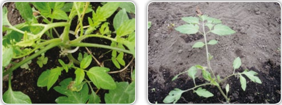
Figura 4.23. Plantas que perdieron su punto de crecimiento

La desaparición del punto de crecimiento puede ocurrir tanto en semillero como en los primeros días del trasplante o después de la aparición normal de la 5 - 6 inflorescencia en la planta, y esta aparece en solamente un pequeño porcentaje del cultivo. En ciertos casos la interrupción del crecimiento es total, mientras que en otros una nueva rama secundaria crece para reemplazar el punto de crecimiento (Figura 4.23) (Zeidan, 2005).