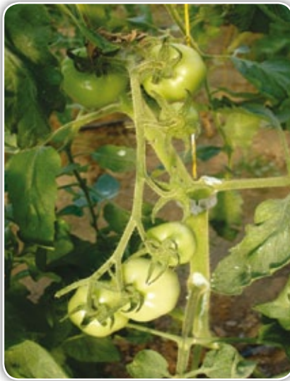
Figura 4.2. Asimetría de la inflorescencia