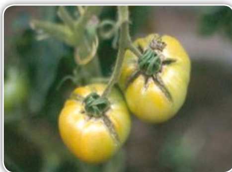
Figura 4.14. Grietas radiales