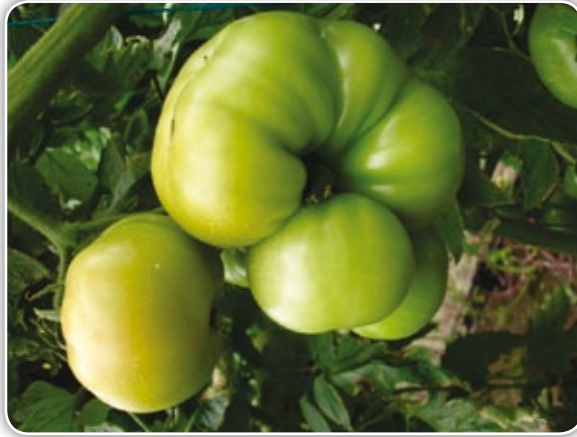
Figura 4.4. Deformación de frutos por bajas temperaturas