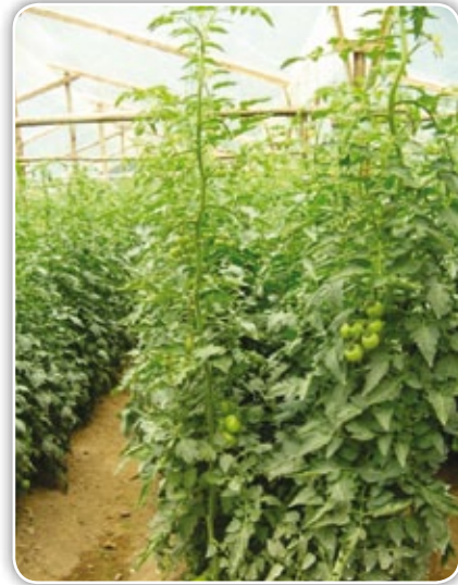
Figura 4.3. Entrenudos largos