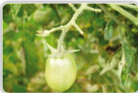
Figura 4.19. Aborto de flores en la inflorescencia

Caída de flores. Se da cuando la humedad relativa del invernadero está por debajo del 60% o cuando la planta está expuesta a vientos, lo cual evita la polinización normal de la flor, el polen se seca y causa su aborto, o también, el exceso de humedad relativa hace que el polen se humedezca, se compacte impidiendo la polinización y causando el aborto de flores.” (Figura 4.19). También se presenta por una deficiencia de boro en la planta, especialmente en época de floración, cuando se hacen aplicaciones excesivas de nitrógeno y por la presencia de enfermedades como moho gris o Botrytis cinerea .