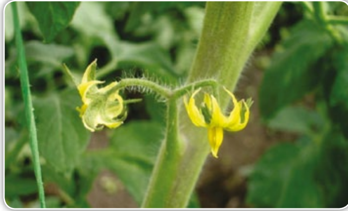
Figura 4.1. Reducción de flores en el racimo por altas temperaturas