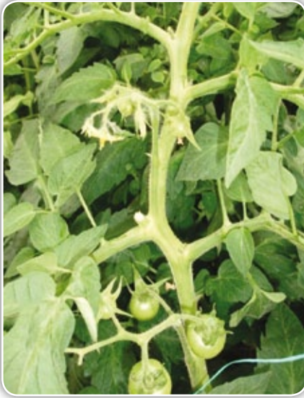
Figura 4.7. Entrenudos cortos por bajas temperaturas

Cuando se produce un aumento de temperatura en un invernadero, esta provoca en la planta una intensificación de todos los procesos biológicos y térmicos bien definidos, que son de necesario conocimiento en las plantas cultivadas bajo condiciones protegidas (temperatura óptima, mínima y máxima) (Tabla 4.1).