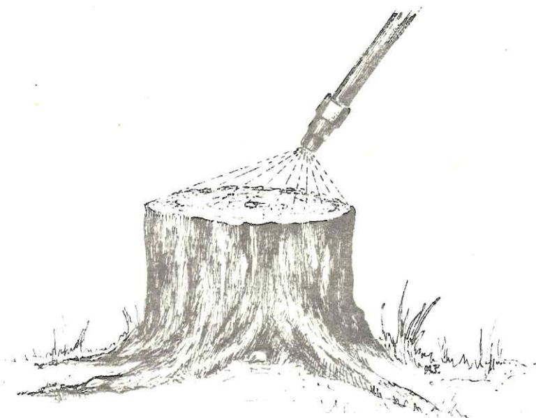
FIGURA 3. CONTROL POR TRATAMIENTO DE TOCONES.