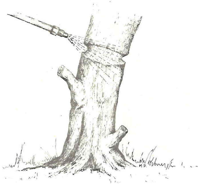
FIGURA 4. CONTROL POR TRATAMIENTO EN CORTES DE CAVIDAD CIRCULAR.

Control químico de malezas herbáceas de hoja ancha.