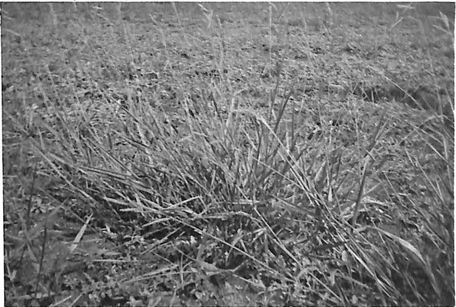
Establecimiento de Pasto Llanero.