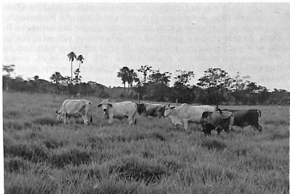
Praderas de Braquiaria Llanero en pastoreo.