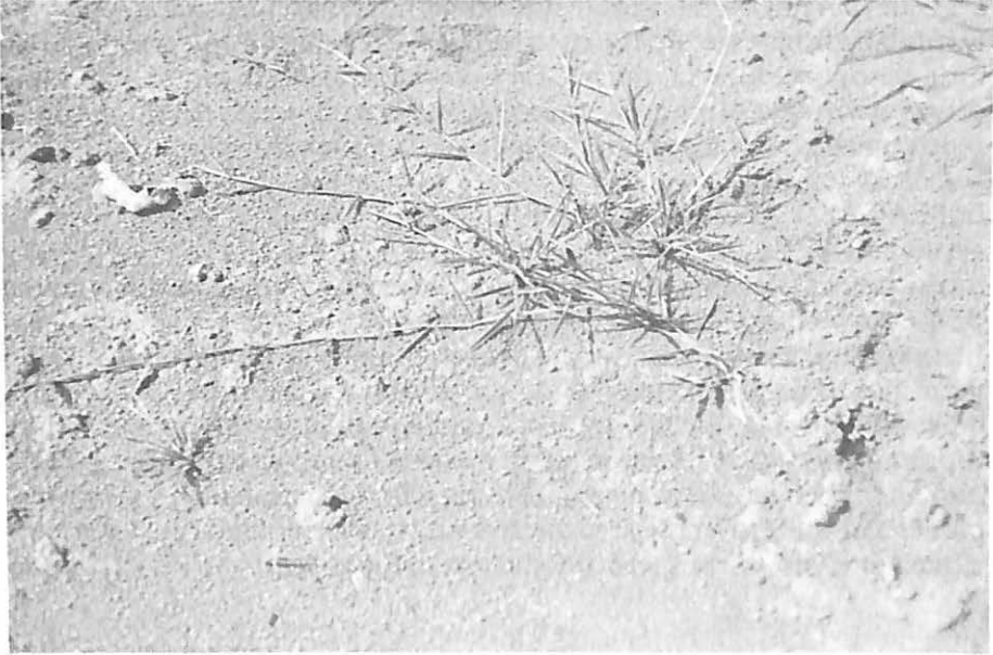
Pasto Llanero, macollas y estolones.

Las espiguillas son aovadas u oblongas, usualmente de color púrpura oscuro o verde opaco, con 6 a 7 mm de longitud y 2.5 mm de ancho. La primera gluma posee nervaduras longitudinales paralelas. La segunda gluma es membranosa y de color verde claro, con vellosidades largas, abundantes y dirigidas hacia arriba.