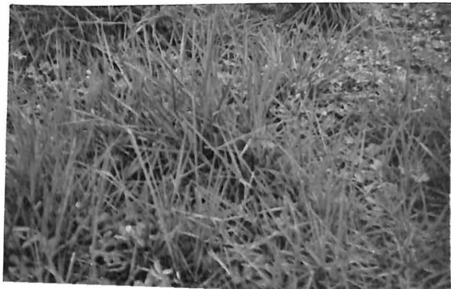
Asociación de Braquiaria Llanero con leguminosa.

El LLANERO ha mostrado buena compatibilidad con leguminosas trepadoras o estoloníferas.