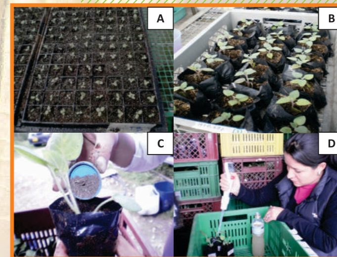
Figura 5. Proceso de Inoculación A. Bandejas de plantulaje B. Bolsas con plántulas C. Inoculación con HFMA. D- Inoculación con BSF o BFN

mejores resultados. En el caso de inoculantes líquidos, se debe aplicar 1 ml/planta para BFN o BSP. Para HFMA se debe aplicar 70 esporas/g que corresponden a 1 g/planta.