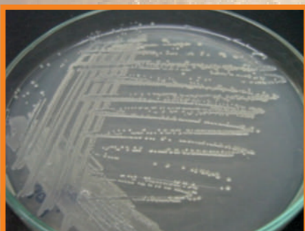
Figura 2. Bacteria Fijadora de Nitrógeno

Bacterias fijadoras de Nitrógeno - BFN: La planta necesita el Nitrógeno para su crecimiento y para formar proteínas. Este nutriente generalmente