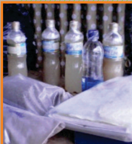
Figura 1. Biofertilizantes líquidos y sólidos

Un biofertilizante es un producto comercial o artesanal (líquido o sólido), que se produce a partir de la multiplicación de microorganismos benéficos para el desarrollo de las plantas, con el fin de ser aplicado a los cultivos y mejorar la productividad y sostenibilidad del mismo.