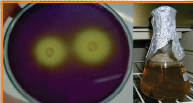
Figura 3. Bacteria Solubilizadora de Fósforo

Bacterias Solubilizadoras de Fósforo - BSP: El fósforo es un nutriente esencial para la planta. Permite que la planta tenga energía para los procesos de crecimiento y desarrollo. Es escaso en los suelos y generalmente se encuentra en forma no asimilable por las plantas (fijado). Las bacterias solubilizadoras de Fosfatos producen sustancias que permiten que el fósforo fijado pueda quedar libre en el suelo y pueda ser tomado por la planta.