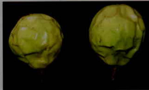
Frutos atacados por mosca