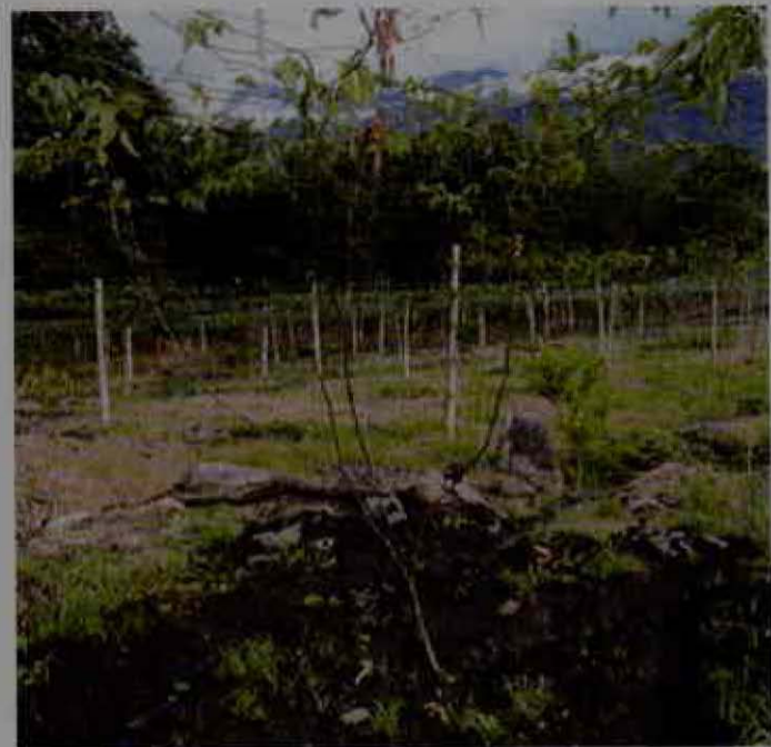
Zanjas y drenajes

Dentro de las técnicas de prevención de la incidencia de plagas y enfermedades en la plantación, además del monitoreo permanente, es conveniente realizar prácticas culturales que favorezcan una adecuada ventilación y que ayuden a reducir la humedad relativa dentro del cultivo. Se deben trazar y abrir las zanjas para drenaje, evitando la acumulación excesiva de agua en el suelo. Cuando exista un riesgo evidente de infección por patógenos del suelo, se debe empezar por prevenirlas enfermedades causadas. Esto empieza con la desinfección del suelo antes de la siembra; se pueden implementar la solarización y la aplicación de enmiendas.