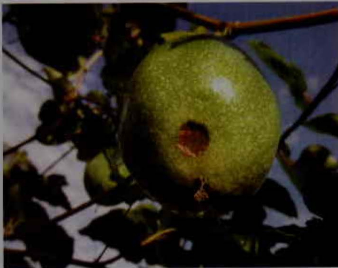
Antracnosis en fruto.

El patógeno presenta dos fases principales de nutrición durante la colonización de la planta: en la fase inicial parasita y se alimenta de los tejidos vivos de la planta, mientras que en la segunda fase continúa su desarrollo y nutrición en tejidos muertos por causa su ataque (Bailey, et al, 1992).