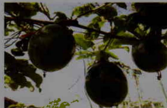
Frutos en formación