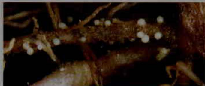
Daño por nematodos.

Meloidogyne sp. es un nematodo endoparásito sedentario. Presenta un amplio rango de hospedantes. Los síntomas se presentan en el sistema radical, lo que hace que interfiera en la absorción de agua y nutrientes de la planta. En las raíces se forman tumefacciones o agallas de diversas formas.