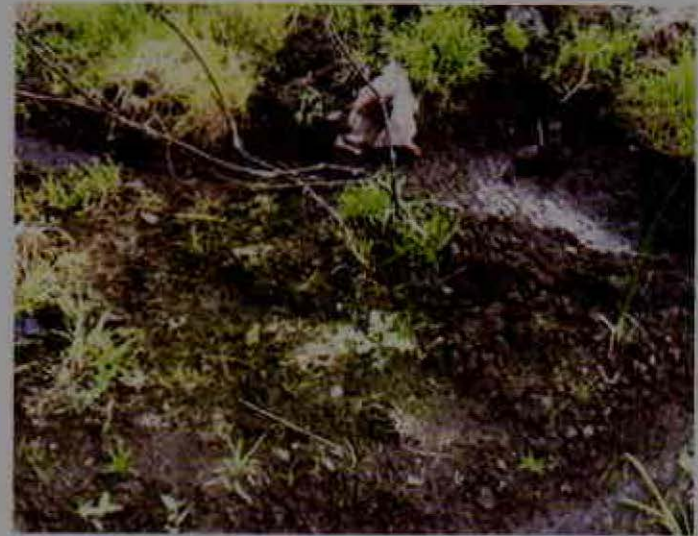
Alta humedad en el suelo

Durante los últimos años, el cultivo de maracuyá ha tenido una creciente demanda en los mercados nacional e internacional para el consumo en fresco y para la agroindustria. La reciente ola invernal ha generado un impacto negativo importante en las plantaciones establecidas. Debido a las altas precipitaciones y a su prolongada duración, se incrementó la humedad en el aire y suelo, lo que propició la incidencia y la severidad de enfermedades y plagas asociadas a este cultivo, que limitan el óptimo desarrollo del sistema productivo 1 .