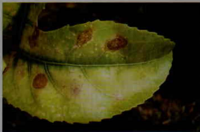
Síntomas causados por Alternaria sp.

Alternaria es un hongo que sobrevive fácilmente en el suelo con materia orgánica en descomposición. Produce abundantes esporas (conidias) sobre el tejido del hospedero, las cuales se desprenden con facilidad y son diseminadas por el agua y el aire. El hongo puede penetrar por ambas caras de la hoja, pero para hacerlo requiere agua libre por más de ocho horas (Agrios, 2005).