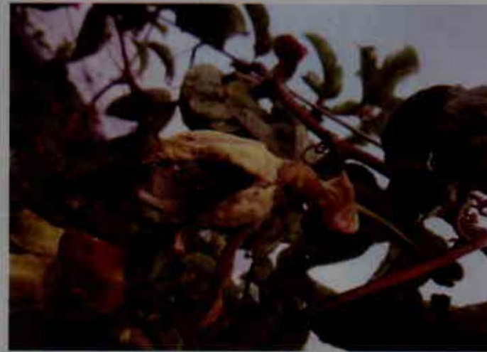
Flor de maracujá afectada

Además, los altos contenidos de humedad en el suelo alteran la disponibilidad de nutrientes y oxígeno para las raíces y afectan el óptimo desarrollo de las plantas, su vigor y su productividad, haciéndolas más sensibles al ataque de diferentes plagas y patógenos.