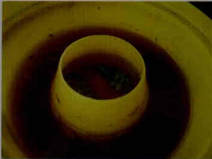
Trampa Mc Phail