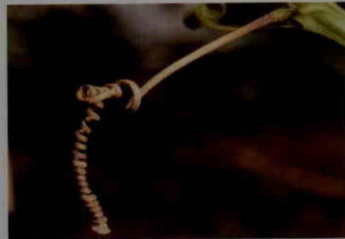
Antracnosis en zarzillos