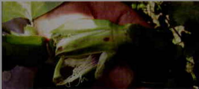
Sintomas de roña en flor

El hongo se disemina por la lluvia, el viento y las herramientas infectadas. Los tejidos jóvenes son muy susceptibles, por lo que es frecuente observar síntomas en brotes nuevos, similares a quemazones. En flores se observan lesiones de color café en sépalos y pétalos. Las lesiones viejas en los frutos presentan una especie de crecimiento algodonoso (micelio) gris verdoso.