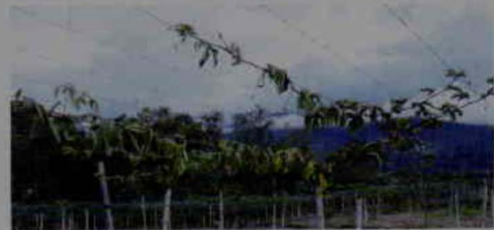
Síntomas de secadera.