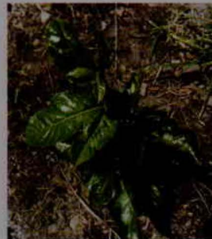
Planta recién establecida

La propagación de maracuyá es el primer paso para obtener un cultivo de buena calidad, especialmente en el aspecto fitosanitario, debido a que las plántulas y el suelo donde ellas se han propagado pueden ser portadores de patógenos muy graves para la plantación. Por esto es necesario que el material sea adquirido en viveros registrados ante el ICA, garante de la sanidad de las plantas. En caso de que se propague directamente, deben seleccionarse frutos de plantas sanas y vigorosas, con madurez fisiológica; se fermentan durante 5 días, se lavan y se siembran directamente en bolsa de 1 kg; se mantienen bajo umbráculo hasta que las plántulas tengan unos 40 cm de altura y el primer zarcillo, alrededor de dos meses después de la siembra (Cleves, Jarma y Fonseca, 2009).