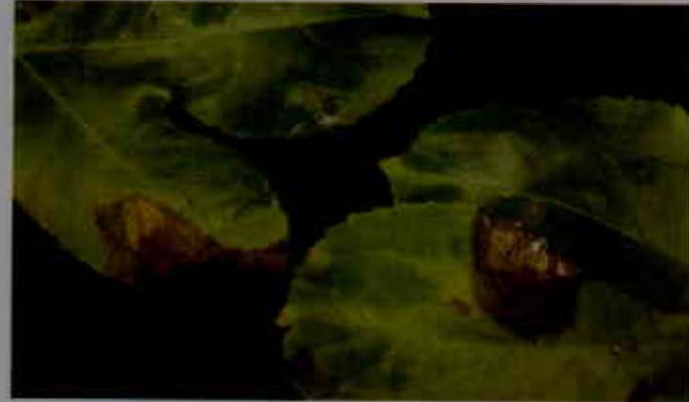
Mancha aceitosa en hojas

planta. La bacteria es diseminada por el agua, los insectos, las herramientas y el viento. Los frutos afectados carecen de valor comercial, pues se tornan flácidos.