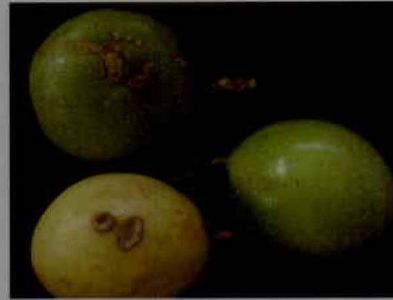
Sintomas de roña en frutos