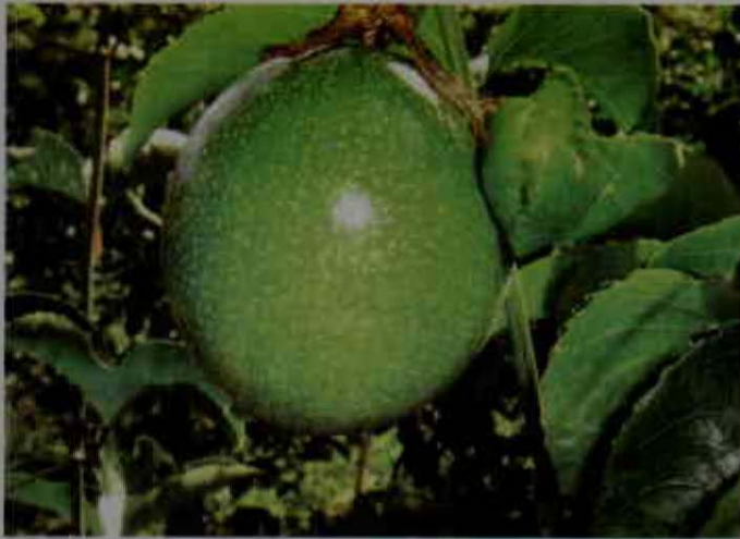
Frutos de maracujá

La reducción de hectáreas sembradas, descrita anteriormente, puede atribuirse a distintas alteraciones climáticas, ocasionadas por la reciente ola invernal. Su efecto negativo se debe al aumento y a la frecuencia de las precipitaciones que, favorecidas por las condiciones topográficas, incrementaron drásticamente los contenidos de humedad en el suelo, en algunas zonas, por ejemplo, se presentaron inundaciones. Todos estos factores han favorecido el aumento de los problemas fitosanitarios, con altos niveles de incidencia y severidad, que han llegado a disminuir la producción e incrementar los costos de manejo del cultivo.