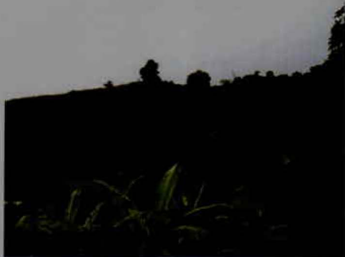
Expansión del cultivo de maracuyá en Cauca - Cauca, Colombia

Los núcleos productivos se localizan, principalmente, en los departamentos de Huila, Valle del Cauca, Tolima, Cesar, Córdoba, Meta, Magdalena, Santander y Antioquia. El rendimiento promedio, según Agronet, estuvo en 18 t/ha. Descendiendo en los dos últimos años a 16 t/ha. El área sembrada también ha caído, al pasar de unas 6.500 ha a 5.500. La producción nacional, para el año 2010, alcanzó casi las 90.000 t, experimentando un descenso con respecto a los años 2006 y 2007, cuando el