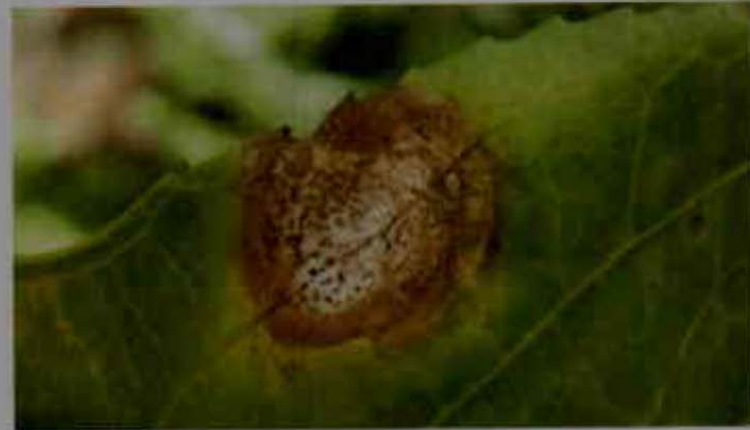
Antracnosis en hojas