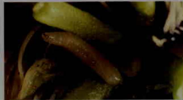
Larva de mosca de la fruta.

los botones y en las flores. Su ciclo de vida dura entre 27 y 35 días y comprende las siguientes etapas: huevo (3 a 5 días), larva (6 a 8 días), pupa (12 a 14 días) y adulto (6 a 8 días). El daño se produce en el botón floral, donde la mosca ubica los huevos que luego al eclosionar y convertirse en larvas se alimentarán vorazmente de las anteras, ocasionando su caída en su paso por salir de éste para empujar en el suelo. Las pérdidas por el daño de este insecto generan una disminución considerable en la producción 2 .