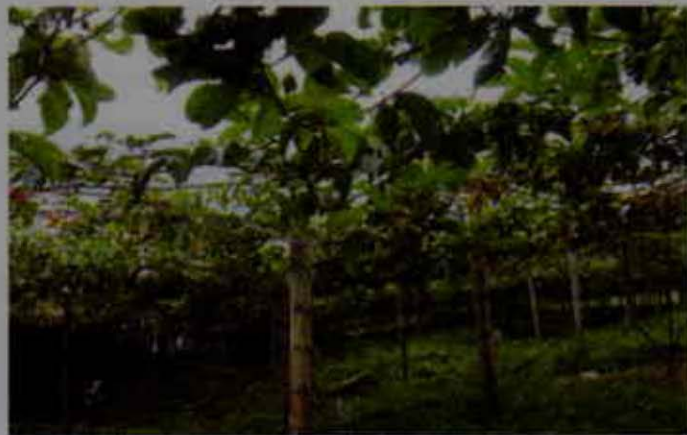
Cobertura con arvenses nobles

Con el fin de reducir los impactos negativos de las malezas o arvenses para el cultivo de maracuyá, se recomienda básicamente mantener el plato libre de ellas, mediante el control mecánico (machete o guadaña) a un nivel no superior a los 20 cm del suelo; en segunda instancia, se puede considerar el control químico con la aplicación de herbicidas, según la orientación técnica de un ingeniero agrónomo.