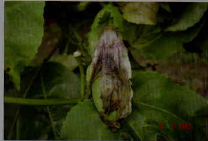
Síntomas de moho gris en flor

Entre los factores que favorecen la aparición de la enfermedad están las deficientes labores de cultivo, como podas y control de arvenses, y las altas precipitaciones, que incrementan la humedad dentro de la plantación.