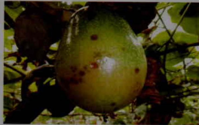
Mancha aceitosa en fruto