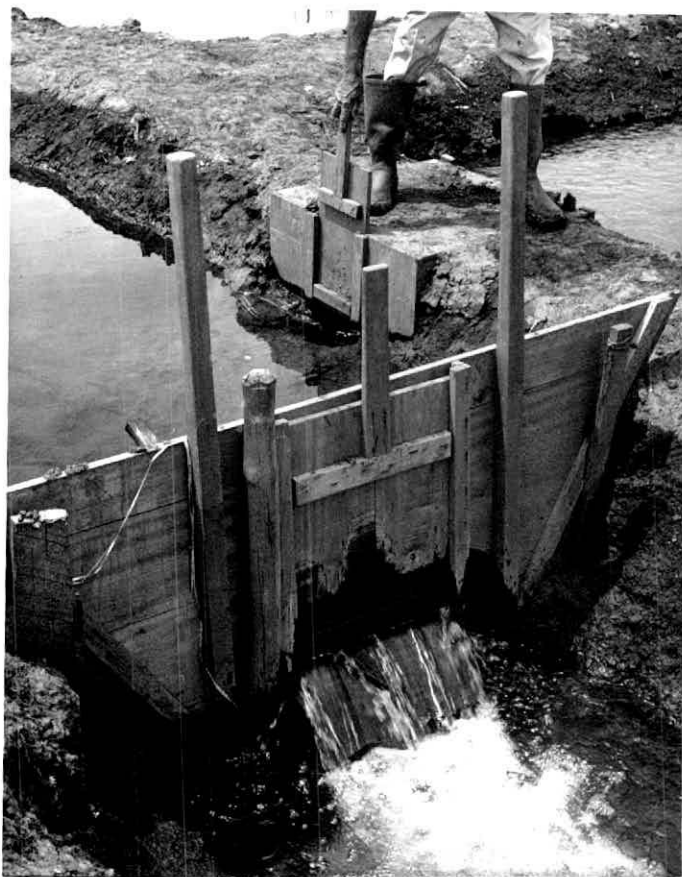
Figura 2.- Canal construido en el campo experimental de arroz mostrando un trincho y una caja de agua.