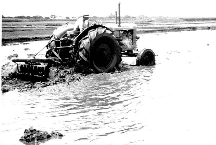
Figura 3.- Acarreo de material en el proceso de nivelación en agua.