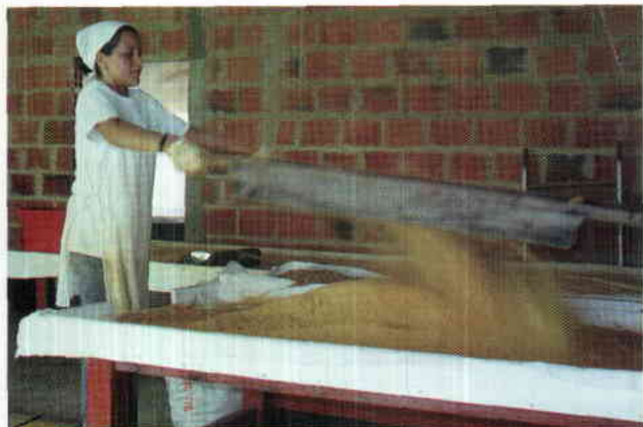
Figura 4. Tamizado manual de la panela granulada.

El calcio es además importante para regular la contracción muscular, el ritmo cardíaco y la excitabilidad nerviosa. El Instituto Colombiano de Bienestar Familiar (1996) establece que: "Los niños de 0 a 6 meses deben ingerir 350 mg/día,