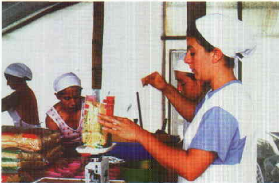
Figura 1. Dosificación y pesaje de la panela granulada

pequeños gránulos, con menor contenido de humedad.