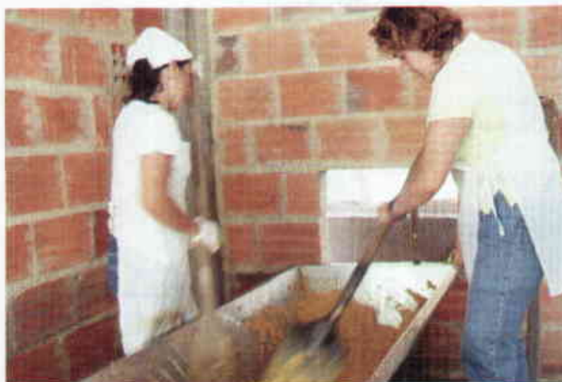
Figura 3. Batido de las mieles para la obtención de panela granulada.

Los azúcares presentes en las tres muestras de panela granulada fueron la sacarosa, que aparece en mayor proporción, y otros componentes menores denominados azúcares reductores o invertidos como la glucosa y la fructosa, los cuales poseen un mayor valor biológico para el organismo que la sacarosa, componente principal del azúcar moscabado y refinado. El contenido de azúcares totales fue mayor en la muestra de Cundinamarca, seguido por Antioquia. Así mismo, el contenido de sa-