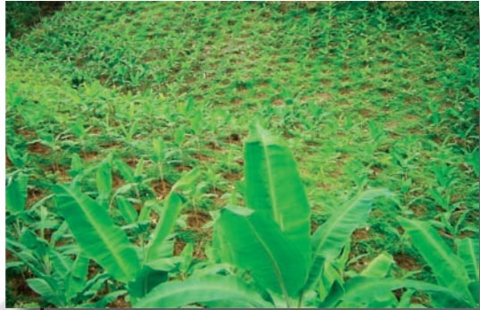
Foto 13. Cultivo de plátano limpio libre de malezas

Se debe mantener libre de malezas la zona de la planta (el plato), labor que se debe hacer en forma manual para no herir ni hacer daño a las raíces superficiales de la planta. Se cubre la zona con las mismas hierbas que se cortan para evitar que el sol y el agua golpeen fuertemente las raíces.