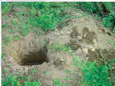
Foto 11. Sistema de ahoyado y tamaño del hueco

Una vez se hayan sembrado los cormos o plántulas de plátano, se repica alrededor de éste con el fin de ablandar el suelo y facilitar la penetración de raíces. En la zona donde se repica se puede aplicar materia orgánica y cal dolomita. En lo posible, colocar residuos de malezas alrededor de la planta recién sembrada, con el fin de aumentar la infiltración de agua, mantener la humedad, temperatura y evitar el salpique de aguas lluvias.