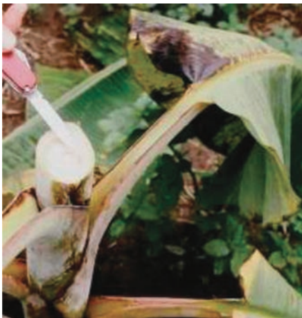
Foto 21. Planta afectada por moko o maduraviche