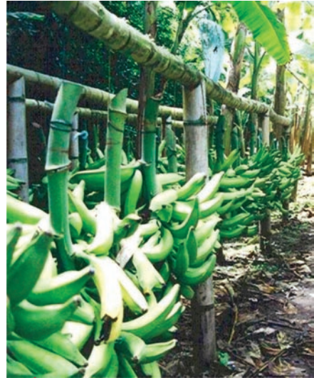
Foto 24. Estado óptimo de cosecha del racimo y almacenamiento

En la región el sistema tradicional de venta es por racimo y el precio de venta lo definen la oferta y la demanda, la cual varía según el mercado; a su vez, los costos para la formación del precio están condicionados por la distancia entre la zona de producción y el lugar de venta, así como por la facilidad de acceso. Sin embargo, los productores para aumentar sus ingresos, deben unirse y buscar sistemas de comercialización más eficiente que les permita vender su producto por peso y calidad.