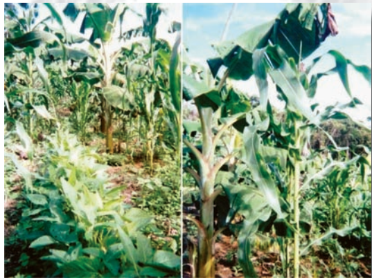
Foto 14. Plátano en asocio con otros cultivos de pancoger

La incidencia de las arvenses será menor si se maneja el cultivo con coberturas y sombríos transitorios de una manera adecuada. Los problemas con este tipo de plantas, son mínimos en cultivos de plátano bien manejados.