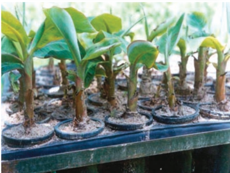
Foto 8. Colinos o cepas sembradas y desarrolladas en tubete