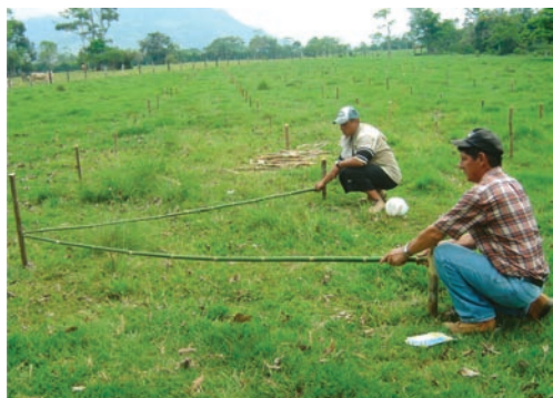
Foto 9. Sistema de trazado en triángulo