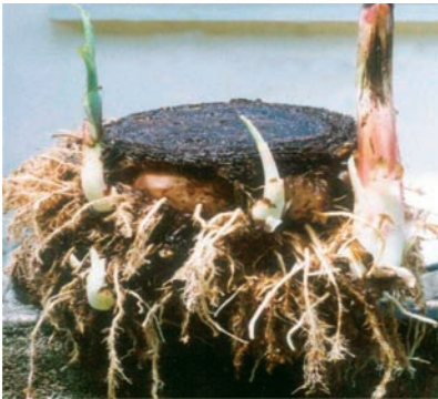
Foto 6. Tamaño de rebrotes a cosechar o cortar