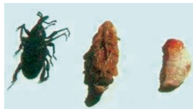
Foto 22. Características de la larva, la pupa y el adulto del picudo negro

Manejo: El principal medio de diseminación del picudo es a través de la semilla, por lo cual se debe utilizar semilla proveniente de plantaciones sanas. En las cosechas cortar los seudotallos a ras de suelo dejando cierta inclinación para impedir la acumulación de agua. Realizar prácticas complementarias como deshoje, deshije y eliminación de calcetas secas, donde habitualmente los adultos se esconden durante el día; controlar arvenses y residuos de cosecha alrededor de la planta, fertilizar adecuadamente y construir drenajes.