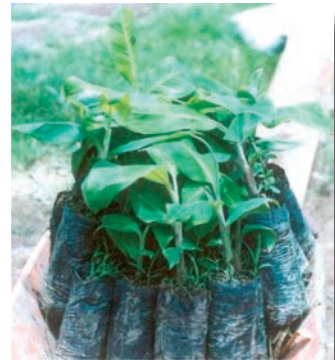
Foto 7. Colinos o cepas sembradas y desarrolladas en bolsa