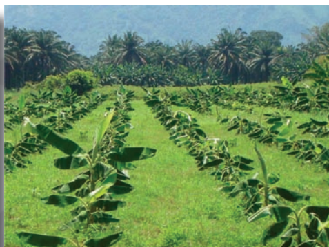
Foto 10. Cultivo de plátano orientado de forma correcta

terrenos pendientes permite un correcto manejo del suelo, los surcos deben ir en curvas a nivel para disminuir la escorrentía y evitar la erosión.