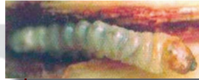
Foto 23. Reconocimiento de la larva de gusano tornillo

Es una plaga que presenta una alta incidencia en las zonas plataneras y su daño es a través de perforaciones tanto en el cormo como en el vástago, las cuales son vía de entrada para el ataque de otros insectos y patógenos, ocasionando disminución en los rendimientos y en la calidad de la producción.