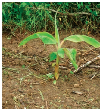
Foto 12. Colino sembrado de forma correcta