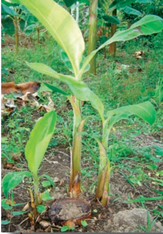
Foto 18. Eliminación total del vástago después de cosecha del racimo