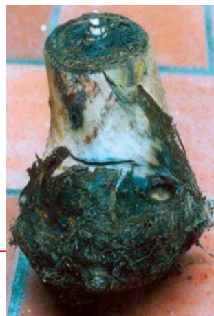
Foto 3. Calidad y tamaño ideal de la cepa para la siembra