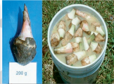
Foto 5. Desinfección de colinos