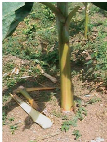
Foto 17. Eliminación de calcetas secas