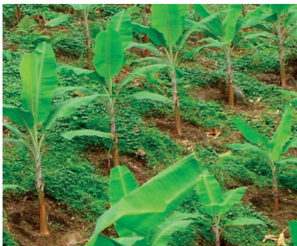
Foto 1. Plateo y aplicación de materia orgánica

El manejo orgánico del suelo es la alternativa sostenible que permite vivir en armonía con la tierra, ya que mantiene la productividad del suelo y mejora sus características físicas, químicas y microbiológicas.