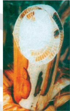
Foto 20. Características de la incidencia de bacteriosis

Manejo: Utilizar semilla proveniente de plantaciones sanas, fertilizar en base al análisis de suelo y exigencias de la planta, balancear especialmente los niveles de potasio y boro, hacer desinfección de herramientas cuando se realicen labores como deshoje, deshije y destronque.