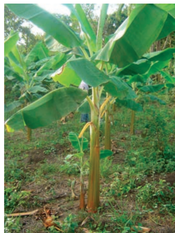
Foto 16. Eliminación de hojas amarillas, enfermas y secas

El descalcetamiento ayuda a disminuir el ataque de plagas y enfermedades que pueden tener sus focos de infección en las calcetas descompuestas.