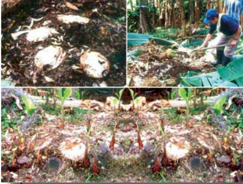
Foto 4. Inducción de brotes para semilla