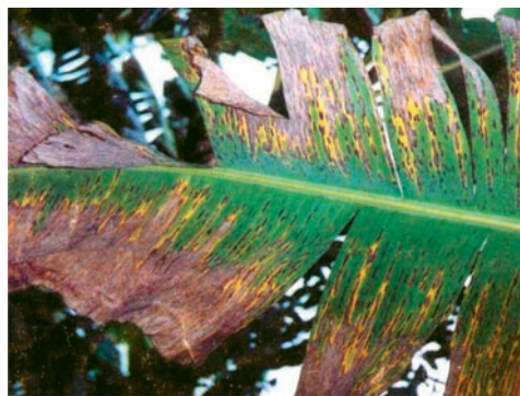
Foto 19. Sintomatología del ataque de la sigatoka negra