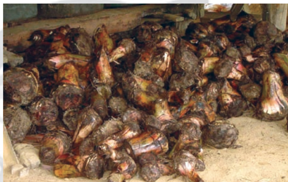
Foto 2. Tipo de semilla de plátano para la siembra