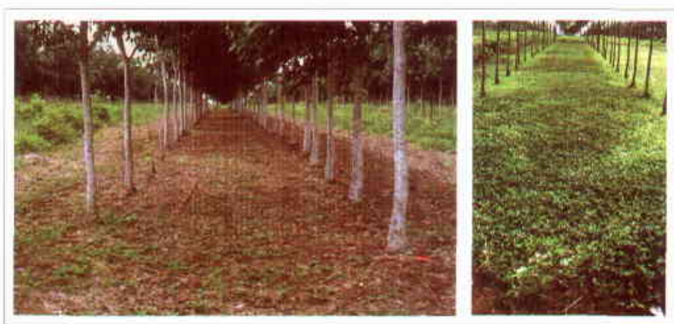
Utilización de Desmodium ovalifolium cv. Maquenque como cobertura en una plantación de caucho en los Llanos Orientales de Colombia.

En 1999, en el departamento del Meta se sembró en condiciones naturales (sin sombra) y bajo sombra un grupo de accesiones de leguminosas de las especies A. pintoii , D. ovalifolium y P. phaseoloides . Basados en los resultados iniciales, este trabajo se extendió con el fin de evaluar diferentes métodos de establecimiento para otros materiales promisorios usados como cobertura ( D. ovalifolium cv. Maquenque, entre ellos), en comparación con la cobertura normalmente usada de P. phaseoloides (kudzu) (Plazas et al., 2001).