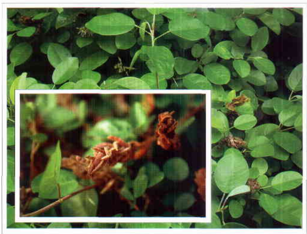
Plantas de Desmodium ovalifolium cv. Maquenque con inflorescencia y semillas.