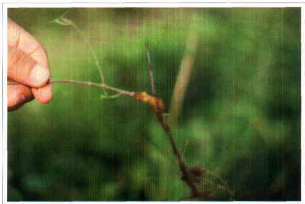
Desmodium ovalifolium (CIAT 350) afectada por el nemátodo del tallo.