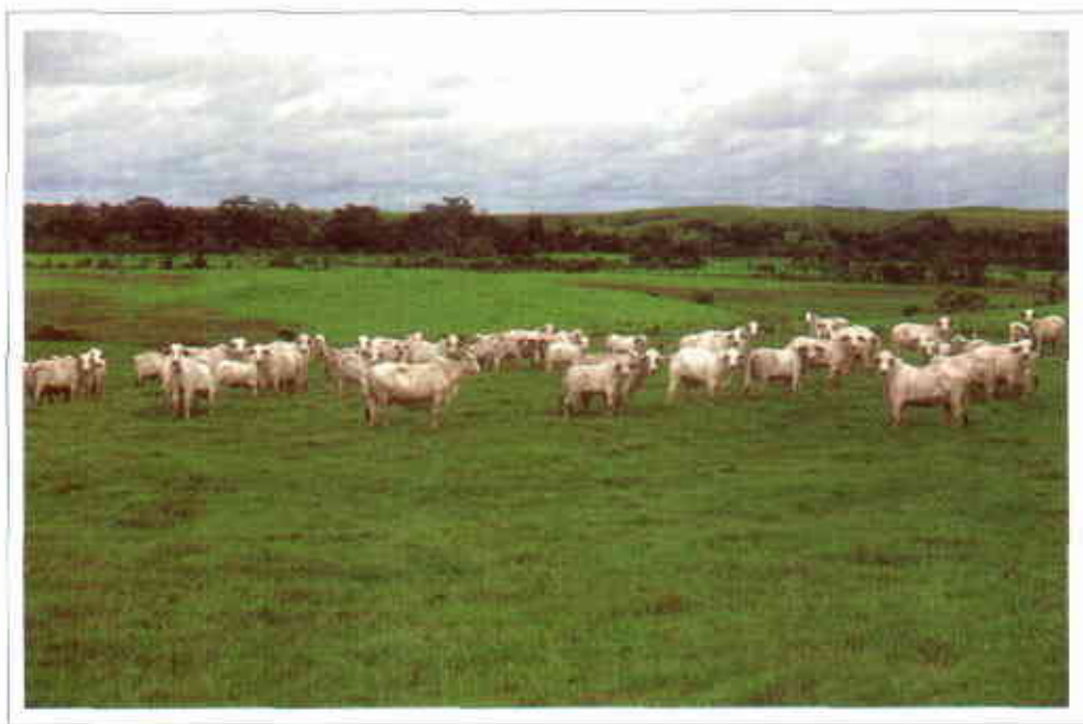
Asociación de Desmodium ovalifolium cv. Maquenque con Brachiaria humidicola . Nótese la alta capacidad de carga animal de esta asociación.

Como consecuencia de estos resultados y del menor costo de la semilla, en comparación con otras opciones de leguminosas, los productores de la región han mostrado interés en la adopción de esta tecnología para recuperar pasturas degradadas.