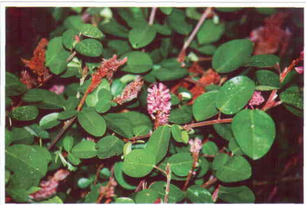
Planta de Desmodium ovalifolium cv. Maquenque con inflorescencias de color púrpura.

Desmodium ovalifolium se adapta bien a un amplio rango de sitios en Colombia, localizados entre 0 y 1300 m.s.n.m., pero prefiere zonas bajas (< 400 m.s.n.m.) con una precipitación anual superior a 2000 mm; no tolera periodos de sequía superiores a 4 meses. La planta crece y produce semillas en una gran diversidad de suelos, desde Oxisoles de baja fertilidad en las sabanas y el Piedemonte de los Llanos Orientales y la Amazonia hasta Ultisoles en laderas de Cauca y la zona cafetera (Schmidt y Schultze-Kraft, 2001). Se adapta a suelos con un pH entre 4 y 7, y tolera inundaciones de corta duración. La especie se adapta bien en condiciones de sombra, pero es susceptible a la quema (Franco et al., 1990; 1992a,b).