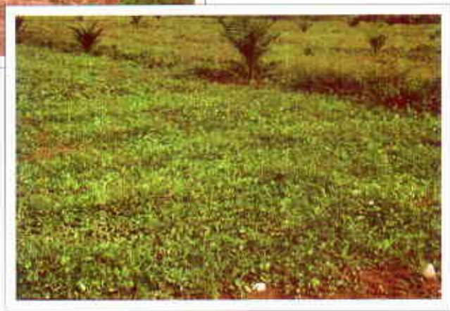
Establecimiento de Desmodium ovalifolium cv. Maquenque en una plantación joven de palma africana en los llanos orientales de Colombia.

se sembró asociada con B. humidicola en surcos distanciados 80 cm presentó una cobertura de 36%, 20 semanas después de la siembra (Gil et al., 1991). En Carimagua (Llanos Orientales), también utilizando material vegetativo en la siembra, presentó una cobertura del suelo de 85% cuando se estableció asociada con B. humidicola o B. dictyoneura , 7 meses después de la siembra.