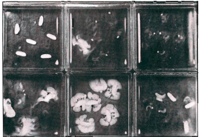
Foto 1. Grados de dispersión alcalina

cuando se emplea un tiempo normal de cocción queda muy crudo; el arroz con alta temperatura de gelatinización necesita más agua y más tiempo de cocción que los de temperatura de gelatinización baja o intermedia. Además los arroces con TG alta se elongan, expanden y rinden mucho menos después de cocidos.