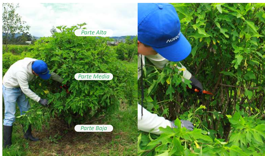
Figura 52. División de la planta y ubicación del sitio más adecuado para extraer la estaca.

Nota: División de la planta en parte alta, media y baja, para mostrar la parte adecuada para la extracción de material vegetal.