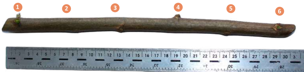
Figura 57. Longitud y número de nudos adecuados de la estaca para la propagación del botón de oro.

La estaca debe tener aproximadamente entre 30 a 50 cm de longitud (4 a 7 nudos dependiendo de la distancia entre estos), esto con el fin de que brote gran cantidad de ramas.