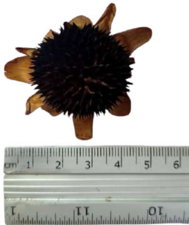
Figura 48. Cabezuela con semillas de botón de oro.

Nota: Cabezuela de aproximadamente 5 cm de diámetro, que contiene las semillas de botón de oro.