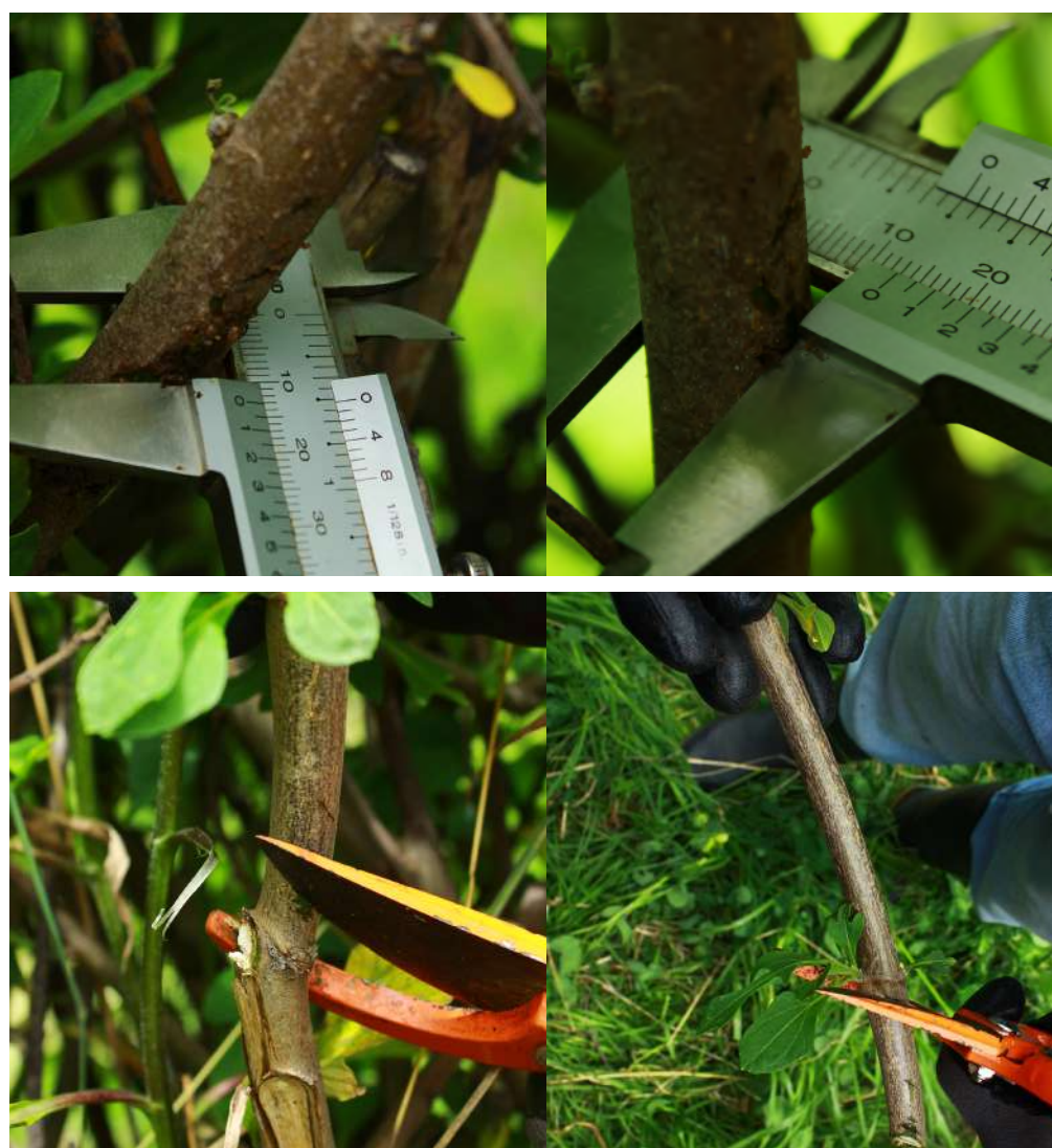
Figura 53. Diámetro del tallo apto para obtención de material vegetal.

El diámetro adecuado para obtener la estaca va entre 1 a 2,5 cm, y el corte se realiza en diagonal —bisel— por encima y por debajo del nudo de la rama.