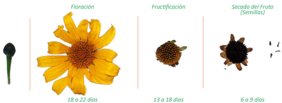
Figura 45. Desarrollo fenológico desde la formación de la flor hasta las semillas.

forma es alargada —oblonga—, de aproximadamente 6 mm de largo y cubierto de pelillos. Sus semillas son pequeñas, livianas y abundantes, con un diámetro de aproximadamente 2,9 mm; sin embargo, generalmente presentan una baja viabilidad y rendimiento para su propagación (Zabala-Laguna, 2021).