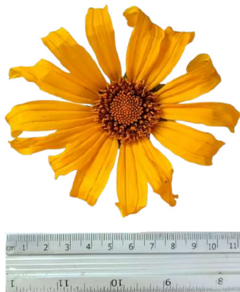
Figura 46. Inflorescencia de botón de oro.

Nota: Inflorescencia de botón de oro de coloración amarilla brillante, de aproximadamente 11,5 cm de diámetro, así como tipos de flores que presenta.