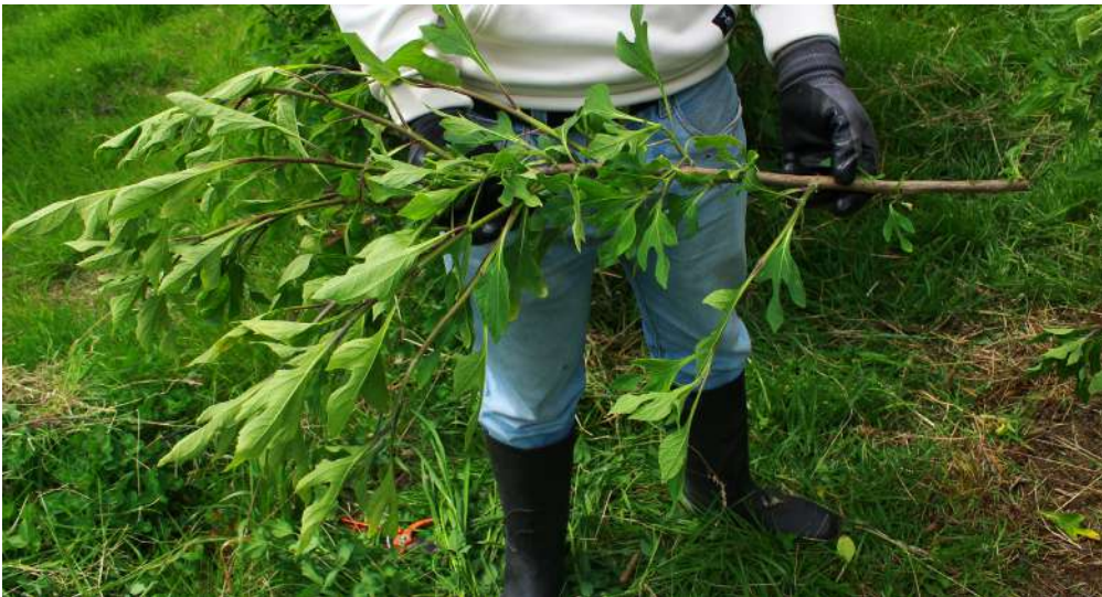
Figura 55. Rama cortada de la parte media del individuo de botón de oro.

Nota: Rama cortada y extraída de la parte media de la planta de botón de oro.