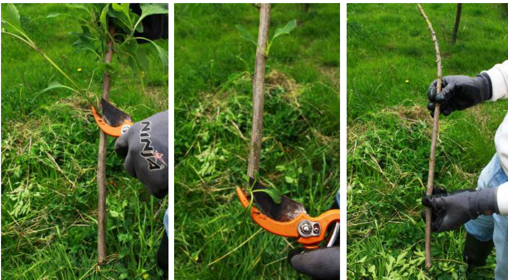
Figura 56. Corte de brotes y hojas para la limpieza de la rama.