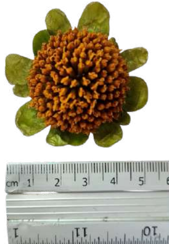
Figura 47. Infrutescencia que contiene los frutos de botón de oro.

Nota: Cabezuela (infrutescencia) de aproximadamente 5 cm de diámetro, que contiene los frutos (aquenio) de botón de oro.