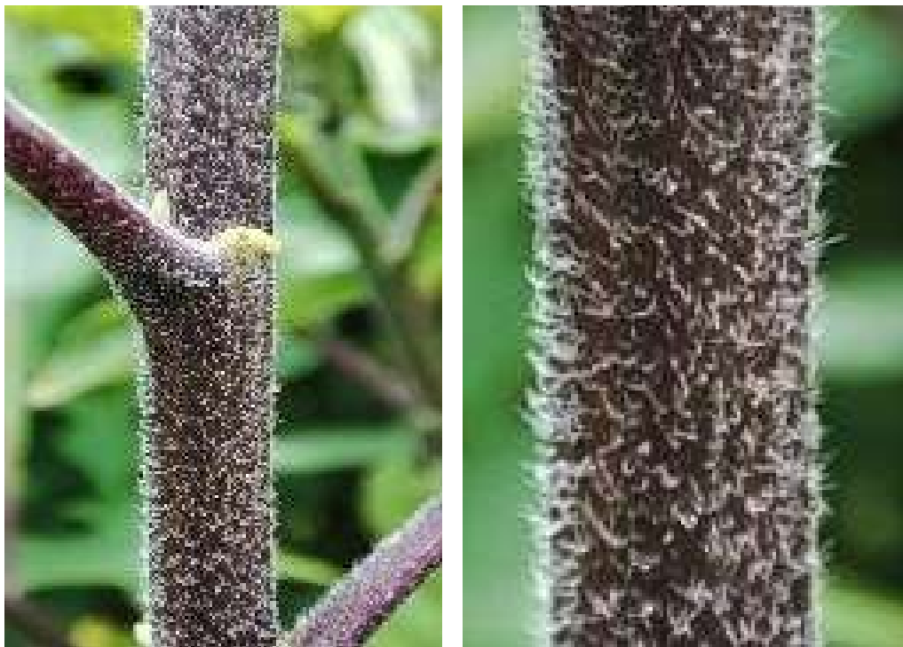
Figura 42. Rama tierna de botón de oro.