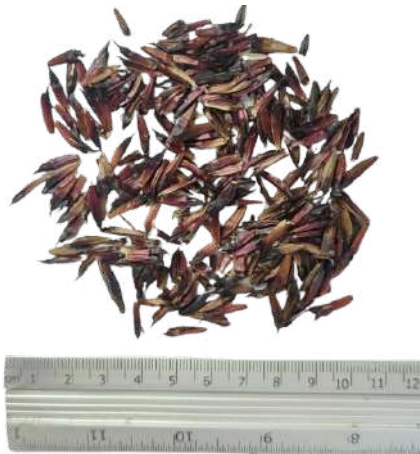
Figura 49. Semillas de botón de oro.

Nota: Semilla de botón de oro de aproximadamente 1,5 cm de longitud y semillas totales que contiene una cabezuela.