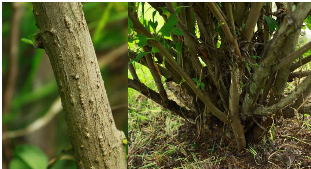
Figura 41. Tallo de botón de oro.

rior de la hoja —envés— está cubierta de vellosidades y la parte superior —haz— presenta puntos glandulares (Zabala-Laguna, 2021).