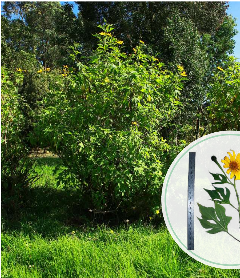
Figura 42. Individuo y características del botón de oro.

Es una planta arbustiva vigorosa de 1,5 a 4,0 m de altura, que presenta copa redondeada.