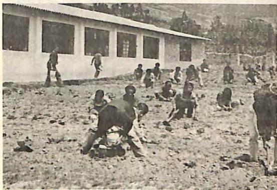
FIGURA 3. Granja escolar El Manzano, en Staquirá (Boyacá), donde los niños trabajan con el apoyo del ICA.