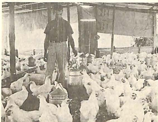
FIGURA 1. Este plantel avícola en Fusagasugá (Cundinamarca), envuelve la cooperación del usuario, la asistencia técnica del ICA y un crédito de $25.000 de la Caja Agraria.