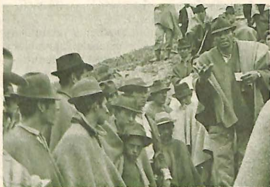
FIGURA 4. "... una participación activa, consciente". Un campesino explica cómo llevó a cabo una práctica exitosa.

El propósito general de este programa es buscar una participación activa, consciente y organizada de los campesinos en la orientación y ejecución de los planes de desarrollo rural que adelanta el Gobierno. Este programa se lleva a cabo mediante los proyectos de: Promoción y Formación de Organizaciones de Base (comités, cooperativas, grupos, etc.); Capacitación Campesina; y Proyectos de Desarrollo de la Comunidad.