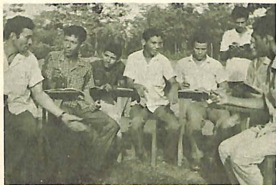
FIGURA 5. Un grupo de jóvenes en Sahagún (Córdoba), se reúne para analizar problemas de la comunidad.

CAJA AGRARIA, IDEMA, INDERENA, PINA, CORABASTOS, etc.) y con otras entidades guber-