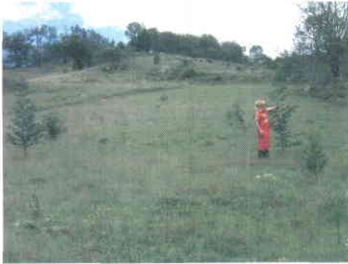
Comportamiento de la Acacia melanoxylum y decurrens en Concepción a los dos años de establecidas