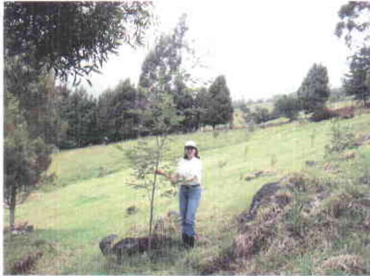
Crecimiento desuniforme de las Acacias en las localidades de Málaga y Concepción