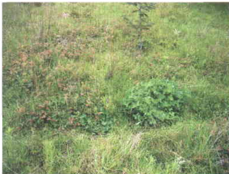
Diversidad florística en los sistemas silvopastoriles de las localidades de Málaga y Concepción.