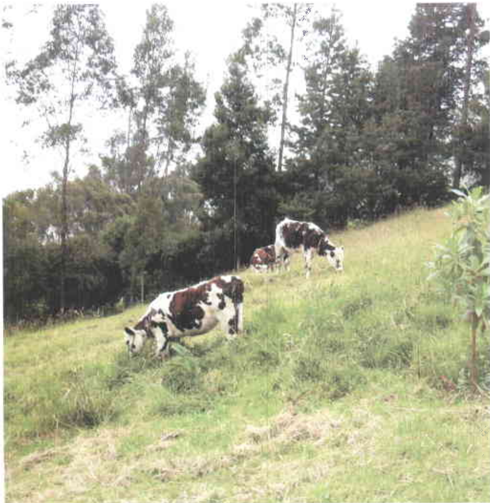
Pastoreo en un sistema silvopastoril recién establecido.

Con relación a los análisis bromatológicos, sólo se conocen los suministrados por Fernández (sf), quién reporta un 12.09% de proteína cruda para una pradera de Pennisetum clandestinum y Acacias , con una energía digestible de 2.64 Mcal/kg.