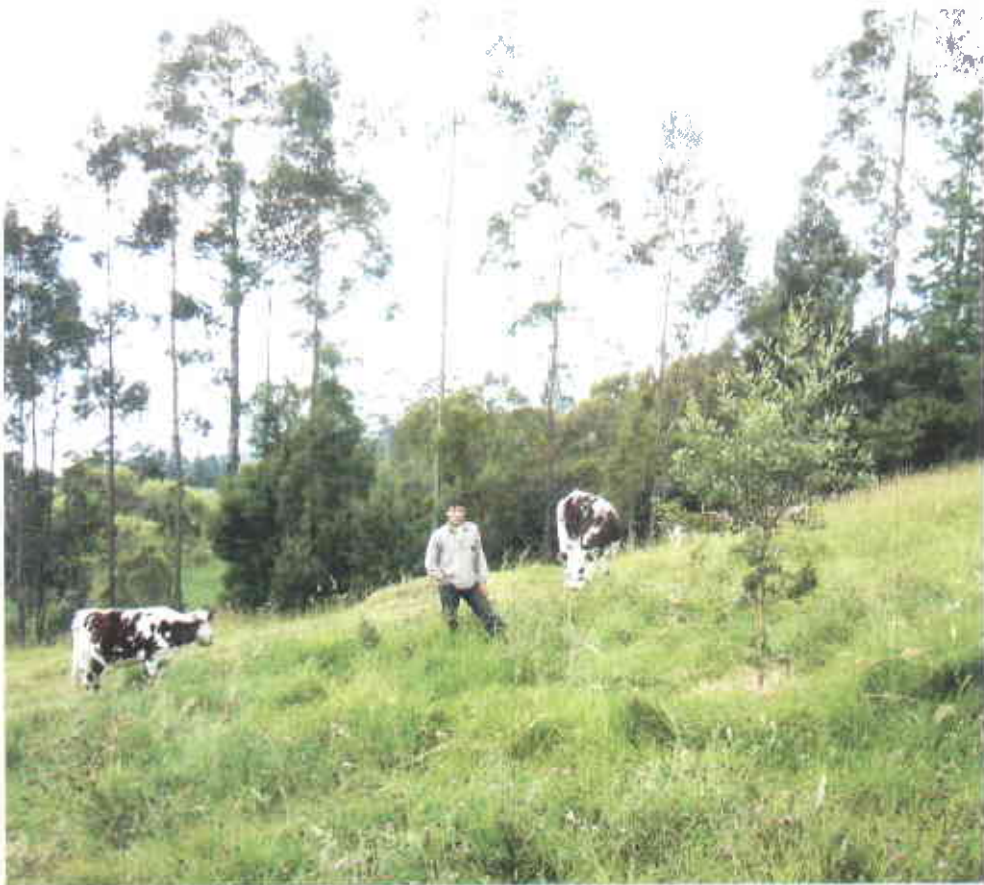
Relación hombre - suelo - pasto - árbol - animal