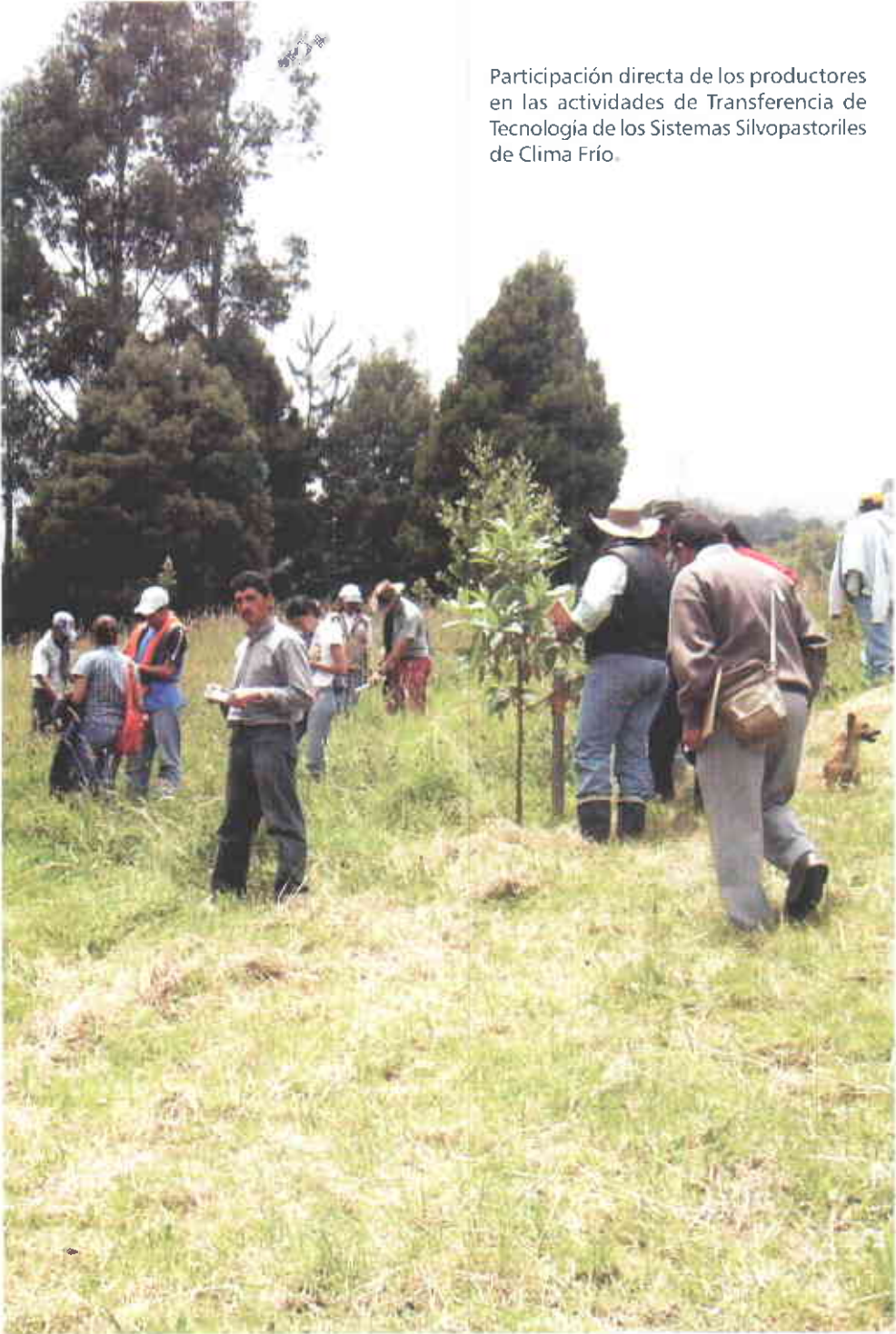
Participación directa de los productores en las actividades de Transferencia de Tecnología de los Sistemas Silvopastoriles de Clima Frío.