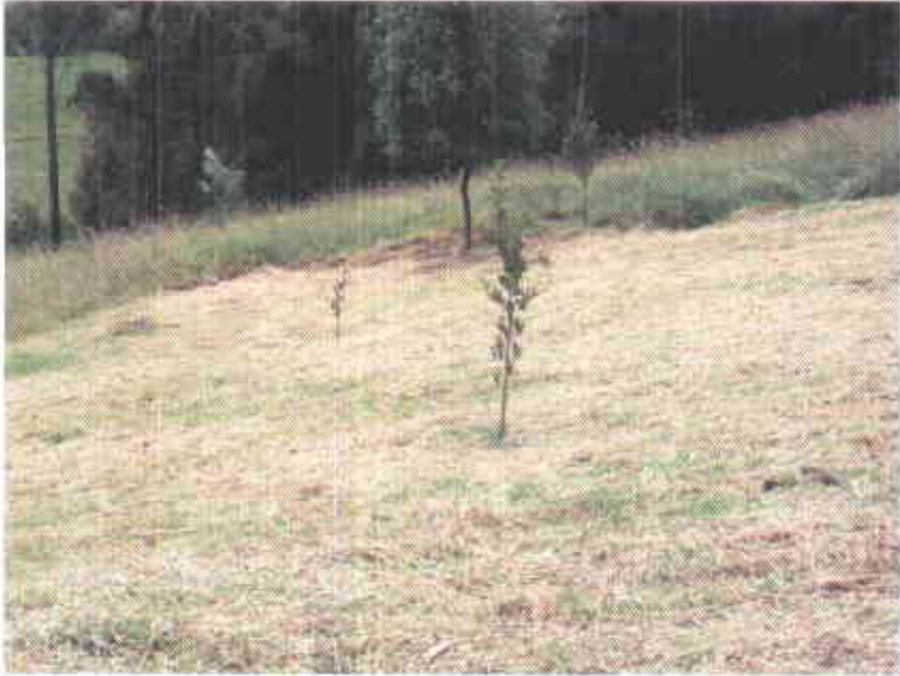
Manejo de la pradera con guadaña