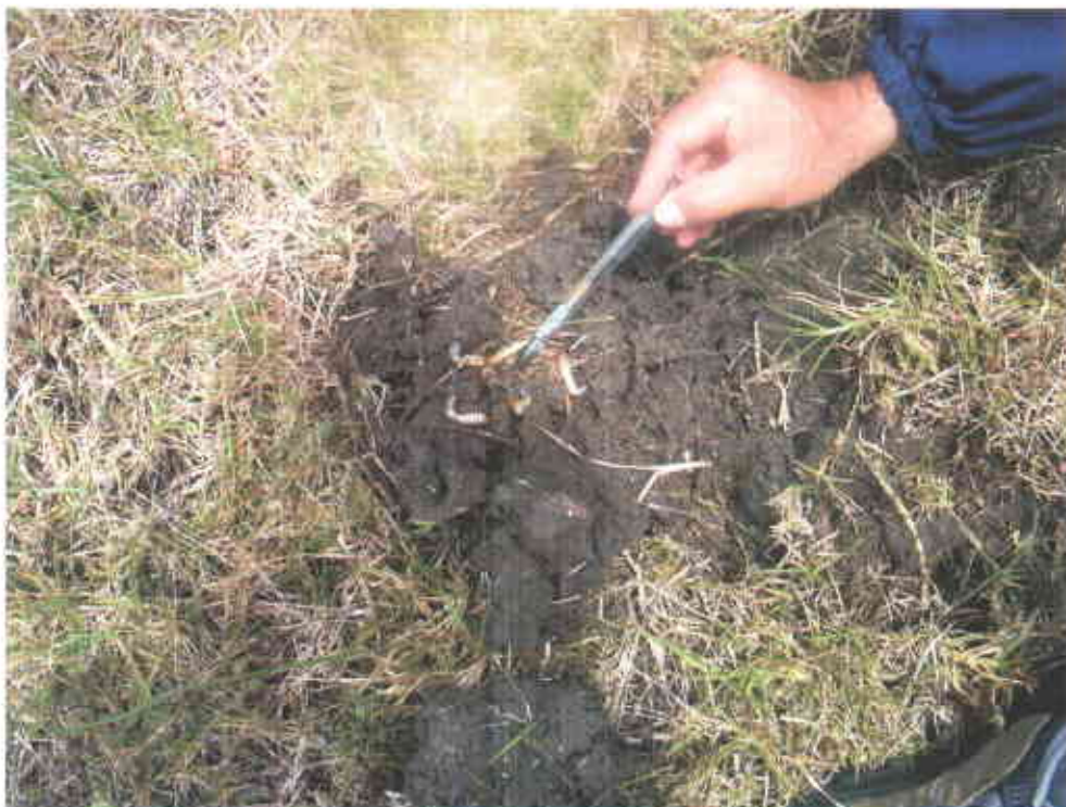
Presencia de chizas o mojoy que afectan los pastizales