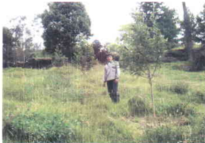
Comportamiento de la Acacia melanoxilum y decurrens en Málaga a los dos años de establecidas

Se hizo evidente la diferencia en el crecimiento de las Acacias , debido posiblemente a que no existió selección genética de los árboles semilleros, siendo inferior en Málaga, lo que puede atribuirse al encharcamiento observado en la pradera, condición que dificulta por parte de la planta el aprovechamiento de los nutrientes disponibles en el suelo. En Concepción el alto contenido de potasio en la capa arable, pudo haber contribuido a favorecer el crecimiento de la planta en este municipio.