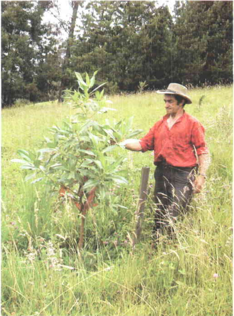
Escallonia pendula se muestra como promisoría para sistemas silvopastoriles, dado su rápido crecimiento y multipropósito.