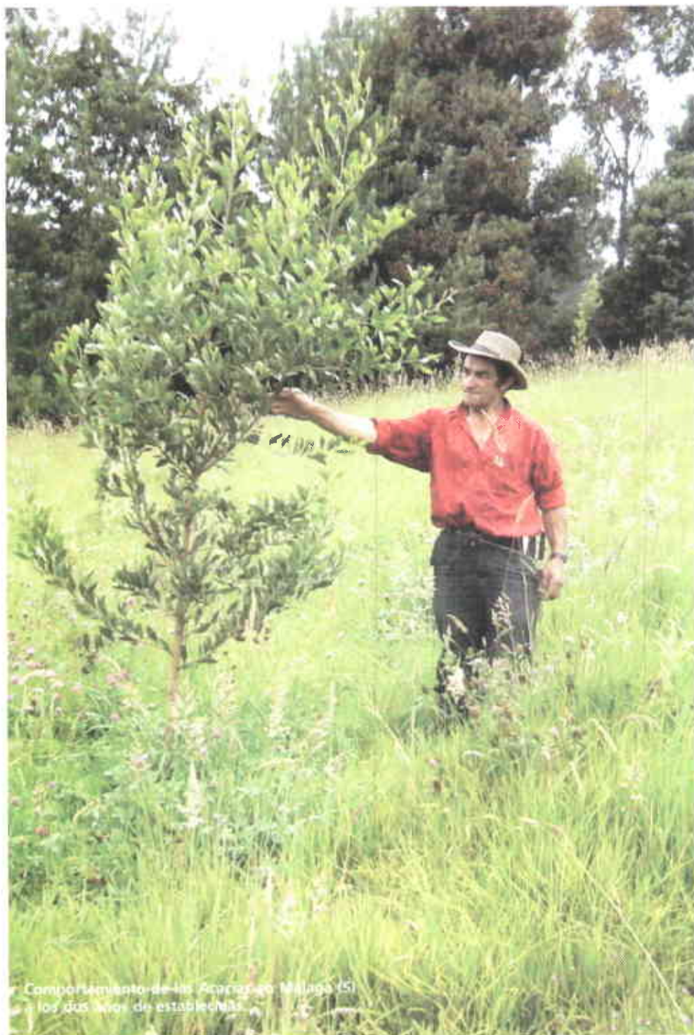
Comportamiento de las Acacias en Malaga (S) - los dos años de establecidas