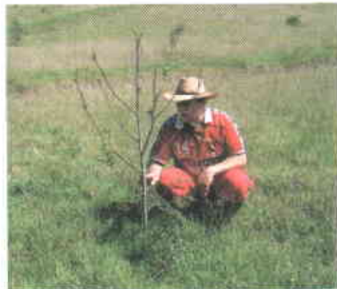
Pérdida por Acacias por diferentes causas, como: exceso de humedad y presencia de hongos radiculares