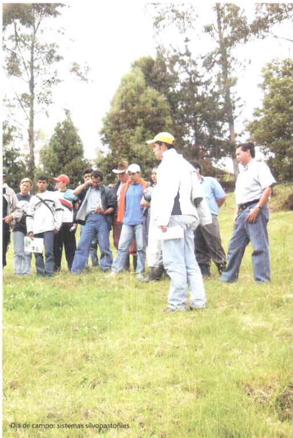
Día de campo: sistemas silvopastoriles.