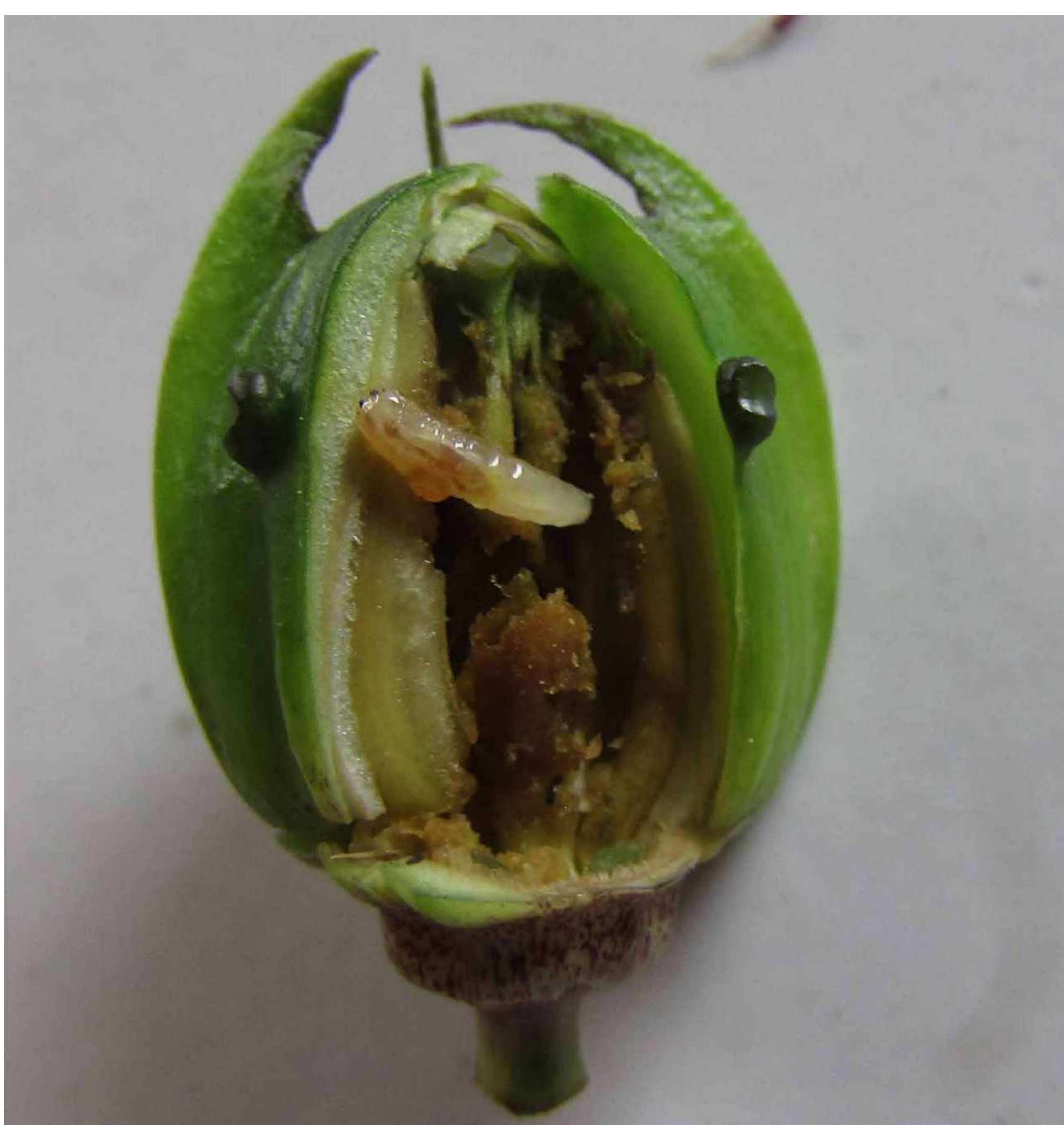
Figura 1. Botón floral de maracuyá con daño causado por larva de D.inedulis .

En Colombia las pasifloras son de gran importancia debido a que su exportación presenta una tendencia al alza y son muy apetecidas en el comercio internacional. Una de las especies de mayor importancia es el maracuyá ( Passiflora edulis f. flavicarpa ) (SIOC, 2018). Sin embargo, existen diversas limitantes que inciden en el rendimiento, como son el atraso tecnológico y los problemas fitosanitarios. La mosca del botón floral ( Dasiops inedulis ) es reportada como una de las principales plagas ya que afecta directamente la producción (Fig 1) (Santa maría et al., 2014). El manejo más usado para Dasiops spp. es basado en el uso de insecticidas de amplio espectro, con un uso excesivo y calendarizado (Quintero et al., 2009). Para realizar un buen control de la mosca, es necesario interrumpir su ciclo de vida, mediante algunas prácticas culturales e insecticidas con cebos (Delgado et al., 2010). Por lo anterior, este estudio tuvo como objetivo validar el manejo integrado de mosca del botón floral en maracuyá en La Plata (Huila).