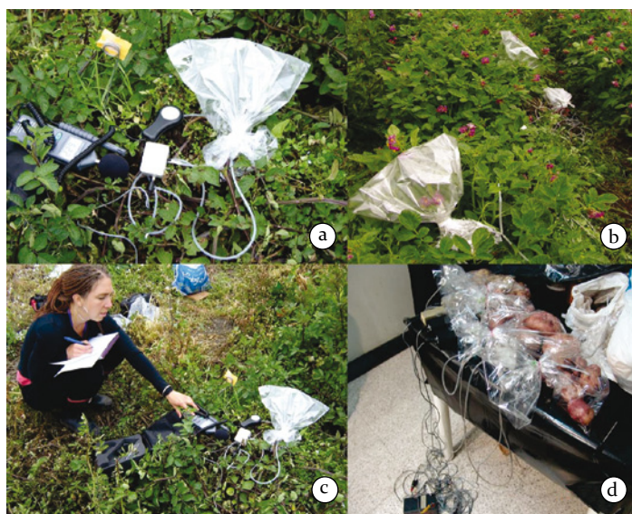
Figura 17. Colecta de volátiles emitidos por la planta de papa y tubérculos. a. Equipo de colecta de volátiles de campo; b. Colecta de volátiles de flores de la planta de papa; c. Instalación de equipos para colecta de volátiles en campo; d. Colecta de volátiles producidos por tubérculos frescos.

Recolección de los compuestos volátiles. El follaje de papa en las tres etapas fenológicas de desarrollo y los tubérculos ( n=8 ) se guardaron en un frasco de vidrio de 2 L cerrado con una tapa esmerilada en condiciones de laboratorio y en bolsas de plástico inodoro en campo (Figura 17). Una corriente de aire (150 mL/min) filtrada por carbón activado fluyó sobre el material vegetal desde la base del frasco hacia arriba y luego a través de una trampa especial para capturar volátiles, llamada Super Q, durante 14 horas. Después de la recolección de las muestras, las trampas fueron enjuagadas con hexano y se les añadió 500 ng de acetato de heptilo, compuesto que se usó como testigo para el proceso de cromatografía de gases.