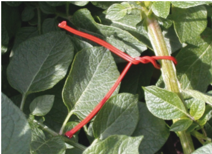
Figura 15. Dispensador de feromonas sintéticas para el control de T. solanivora en la interrupción de cópula instalado en un cultivo de papa.

cla de pocos compuestos son responsables de la atracción hacia el hospedero (Piñero y Dorn, 2007; Tasin et al. , 2007; Knudsen et al. , 2008; Cha et al. , 2008). El conocimiento de los aleloquímicos que guían a la hembra a sitios adecuados para la oviposición o alimentación es esencial para entender las interacciones entre la planta y el insecto, y para el desarrollo de nuevas estrategias para el control de plagas agrícolas (Cook et al. , 2007; Witzgall et al. , 2008).