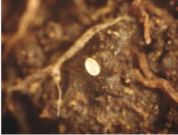
Figura 16. Huevo de Tecia solanivora en el suelo.

Teniendo en cuenta lo anterior, y dado que la polilla tiene hábitos nocturnos, se puede pensar que esta utiliza los compuestos volátiles producidos por la planta para encontrarla. Los volátiles producidos por la planta de la papa han sido estudiados de forma preliminar (Visser et al. , 1979). De igual forma, el análisis detallado de los compuestos producidos por las plantas en los diferentes estados fenológicos aun no han sido explorados, lo cual sería interesante si se tiene en cuenta que T. solanivora prefiere ciertos estados fenológicos de la planta de papa. El estudio resumido en este capítulo (Karls-son et al. , 2009) es el primer estudio que aborda este tema y que fundamentalmente es la base para el desarrollo de una estrategia de control mediada por compuestos volátiles.