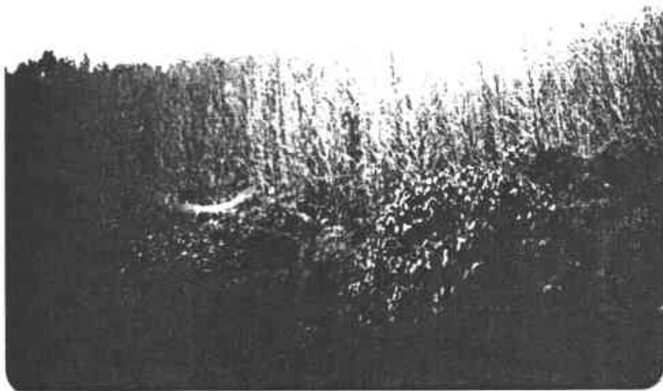
FIGURA 4. Defoliación de una plantación de pino pátula en El Retiro, Antioquia, causada por el geométrido Cargolia arana .