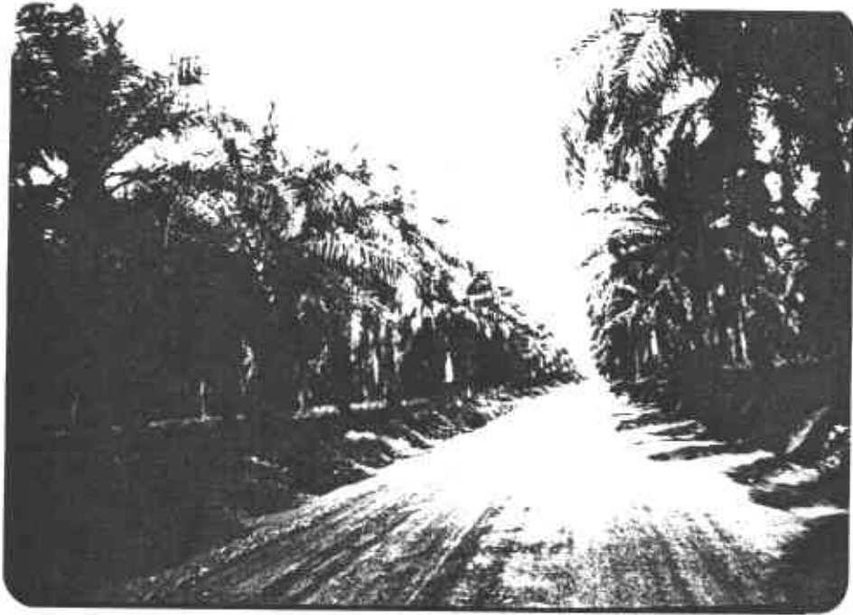
FIGURA 3. Aspecto de una plantación de palma africana en la zona de Puerto Wilches.