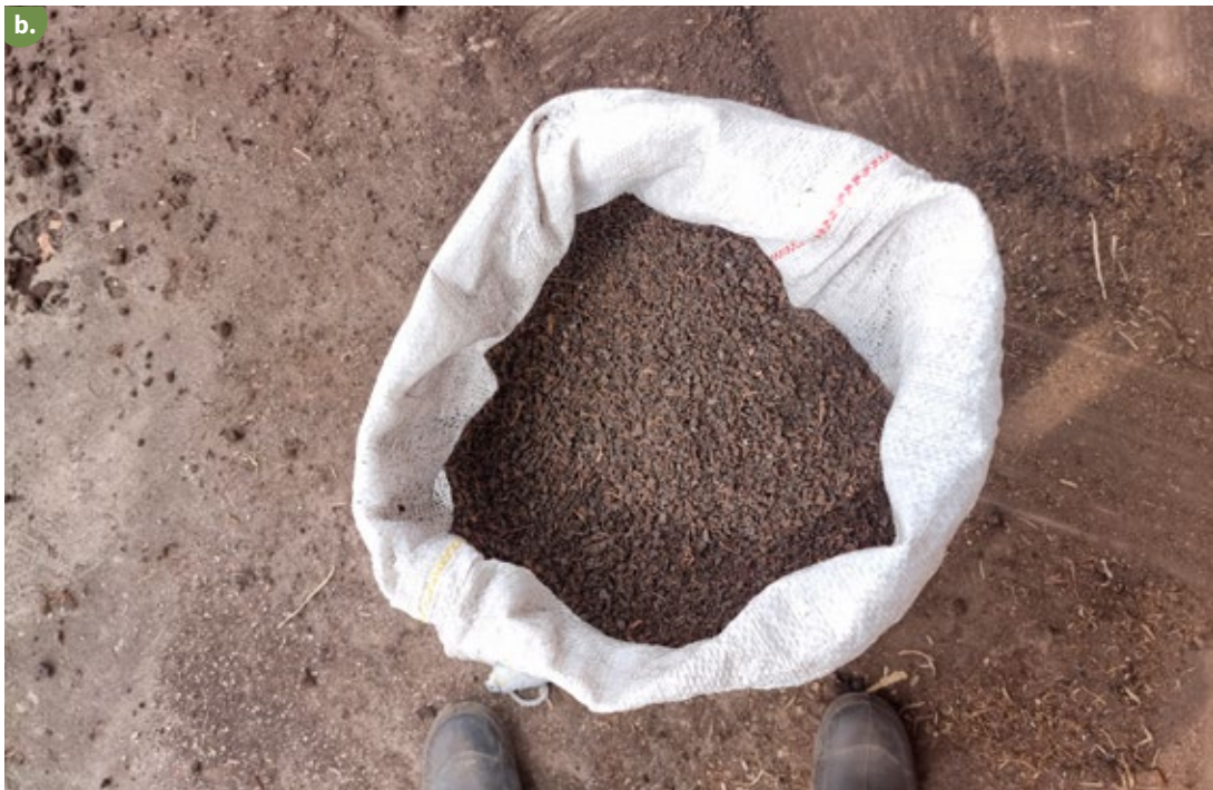
Figura 13. Compost final para ser usado en campo. a. En la pila para ser llevado a campo; b. Empacado para distribución después de la molienda.