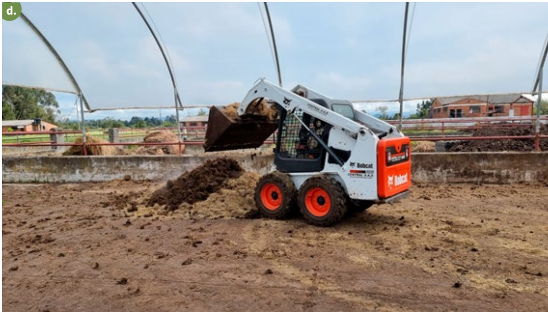
Figura 11. Preparación de los materiales para formar la pila de compost. a y b. Estiércol; c. Hojas y ramas secas; d. Mezcla de materiales.