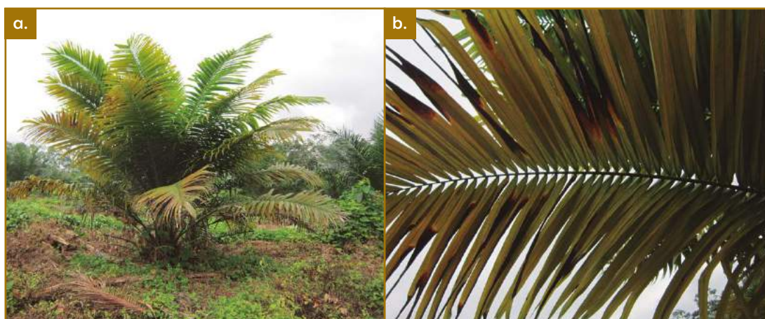
Figura 8.2. Síntomas de marchitez sorpresiva a. Síntomas palma; b. Síntomas hoja.

El primer síntoma visible de ms es una clorosis foliar generalizada unida a un secamiento de los ápices de los folíolos de las hojas del tercio inferior de la palma (figura 8.2). Luego el secamiento se extiende a toda el área foliar de estas hojas y a las puntas de los folíolos de las hojas del tercio medio. Simultáneamente se presenta aborto de inflorescencias, así como pudrición de flechas y raíces. Los frutos de los racimos pierden su brillo normal y se desprenden con facilidad cuando aún están verdes. En estados avanzados, se presenta secamiento total del área foliar; internamente la zona del meristemo se pudre y se forma una masa líquida de olor característico. De esta última condición se origina el nombre en inglés de la ms: hartrot (podredumbre amoniaca).