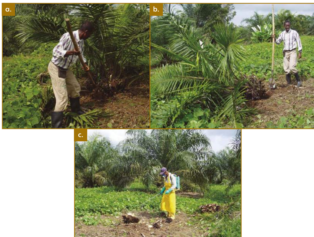
Figura 8.1. Manejo de mancha anular (MA) y anillo clorótico (AC). a. y b. Erradicación de planta; c. Aplicación de insecticida.