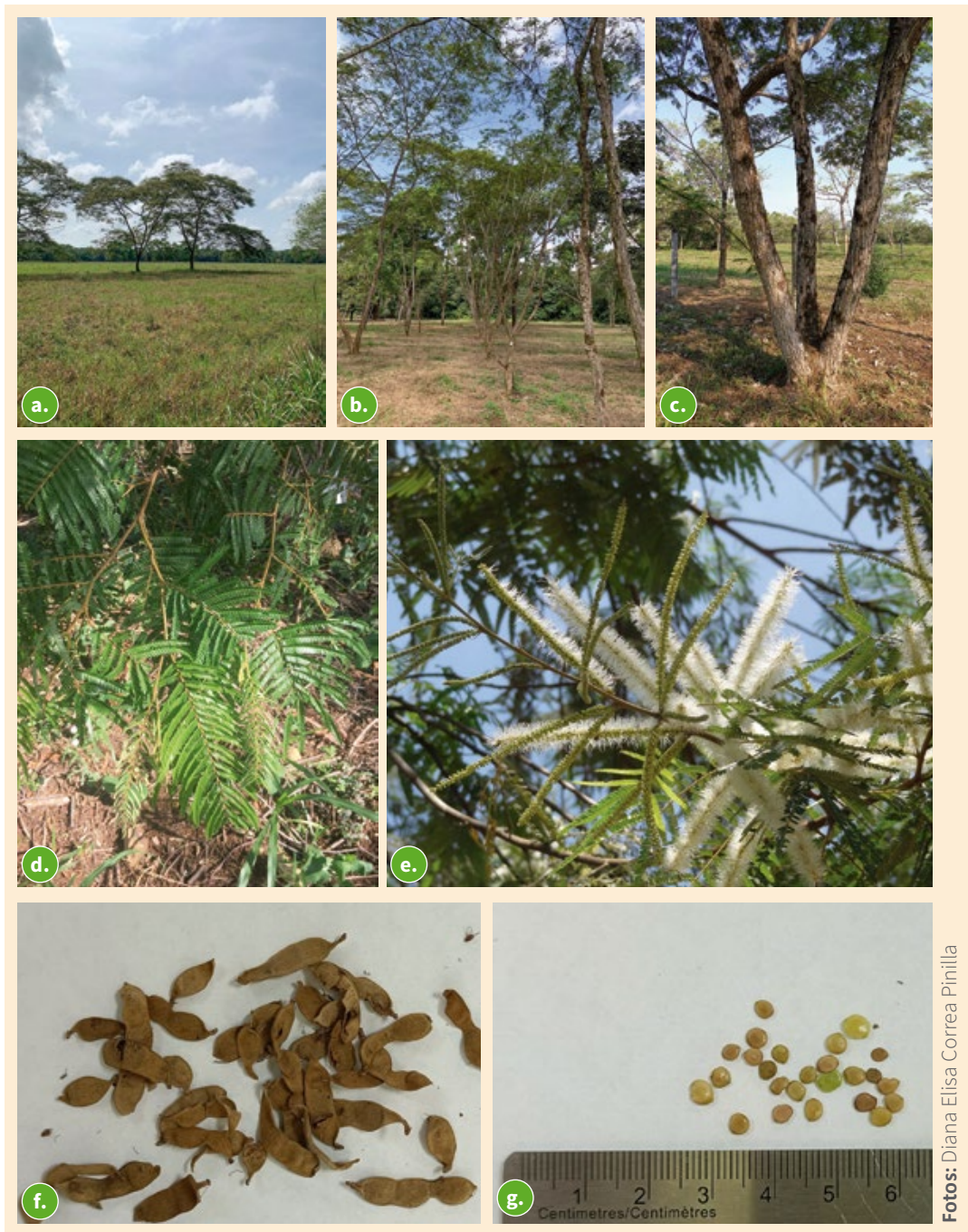
Figura 12. Estructuras del árbol de yopo ( M. trianae ). a. Árbol; b. Tronco; c. Corteza; d. Hojas; e. Flores; f. Fruto; g. Semillas.