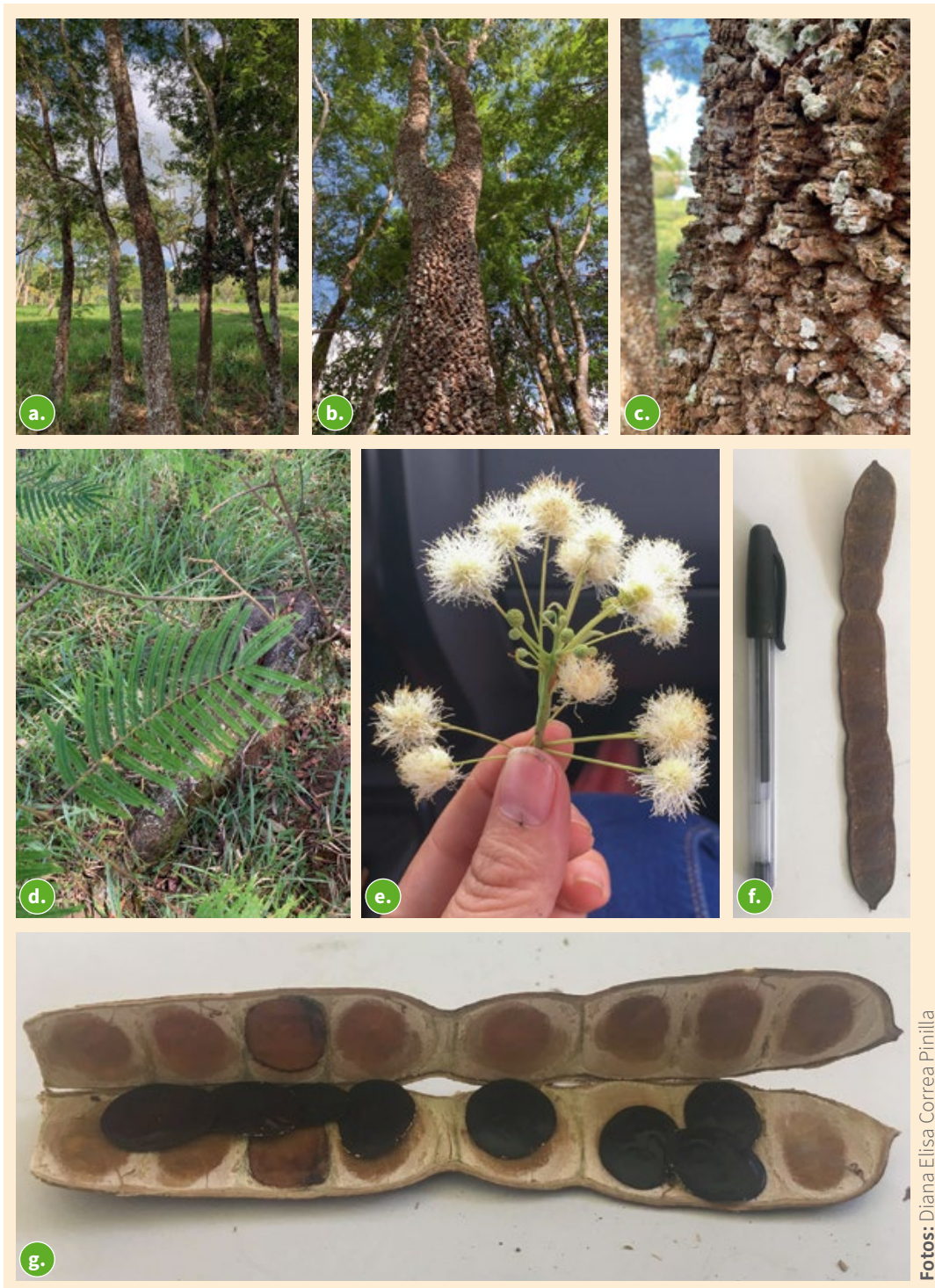
Figura 16. Estructuras del árbol A. peregrina . a. Árbol; b. Tronco; c. Corteza; d. Hojas; e. Flores; f. Fruto; g. Semillas de A. peregrina .