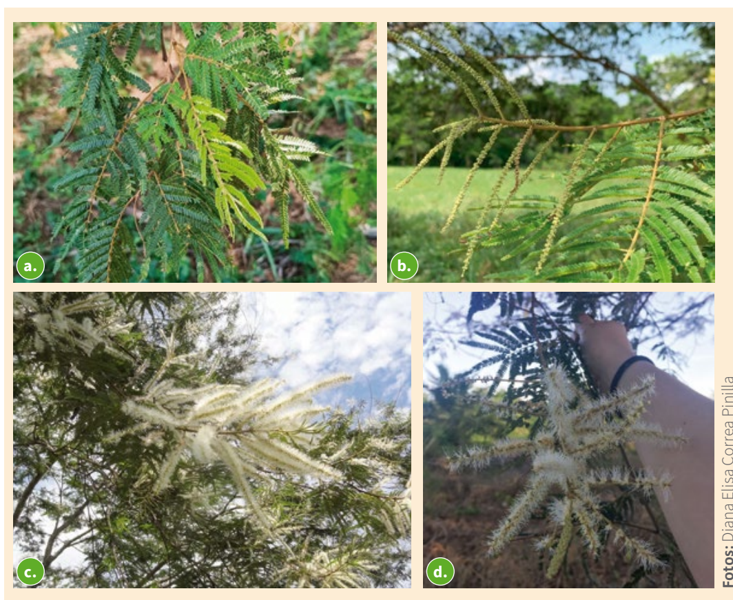
Figura 14. Etapas de desarrollo de la inflorescencia. a. Formación; b. Desarrollo; c. Apertura floral; d. Marchitamiento y caída.

Floración: el yopo ( M. trianae ) tiene un periodo de floración durante el segundo semestre del año, que comienza entre octubre y noviembre con la aparición de las inflorescencias (figura 14a), las cuales tardan aproximadamente dos meses en desarrollarse (figura 14b), y alcanzan el punto máximo de floración entre diciembre y enero, con la apertura de los botones florales (figura 14c) y su posterior marchitamiento en enero y febrero (figura 14d).